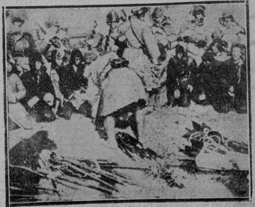
LOS SUCEOS DE ORIENTE.—Soldados japoneses en el momento de detener a una patrulla de bandidos chinos