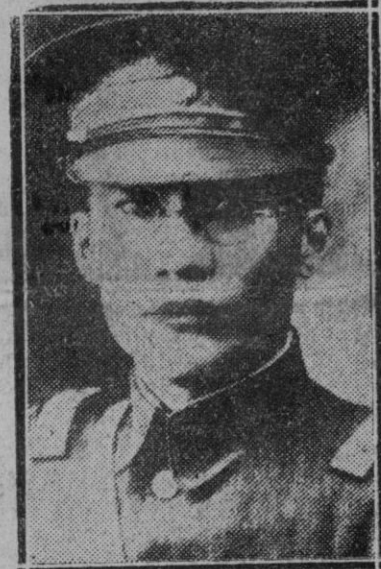
EXTRANJERO.—El general Wen Tu Chen, alcalde de Xangai

Japón, viendo que por la parte de los soviets no había ningún peligro, empezó a oponerse firmemente a la