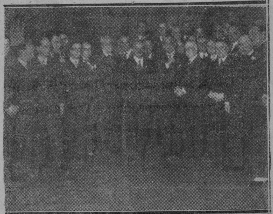
MADRID.—Inauguración de los nuevos locales de la Unión Ibero-Americana con asistencia del Cuerpo diplomático Hispano-Americano