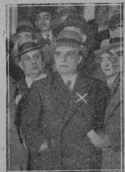
MADRID. Don José Ortega y Gasset saliendo de Palacio, después de ser consultado.