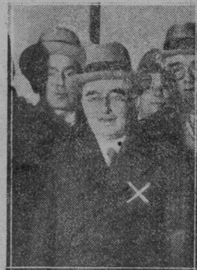
MADRID.—El General Blanco (x) al salir de Palacio.