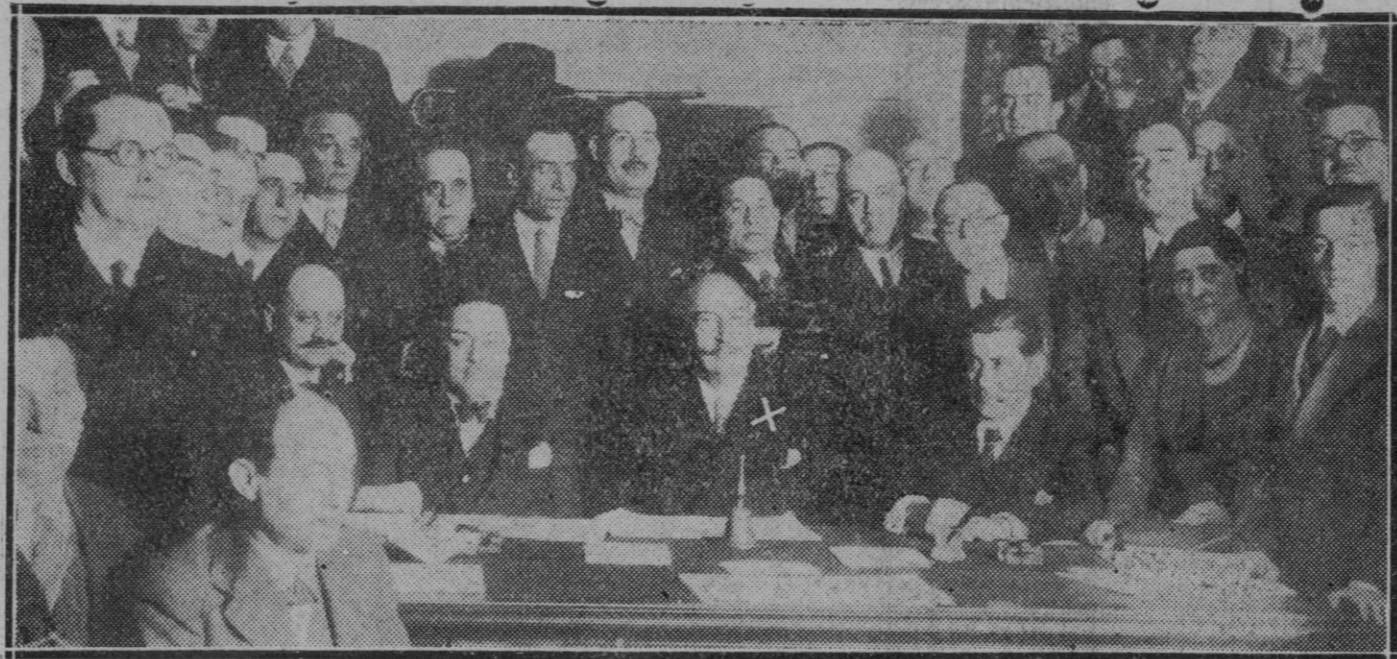
MADRID.—La minoría radical reunida en el Congreso para tomar acuerdos, bajo la presidencia del señor Lerroux (x) y en cuya reunión se acordó en principio seguramente la actitud que ha adoptado

Por todo ello merece ser encomiado el acto generoso de los rotarios mallorquines que se hizo público en el acto que celebraron ayer.