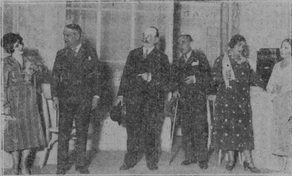
Madrid. Una escena de la comedia «La cursi del hogar», estrenada en el teatro Cómico por la compañía Prado Chicote.

Pero, el dinero prestado ha de invertirse en obras de esta naturaleza. Invertirlo en obras que crearan déficit, que no compensaran, sería comprometer el porvenir económico del Ayuntamiento, y derivar para más adelante los mismos problemas con la agravante de que cada operación de crédito limitaría la libertad del Ayuntamiento por cuanto su crédito se compromete en ellas.