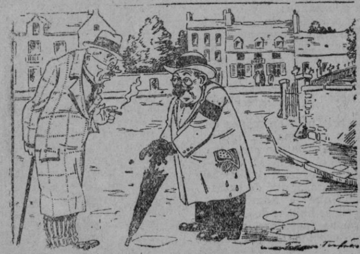
—Aquí donde V. me ve, he estado muy cerca de la muerte. —¡Ah! Cuénteme eso. —¡V en go de enterrar a mi suegral

Esas «autoridades financieras», doctas en el calor de las finanzas, sabías en el embrollo dialéctico nunca revelarán en sus explicaciones interesantes o pedantes las verdades mas sim-