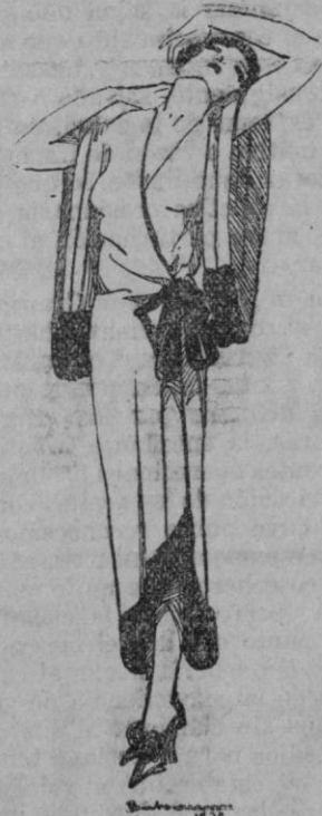
Elegantísimo kimono en mangas japonesas. En crepé saten amarillo y negro.