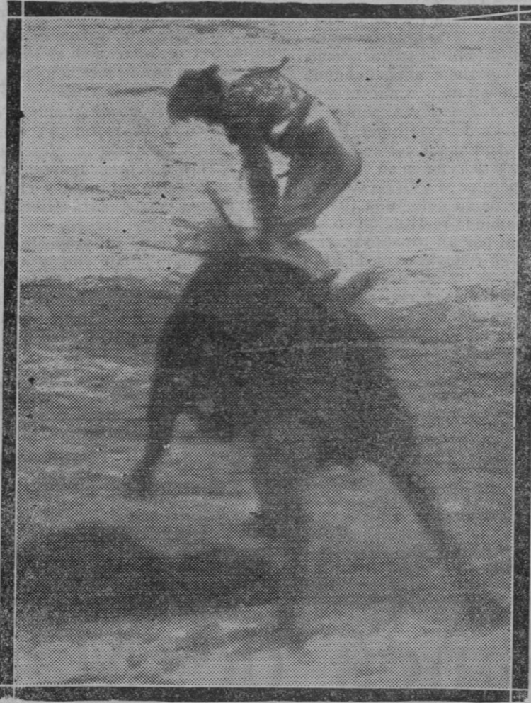
Emocionante momento de la cogida de Alcalareño II a consecuencia de la cual falleció a los cuarenta minutos

Mucho celebramos que se persista en tales gestiones y que se interesen nuestro representantes en Cortes por el restablecimiento de la Escuela de Náutica de Palma, gestión que, como hemos dicho, deseamos se lleve a cabo con todo éxito.