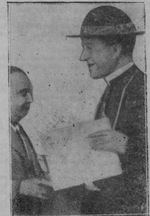
Monseñor Tedeschini, al salir de la reunión celebrada en el Ministerio de Estado con motivo de la reclamación presentada al Vaticano

A la muerte de Madero aumentaron las huestes de Villa y de Zapata de una manera tan considerable que llegaron a reunir verdaderos ejércitos. Reconocido entonces Venustiano Ca-