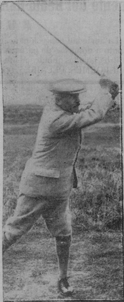
Ramsay Macdonald aprovechando el Week-end juega al golf en Lormemouth