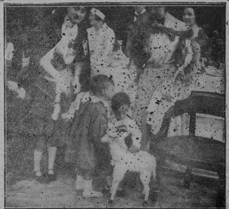
Los niños de las familias que residen en los Fuertes de Halles (Francia) hacen un regalo al príncipe heredero de Marruecos Muley Nassan, que, con su padre, ha visitado dicho lugar

El más afortunado de los soberanos desterrados es el sultán de Tur-