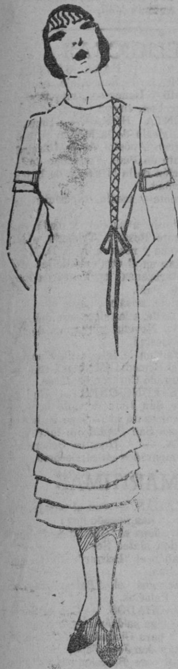
Sencillo y bonito vestido para la playa en toile blanca. En la falda y mangas volantitos en forma.

color muy suave y en tonos pardos, "bis", o champaña. Para eso todos los tejidos sirven, pero, convendrán especialmente los "lainages", como el "jersey", y la tela de lana, el "shantung", de lana, el Alasna y también los tejidos más claros como el piqué el Sinellic, el "shantung", la "toile", y el crespón "marocain".