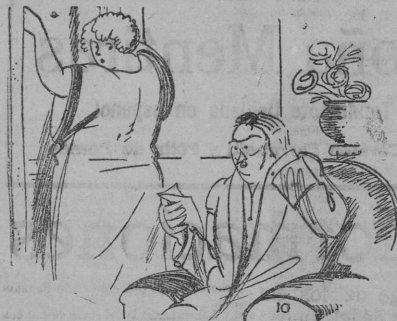
UN BUEN OLFATO

- Y mi amor crecerá como la labor de mi amor. Mi corazón echa chispas como la piedra de afilar.