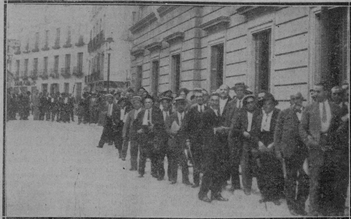
MADRID. — Los presidentes de los Colegios electorales de Madrid, formando cola en la puerta del Congreso para hacer entrega de los certificados de las elecciones.