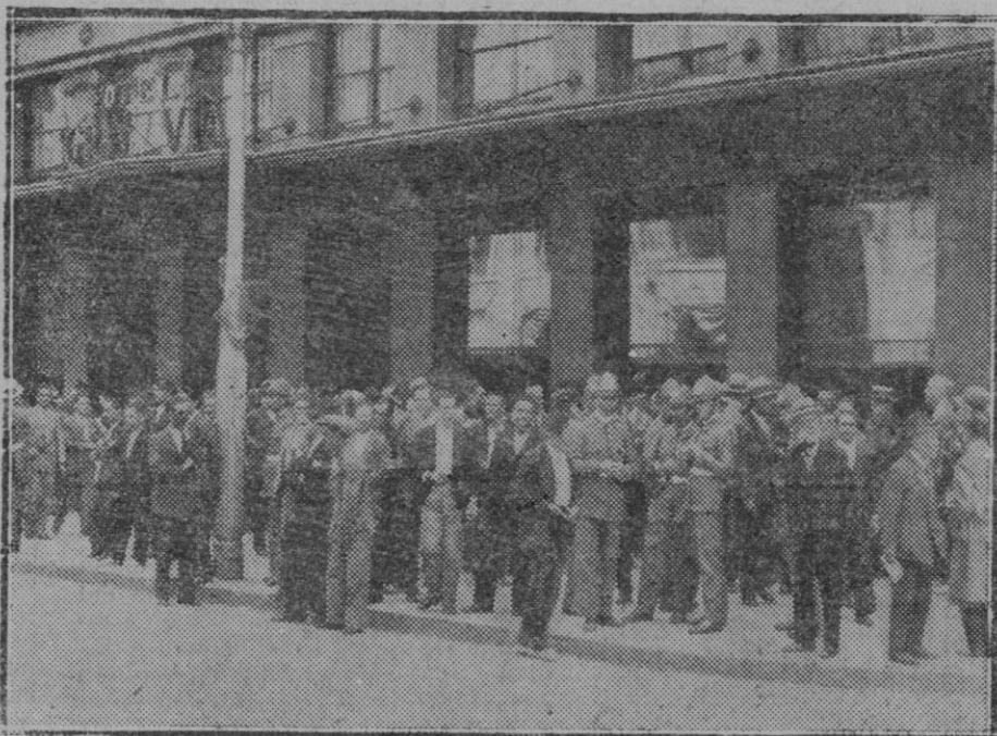
MADRID. — De la huelga del personal de teléfonos.—Grupo de huelguistas frente al edificio de la Telefónica vigilados por los guardias de Seguridad.

Y 3.º Que habiendo optado por otras obras, como la del nuevo Merca-