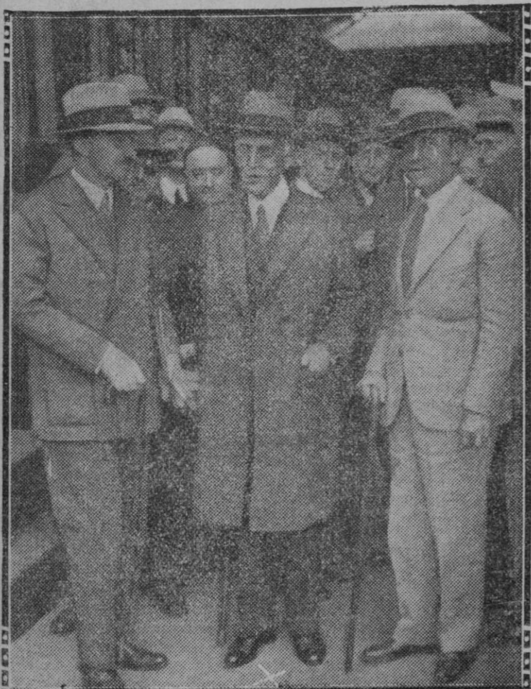
FRANCIA.—El Sr. Mellon, secretario de Estado de la Tesorería Americana, a su llegada a París procedente de Londres, para conferenciar con el Gobierno francés respecto a la propuesta Hoover