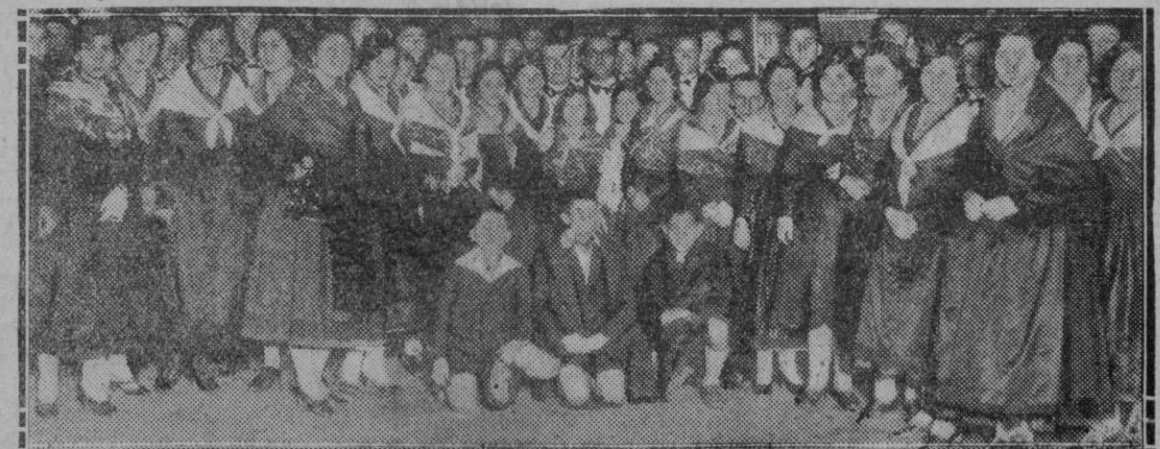
MADRID.—La masa coral Cacerreña que tomó parte en el festival celebrado en la plaza de Toros