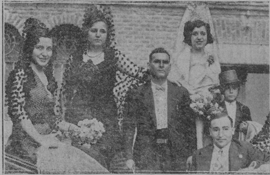
MADRID.—Señoritas que presidían la becerrada de la Sociedad "Los Cortadores", celebrada ayer tarde en Madrid

Tres son los candidatos a ocupar este puesto distinguido. Uno de ellos, sólido, es nacional y tiene la ventaja de poder ser suministrado por Francia misma y por sus colonias. Es la leña. No debe entenderse que se quieran hacer funcionar los vehículos con el vapor o quemando leña o carbón, pues de lo que se trata es de utilizar esta leña en el gasógeno,