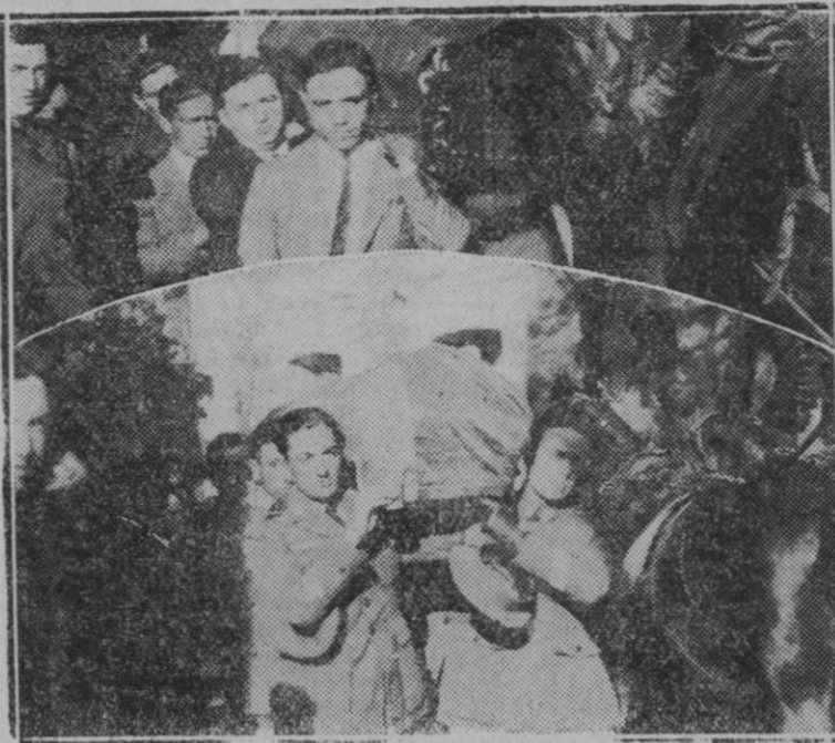
Entierro de los aviadores muertos como consecuencia del accidente de la aviación ocurrido el miércoles en el aeródromo de Cuatro Vientos