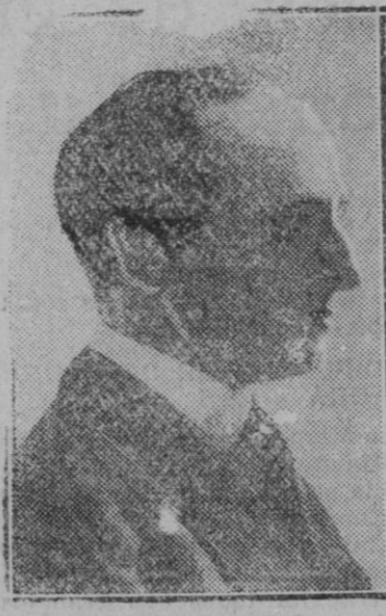
Don Santiago Casares Quiroja, Ministro de Marina