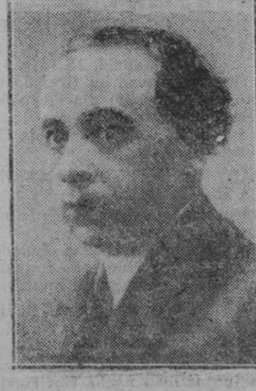
Don Alvaro de Albornoz, Ministro de Fomento