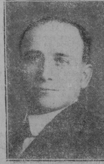
Don Francisco Largo Caballero, Ministro del Trabajo