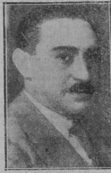
Don Miguel Maura y Gamazo, ministro de la Gobernación