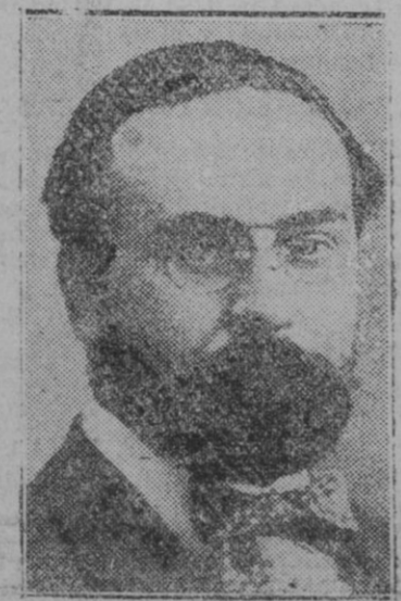
Don Fernando de los Ríos, Ministro de Gracia y Justicia