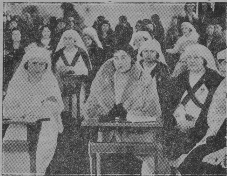
MADRID.—Su Alteza X la Infanta doña Cristina presidiendo la inauguración del curso de enfermos en el Hospital de San José y Santa Adela

Cuando tenga que procederse a la distribución de los créditos previstos en los nuevos presupuestos para los diversos servicios de conservación y reparación de carreteras, a lo que entendemos hemos de permanecer atentos, es preciso que aportando cuantos apoyos podamos conseguir, exponamos con todo apremio la necesidad de que sean mejoradas las carreteras de esta isla.