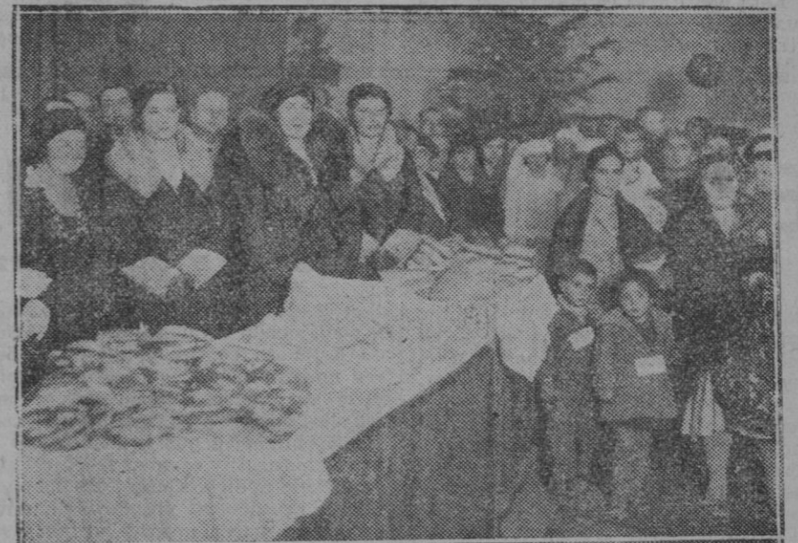
MADRID.—Su Majestad la Reina con las Infantas doña Beatriz y doña Cristina, repartiendo panes y roscones a los niños pobres en el Hospital de San José y Santa Adela

Como se ve la idea, tanto desde el punto de vista de la irrigación como de la producción de fuerza, lejos de ser mala o mediana, es excelente. No hay duda de que al cabo del año se pierden inútilmente muchos millones de caballos de fuerza, que quizás bastasen para remediar la penuria mundial y para corregir muchos olvidos de la naturaleza que a determinados países los ha desprovisto de toda hulla negra y hasta blanca. Así perderían gran parte de su importancia el petróleo, el carbón y todos esos combustibles, por los cuales se mata la humanidad, disponibilidad de la