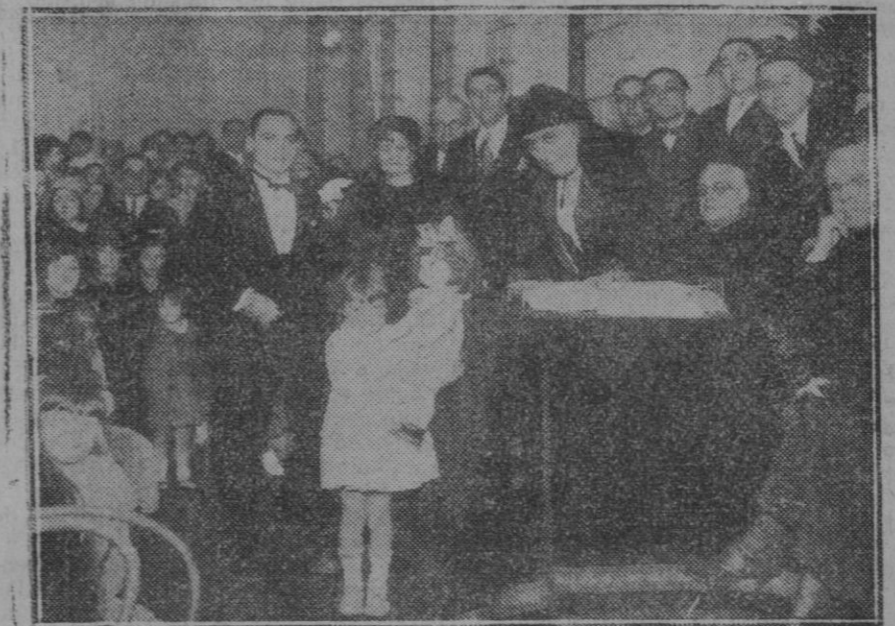
MADRID.—La fiesta de "Pro-Infancia".—Su Alteza la Infanta doña María Luisa haciendo entrega de muñecas y juguetes a los niños