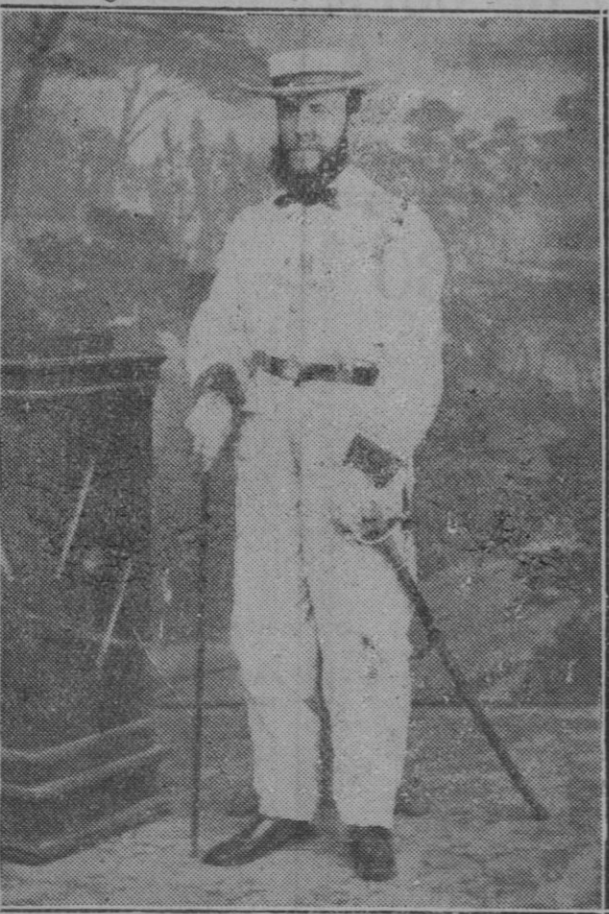
El ilustre caudillo cuando era coronel jefe de los voluntarios de Valmaseda, que tan famosos se hicieron en las guerras coloniales