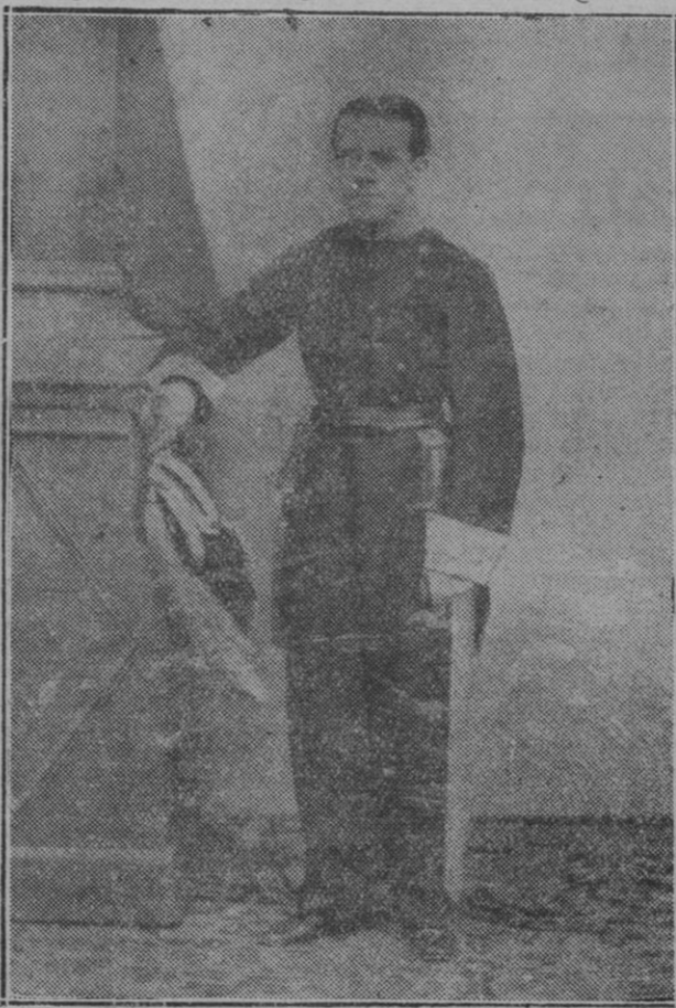
El General Weyler, cuando siendo Jefe de Estado Mayor, fué a Cuba, donde tomó parte en la acción de Jaina, por la que le fué concedida la Cruz de San Fernando, la primera que fué concedida por juicio contradictorio

Nombrado en 1896 general en jefe del Ejército en Cuba, realizó en ella