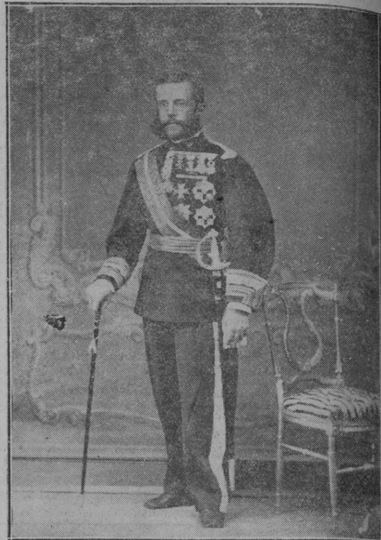
El General Weyler en la época que estando de Brigadier en Valencia, se cubrió de gloria en la batalla de Boicairte, siendo ascendido a Mariscal de Campo

norario del Regimiento Infantería de Aragón, Caballero de la Insigne Orden del Toisón de Oro y de la Militar de San Fernando, y se hallaba en posesión de las siguientes Grandes Cruces españolas: Mérito Militar y Mérito Naval Rojas, María Cristina, San Hermenegildo y Carlos III. Entre las extranjeras poseía las de San Benito de Avis y Cristo, de Portugal; Gran Cordón de la Legión de Honor, Cambrodge, Pontificia del Santo Sepulcro y Basilio de Castilla en la ciudad Orden, Elefante Blanco de Siam, San Mauricio y San Lázaro de Italia, y Al Mérito de Chile.