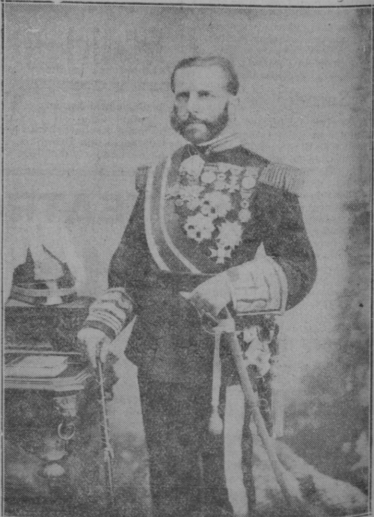
El General Weyler cuando fué nombrado Capitán General de Filipinas

El parte dice: "El capitán general Weyler ha fallecido en la tarde de hoy. Por expresa disposición del fideicomiso no se invitará al entierro, ni se admitirán coronas."