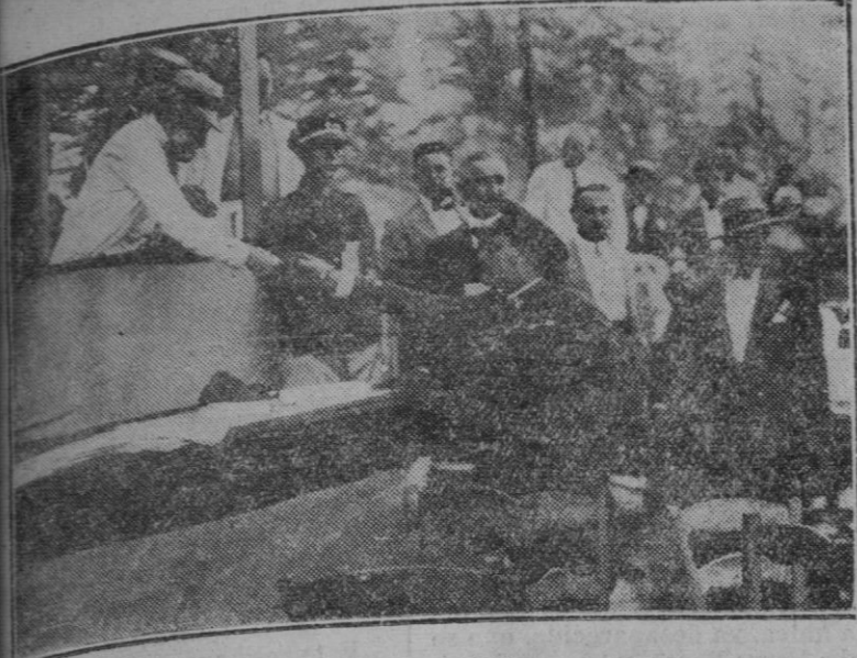
El General Weyler en el campo de la R. S. Hípica Mallorquina, repartiendo los premios en uno de los últimos concursos hípicas celebrados en esta ciudad.