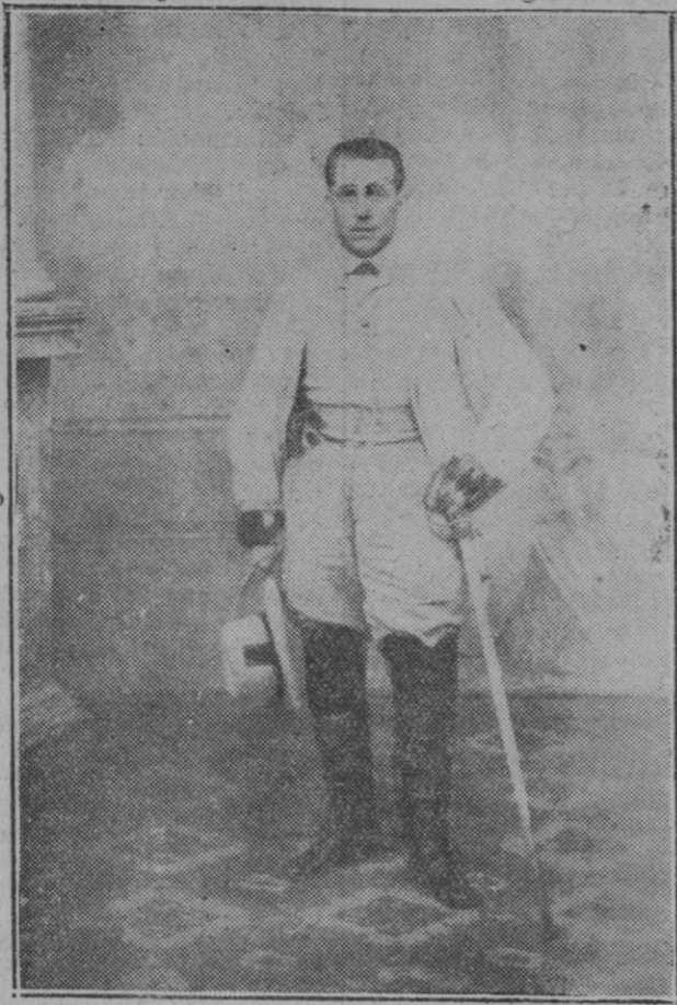
Nuestro ilustre paisano cuando fué ascendido a teniente coronel de caballería, en Santo Domingo, por méritos de guerra