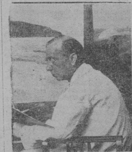
MADRID.—Ha muerto en esta capital el ilustre pintor don Ricardo Verdugo Landi, notable marinista. Acertó a interpretar en sus lienzos las bellezas y fina sensibilidad.

Parece que en el mundo entero hay en la actualidad una gran preocupación por el turismo. Los viajeros expresan al regreso el entusiasmo con que son acogidos en los centros oficiales de todos los países que visitan. Touring Clubs, Automóviles Club, hoteles, ferrocarriles, líneas de vapores y cámaras de comercio rivalizan para conseguir el mejor éxito del turismo. Agencias de viajes enlazadas en todas partes del mundo, de Chile a Rusia y de España a Japón, dan al turista la bienvenida oficial y le proporcionan guías.