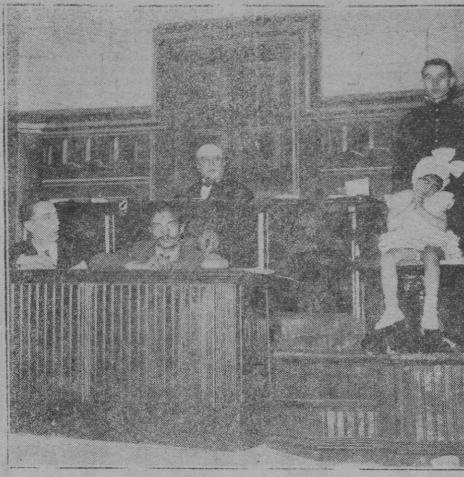
MADRID.—Una escena de "El crimen de Juan Anderson", en el Teatro Reina Victoria

se hará preciso la unión de socialistas, católicos, populistas, agrarios... Y se vislumbra la posibilidad de una dictadura de Hindenburg como único medio de evitar las dictaduras que ambicionan los imperialistas exaltados y los comunistas revolucionarios.