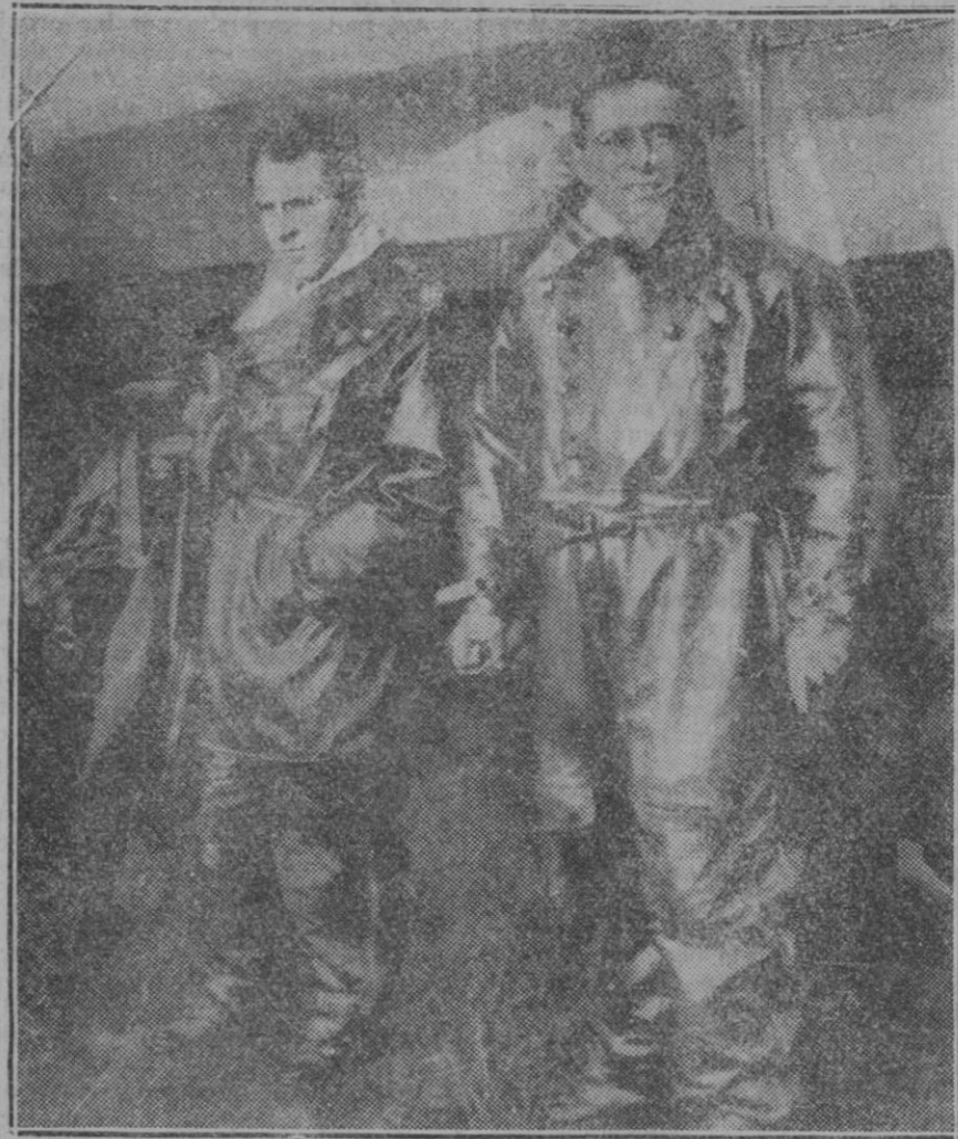
EXTRANJERO—UNA SOBERBIA HAZAÑA.—Costes y Bellonte aterrizan felizmente en Nueva York, después de haber invertido en el vuelo treinta y siete horas y ocho minutos.

Este retraimiento en nada favorece a la patria, y por consiguiente lejos de establecer medidas que lo aumenten, debe procurarse con mayores facilidades interesar a todos para que cívicamente ejerciten sus derechos.