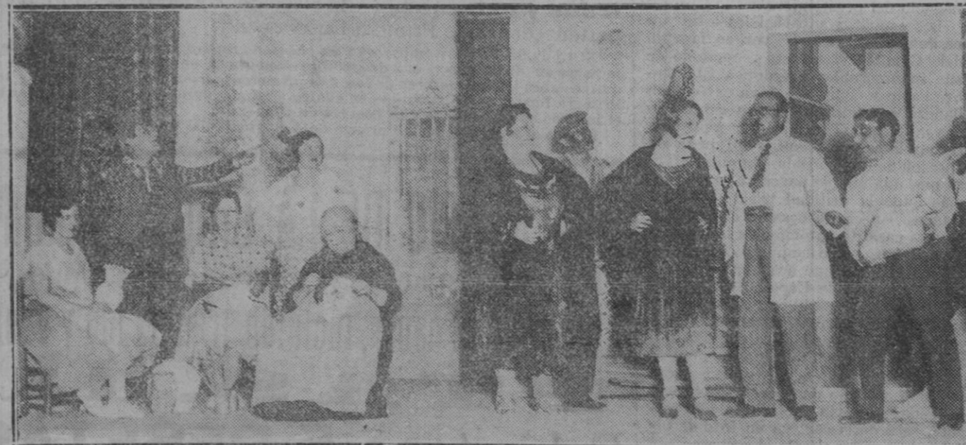
MADRID.—Comedia estrenada en el teatro Avenida, titulada "Triarnerías"

Pero el más fiel libro proveedor de conocimientos sobre esta materia es el libro de la vida, fuente de infinitas enseñanzas que no exigen otro esfuerzo que observación, asiduidad y paciencia para apropiarse el caudal de su riqueza científica en la propor-