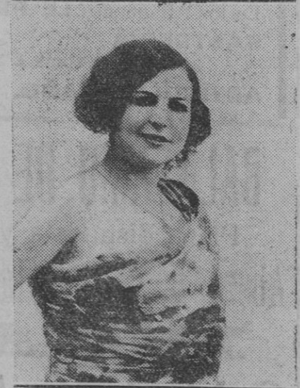
La notable tiple María Tellez que actúa con gran éxito en el teatro Chueca