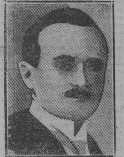
El Presidente de Parahyba Dr. Joao Pessoa que fué asesinado y con motivo de ello, ocurrieron graves desórdenes, y hubo un muerto y varias casas incendiadas