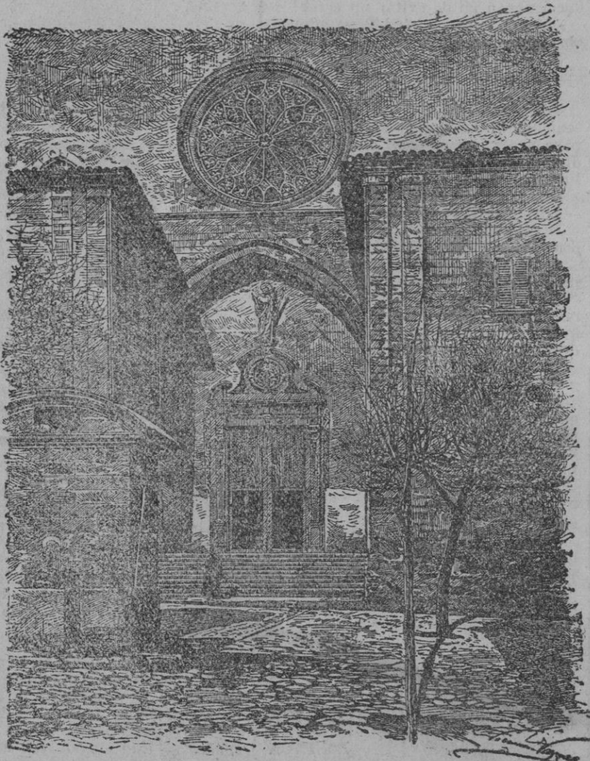
Aspecto que ofrecía la plaza de Santa Eulalia antes de ser reconvertida la fachada de la iglesia de este nombre

La competencia entre las dos enseñanzas no debe resolverse sosteniendo nuestro atrasado sistema de enseñanza, ni favoreciendo a unos u otros desde la ley. La indudable preferencia que hoy siente la sociedad por la enseñanza privada se debe contrarrestar de un modo más pedagógico, seleccionando el profesorado de los Institutos, dotándolos de laboratorios y material moderno de enseñanza, con aulas sanas y edificios confortables, con un razonable sistema de disciplina escolar. Mientras en todos y cada uno de estos detalles sea superior el colegio privado al Instituto Oficial es lógico que los padres de los escolares y los mismos estudiantes seguirán mostrando sus preferencias por la enseñanza privada a despecho de todas las trabas, inconvenientes y mayor desembolso.