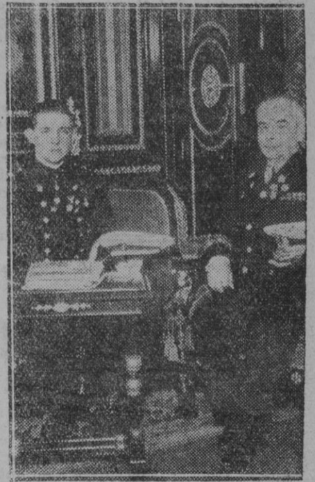
MADRID.—La primera visita oficial del Infante D. Juan con uniforme de la Armada, al Ministro de Marina