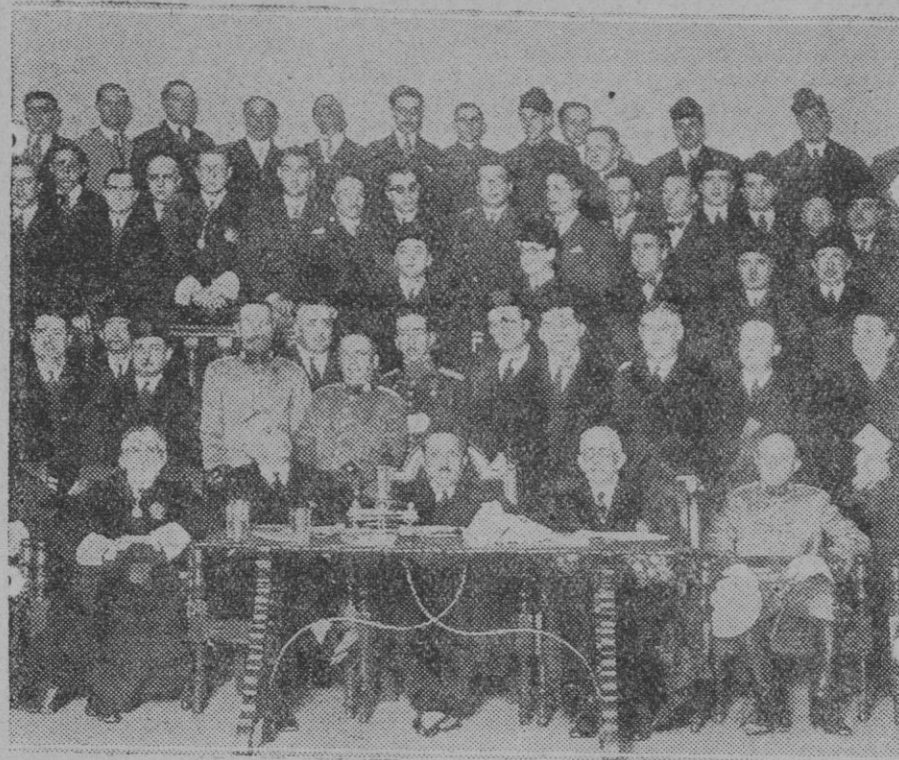
MADRID.—Concurrentes a la sesión de clausura de la Asamblea de Abogados

Los últimos partidos de fútbol jugados en esta ciudad fueron una demostración de la simpatía con que ha sido acogida la moda de los sombreros de paja de color. Las gradas de los campos ofrecían el aspecto de un prado lleno de flores de todos los colores, entre las notas brillantes de los trajes primaverales femeninos y los nuevos sombreros de paja.