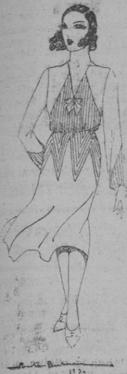
VESTIDO.—Monísimo vestido en talle de soie blanco con pequeñas nervuras verticales