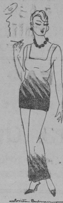
PIJAMA.—Elegantísimo pijama de tocador en crepé de China en tres colores, blanco, azul y negro