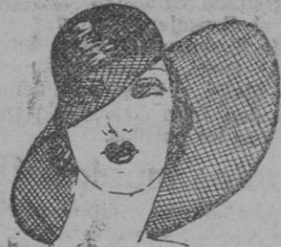
SOMBRERO.—Elegante sombrero interpretado el casco en seda azul y el ala del mismo color en malla de seda pura