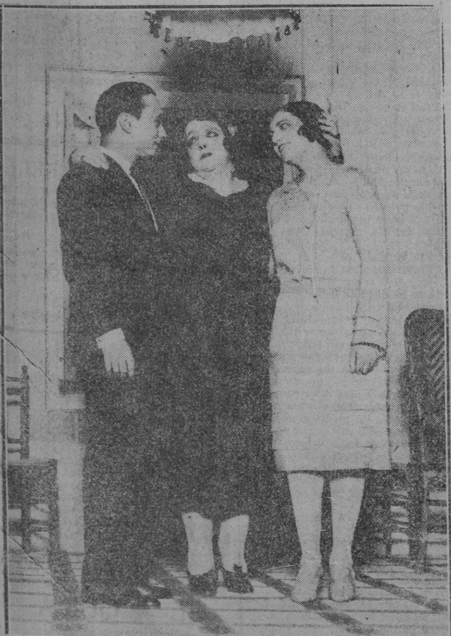
MADRID.—Una escena de la comedia de Eusebio Gorbea "Los amos de Curtidores", estrenada con gran éxito en el teatro de la Latina por la Compañía de Concha Olona