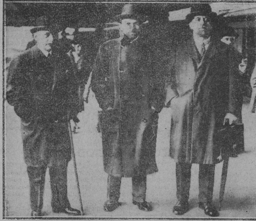
EXTRANJERO.—De izquierda a derecha.—Scialoja Grandi y Di Miuzza al salir de Londres de regreso a Roma, una vez terminada la Conferencia Naval

Como antes hemos dicho, es deber inexcusable de todos los pueblos conservar cuanto afecte a su historia, a sus hijos ilustres, o a los que por su relación con tales pueblos han contribuido en una o en otra forma, a formar su historia o a enaltecerlos.