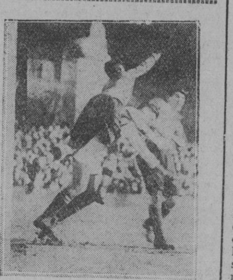
DEL PARTIDO REAL SOCIEDAD RACING-SANTANDERINO.—Uno de los siete goals marcados por los donostiarras.

M. GIBERT MIRRE (De "Las Noticias" de Barcelona).