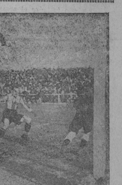
ESPAÑOL-REAL UNION.—Esmerly sujeta un tiro, a bocajarro de Tena