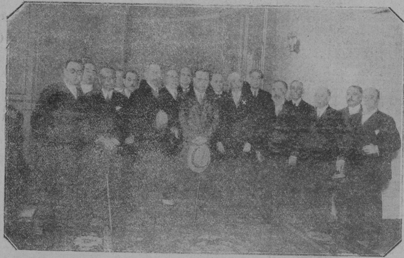
EL PRESIDENTE DE LA REPÚBLICA PORTUGUESA EN ESPAÑA.—Nuestro insigne huésped rodeado de las personalidades de la Unión Patriótica de Barcelona que le fueron a cumplimentar.

Digna de aplauso es la gestión llevada a cabo por el expresado Ayuntamiento, y con sumo placer hemos de felicitarle por ello al propio tiempo que destacamos su actuación para que sirva de ejemplo a quienes en buena lógica en lugar de recibirlo debieran haberlo dado.