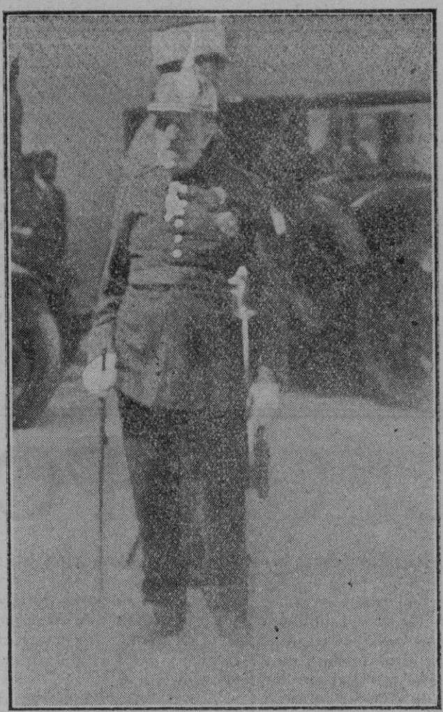
Nuestro ilustre paisano el Capitán General Excelentísimo Sr. D. Valeriano Weyler, que asistió a la recepción que tuvo lugar en el palacio de la Almudaina.

y es que si se ha impuesto en los dos días del juego alto es porque así lo ha querido el Barcelona. Y nos explicaremos.