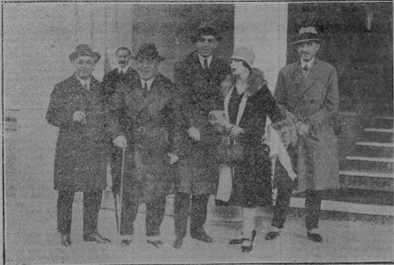
El Infante don Jaime acompañado de varios aristócratas cuando su último viaje a Málaga.