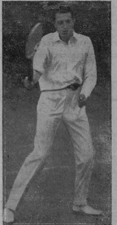
En tennis se muestra nuestro agosto visitante como una "raqueta" temible.