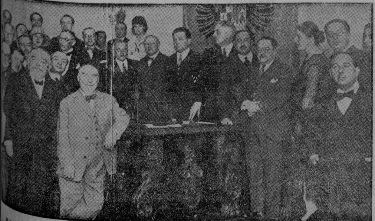
MADRID.—Con motivo del Congreso Internacional de Autores, la Comisión Mixta de Espectáculos, al final, invitó a los congresistas, a un vino de honor.

El presidente de la mencionada Sociedad ha desaparecido; y resulta que el exkaiser ha sido estafado en la cantidad de 600.000 marcos.