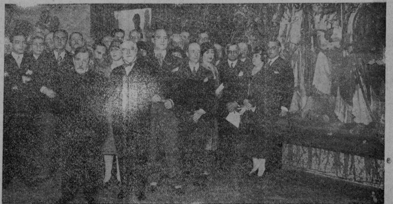
LA inauguración de la Exposición del notable pintor argentino señor Quirós con asistencia del Ministro de Instrucción Pública, el Embajador de la Argentina, el general Weyler y otras personalidades.