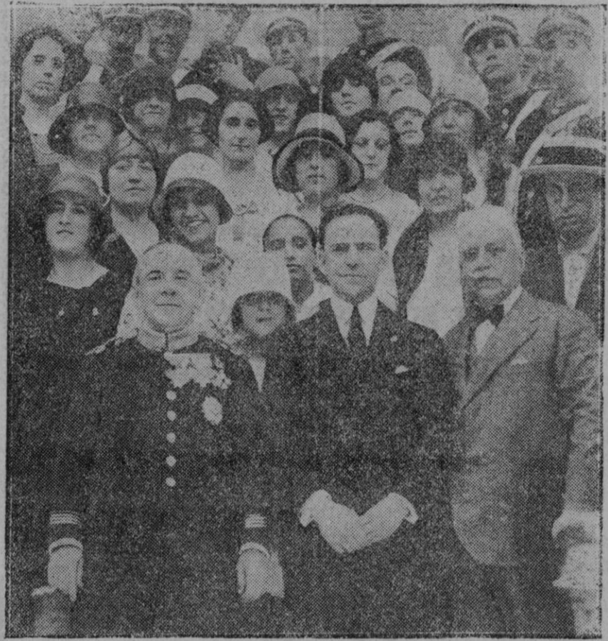
MADRID.—En conmemoración del XX aniversario de la fundación de la Banda Municipal de Madrid se celebró un concierto en el que cooperó la «Masa Coral» dirigida por el Maestro Villa y Benedicto.

Esto es lo que exige, con fuerte imperativo, el porvenir de Mallorca.