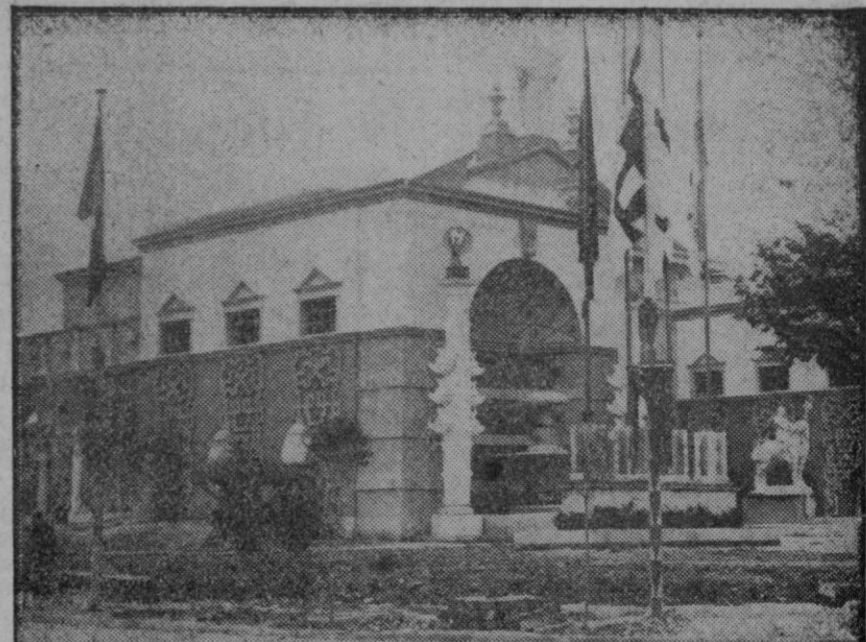
BARCELONA.—El magnífico pabellón de talia instalado en el recinto de la Exposición Intercontinental, que ha sido inaugurado con gran solemnidad, asistiendo Sus Majestades los Reyes, Infantes y el Presidente del Consejo.

La vida de Ramón Lull es una peregrinación constante. Peregrina por todas las tierras donde justa necesidad su verdad, y por todas las ideas en que efunde su amor. Pero va solo. No es hombre de comitiva. De vanguardia, sí, para guiar a los muchedumbres. Pide cruzadas que no logra, prescripciones de filosofías que no consigue. Sa bordón lo conduce siempre al peligro, porque el peligro enciende la llama de su cerebro. El maestro dondequiera que está, cuando habla, cuando escribe. Lo mismo lo es al ser interrumpido por Escoto, en la Universidad de París, donde llama la atención de los estudiantes, por sus arreos de peregrino, que al recoger en el Félic de las maravillas la ciencia de su tiempo. En la Historia de los sabios de Figuer hallaréis sus atiborados geniales. En el estudio de Adolfo de Cas-