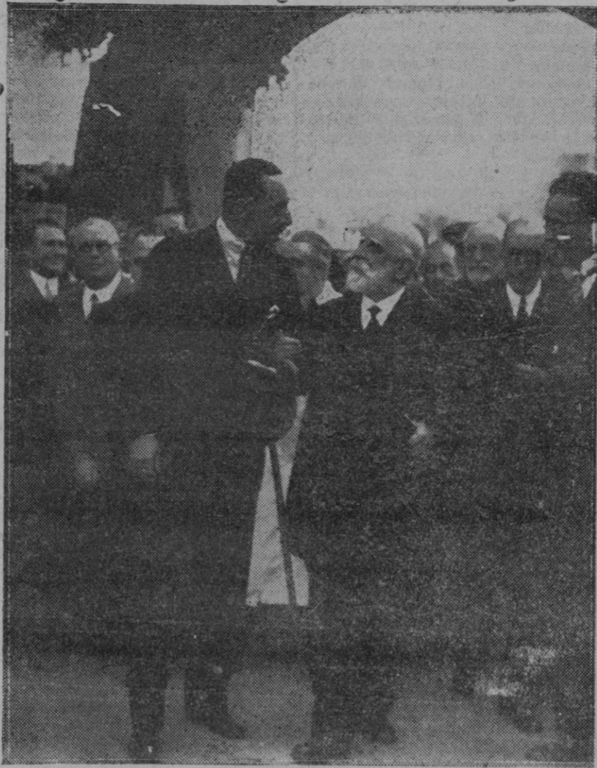
BARCELONA.—Su Majestad el Rey danle el brazo al ilustre bacteriólogo Doctor Ferrán, durante la visita al Instituto que lleva el apellido de éste.

Adquirido ya el edificio por el Ayuntamiento, no se justificaría que se mantuviera ya por mucho tiempo una interrupción en las obras de apertura del tramo de Gran Vía comprendido entre el expresado solar y el paseo del Borne, interrupción que sobre causar daño al buen aspecto de la ciudad, podría dar lugar a que Palma se quedara sin Casa de Correos.