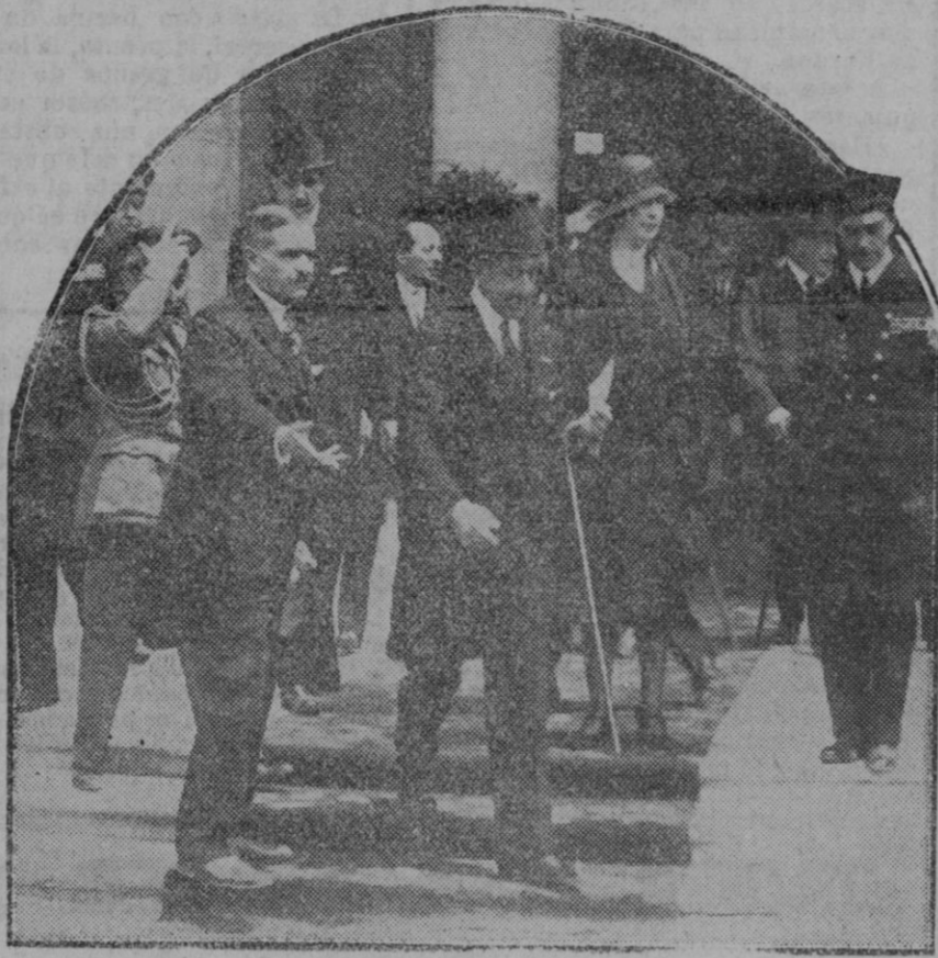
BARCELONA.—Su Majestad la Reina doña Victoria y las Infantas doña Beatriz y doña María Cristina saliendo de la inauguración de los pabellones de Italia y Austria instalados en la Exposición.

Siendo tiempo todavía para que tales obras puedan llevarse a cabo con aquella tan conveniente oportunidad, creemos oportuno insistir demandando una actividad que estimemos absolutamente precisa.