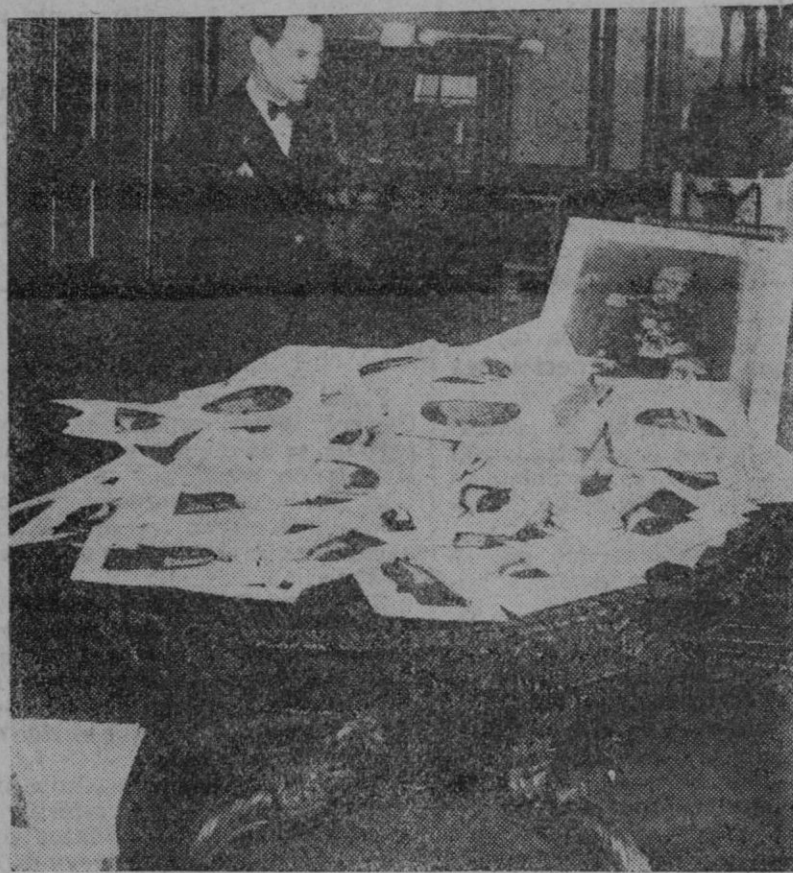
MADRID.—En el despacho del Presidente, en el Ministerio de la Guerra, se ve a Polo, el fiel ayudante del general Primo de Rivera, cuando se dispone a recoger centenas de cartuchos que en el día de la manifestación tuvo que dedicar a otras tantas personalidades españolas y extranjeras.

La música de Mozart causó sobre sus contemporáneos el mismo