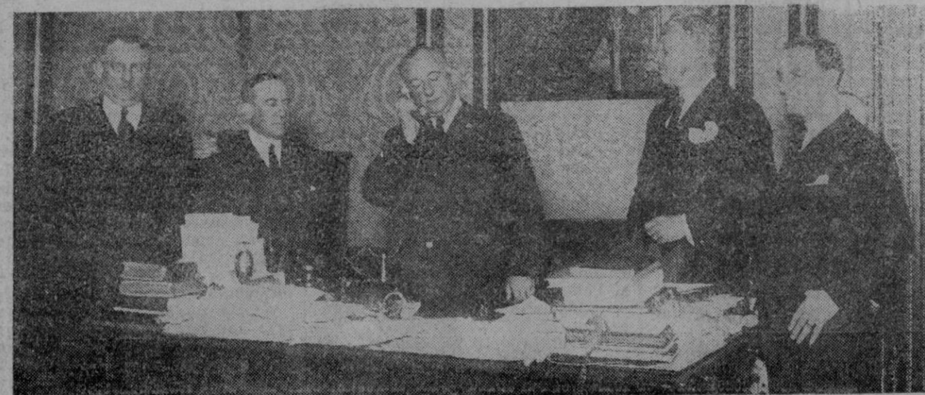
MADRID.—El Presidente del Consejo general Primo de Rivera acompañado del Ministro de Suecia y altas personalidades de la Compañía Telefónica, inaugurando la nueva línea de comunicación con Suecia.