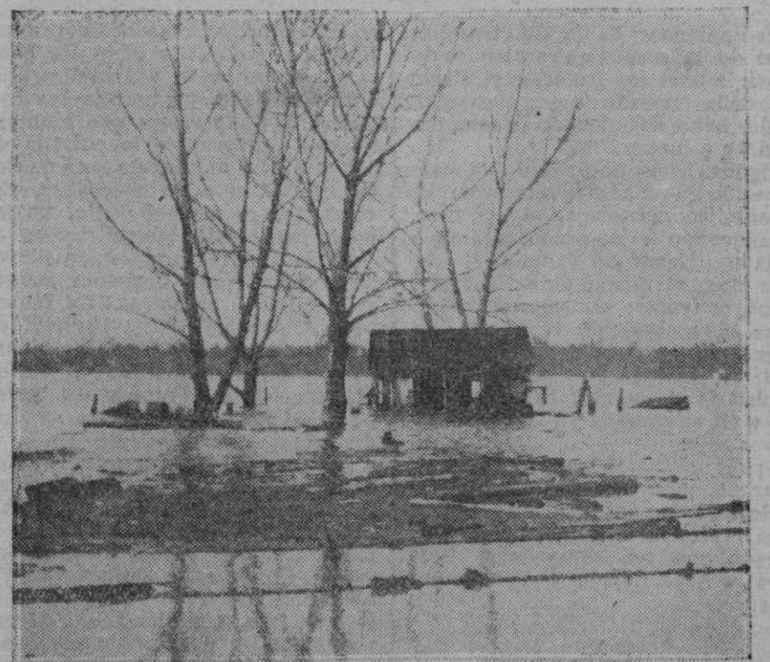
El río Mississippi que a consecuencia de las enormes lluvias pasadas se ha desbordado inundando las viviendas próximas en la parte de Quincy, en Illinois.

GUÍA DE BALEARES.—Pequeña guía de Mallorca con un mapa a un detallado plano de Palma, encuadrada, 2 pesetas. Librería de J. Tous.