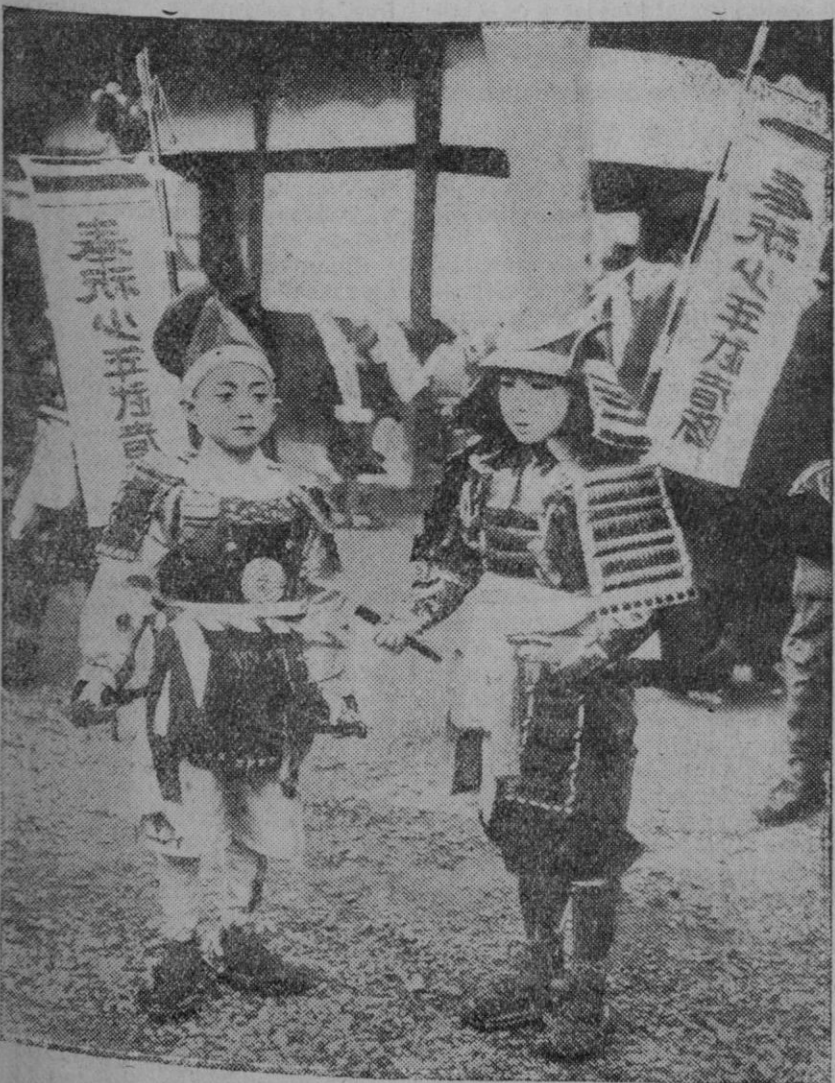
JAPÓN.—Durante los actos de la coronación del Emperador del Japón, Hirohito, se ha celebrado un desfile de trajes medioevales.—En esta fotografía se ve a dos niños vestidos de soldados de aquella época.