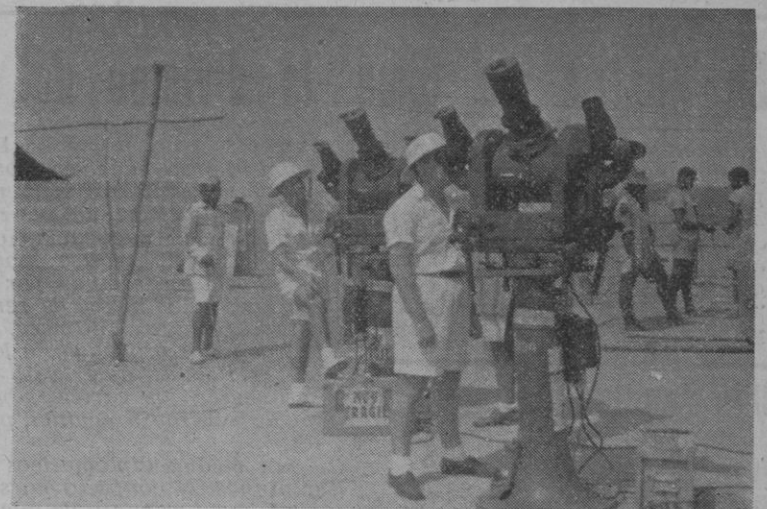
Batería de cineteodolitos para la observación del eclipse de sol del 25-2-52 en Kogo (Guinea Española).

Viena. — Por primera vez se ha publicado en Yugoslavia una noticia oficial sobre las medidas tomadas por la policía comunista contra el clero. El presidente de la Comisión de relaciones entre la Iglesia y el Estado ha comunicado que actualmente se encuentran en prisión ciento cincuenta y ocho sacerdotes, de los cuales ciento veinticuatro son católicos, treinta y dos de la Iglesia ortodoxa y dos protestantes.