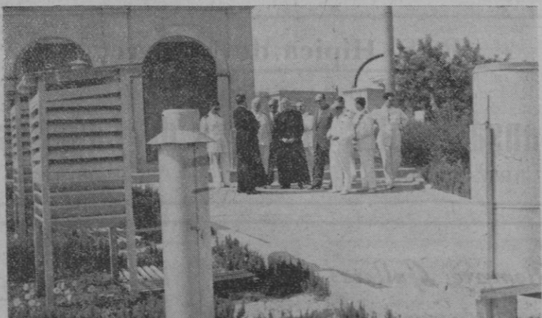
Instalación meteorológica al aire libre. (Visita del Almirante Cervera — entre los PP. Romaña y Galdón)

Sea pues, bienvenido a nuestra bella Isla el Director del Observatorio del Ebro y, como tal, reciba desde estas columnas el testimonio de afecto y admiración de estos entusiastas aficionados a la ciencia de los cielos y que, el próximo domingo, estarán dispuestos a escuchar de labios del maestro la bella palabra dictada por Uránia.