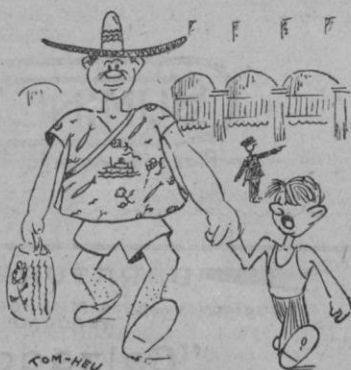
Papá, cuando sea mayor podré llevar pantalones cortos como tú?

No olvides estas palabras cuando suene para tí la hora del DOMUND.