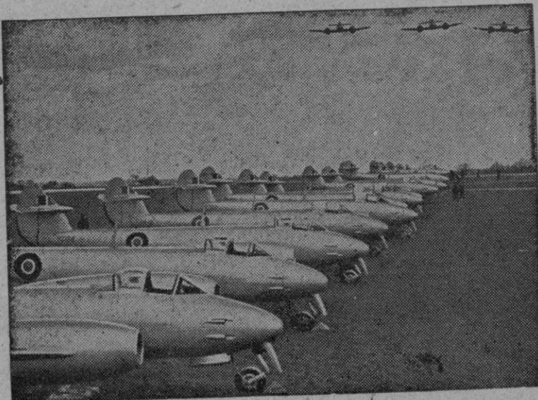
Los cazas más rápidos del mundo

tro de la Guerra» del partido, mantine el control sobre sus guerrilleros. No se discute entre los jerarcas comunistas sobre la sustitución de Togliatti mientras dure su hospitalización. Todo parece previsto. Secchia ha asumido automáticamente el control general y el Comité Central está en sesión casi permanente para proyectar las próximas acciones. En el Parlamento actúan los senadores comunistas Secchia, Umberto Ferracini y Mauro Sceccimero y los diputados Longo y Giancarlo Pajetta.