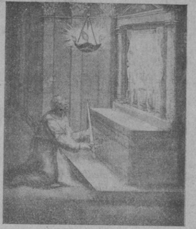
S. Ignacio de Loyola hace entrega de la Espada

Comedieta americana al uso del día. Todo cuanto sucede tiene por origen una furibunda rivalidad entre un hom- bre de negocios, acostumbrado a im- poner su criterio, y una banda de mú- sica instalada en un inmueble vecino. La cinta tiene un todo desenfadado y alegre, y sería inofensiva si se pres- cindiera de alguna rumba y alguna otra expresión de forma.