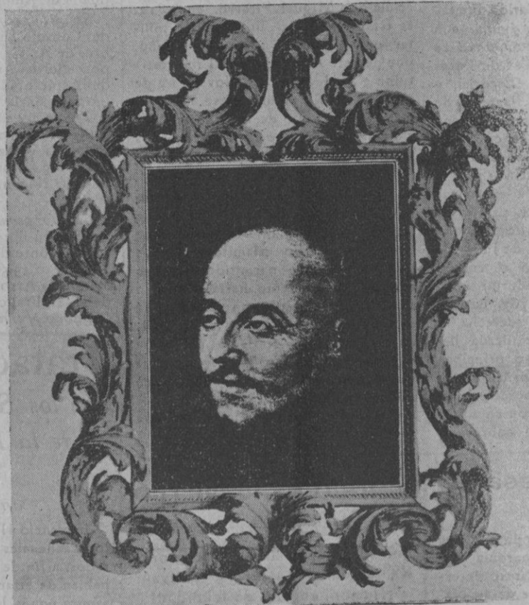
VERDADERO RETRATO DE SAN IGNACIO DE LOYOLA

Cuadro de Sánchez Coello, que se venera en Madrid en la Casa Profesa de la Compañía de Jesús