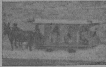
poema ochocentista, que hoy toma realidad en esos días otoñales...