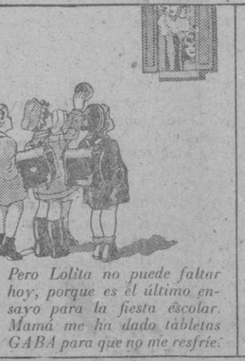
Pero Lolita no puede faltar hoy, porque es el último ensayo para la fiesta escolar. Mamá me ha dado tabletas GABA para que no me resfríe.