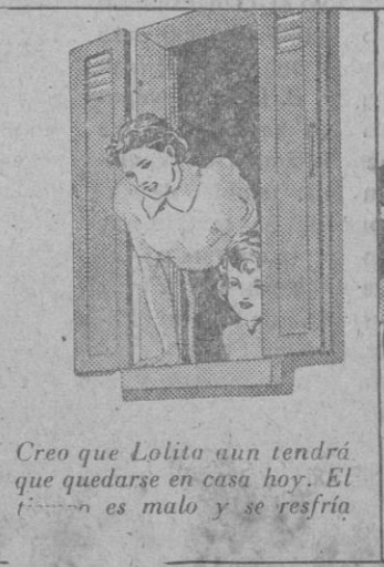
Creo que Lolita aun tendrá que quedarse en casa hoy. El tiempo es malo y se resfría