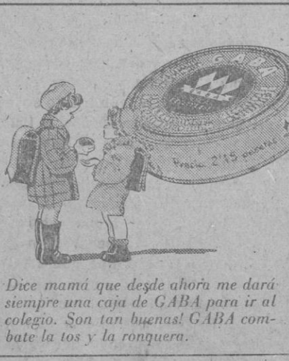
Dice mamá que desde ahora me dará siempre una caja de GABA para ir al colegio. Son tan buenas! GABA combate la tos y la ronquera.

DE VENTA TODAS LAS FARMACIAS IMP. POLITÉCNICA PALMA