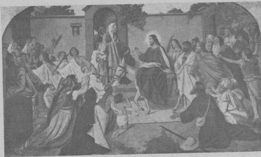
Entrada triunfal de Jesús en Jerusalén — Deger

Estos valores de la Semana Santa española, lo religioso, lo tradicional, lo artístico, lo popular, desglosados en un sincero esfuerzo de percepción de matices, nos dan desarticulado algo que únicamente puede tener su pleno significado en una indiscrepible y maravillosa colaboración. Estas íntimas compenetraciones, fuente de emociones intransmisibles, pero plenamente sen-