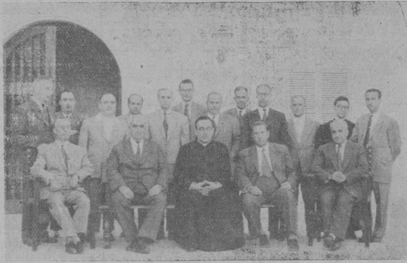
Grupo de sol'erenes que han practicado recientemente los Ejercicios en el Centro de Formación Social

Magníficamente situada en la barriada de San Agustín (Palma) álzase, entre pinos, el Centro de Formación Social de la Sagrada Familia. Obra admirable, digna de todo elogio y ponderación, llena de actualidad y eficacia, llamada a llenar de savia y vigor la vida religiosa de la isla, y que no aspira a otra cosa, con sus tandas de Ejercicios y Cursillos especializados y adecuados a to-