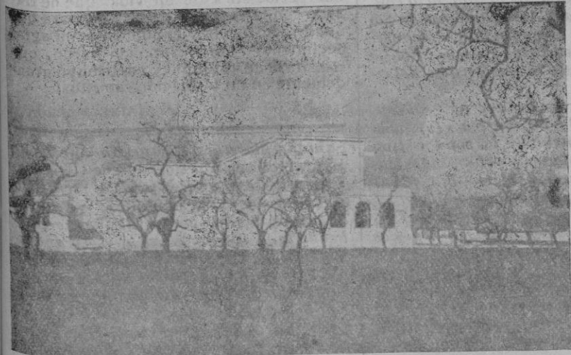
Edificio de la parte Norte destinado a aulas

También nuestro venerado obispo le vantó su voz pidiendo un nuevo seminario y Mallorca se ha puesto en pie. Secundando los vivos deseos del Sr. Obispo Mallorca está empeñada en llevar adelante tan colosal empresa. Por el «Boletín Oficial del Obispado» y su suplemento «El Nuevo Seminario», por la prensa diaria hemos podido enterarnos del entusiasmo que se ha despertado en todos los pueblos de la isla en favor de obra tan extraordinaria y de tanta trascendencia en el porvenir espiritual de la diócesis. Índice claro de tal entusiasmo son cuantiosas las limosnas depositadas en las manos del prelado. Solo para