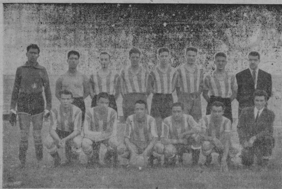
U. D. ATLÉTICO DE SÓLLER

Máxima, 760 mm. día 29 a las 22 h. Mínima, 753 mm. día 31 a las 20 h. Evaporación: 122 mm.