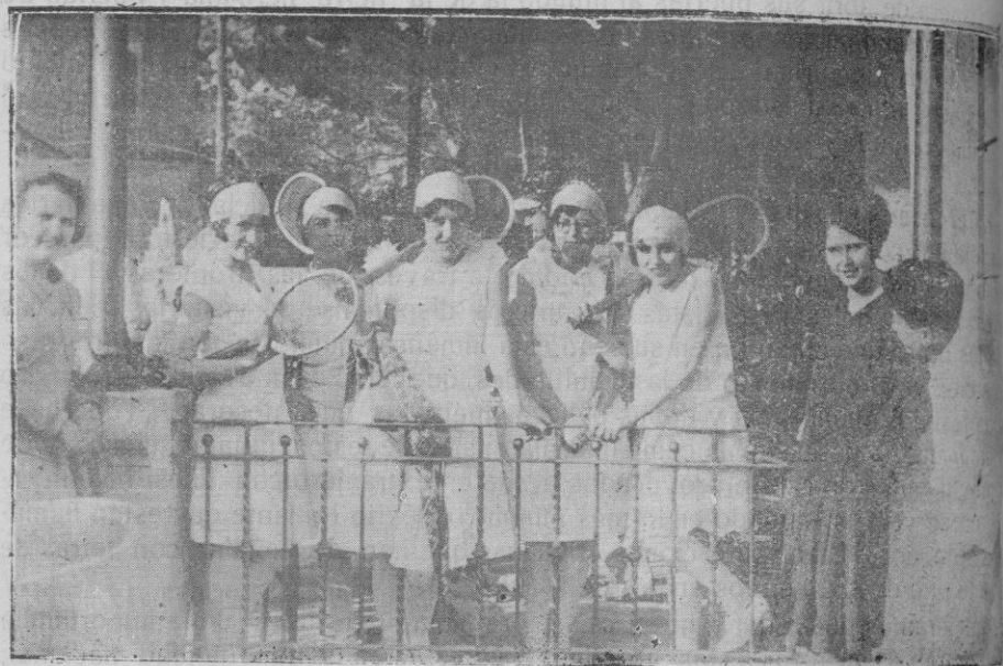
Grupo de señoritas que figuraban en la carroza «Alegoría del Tennis».

los tres días que duró nuestra fiesta religioso-popular.