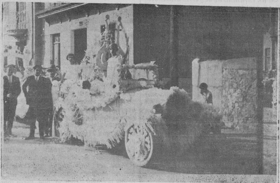
Una de las carrozas que tomaron parte en el «Coso Blanco».

El lunes, a las nueve y media, comenzó el programa de los festejos, celebró en la Parroquia el funeral en