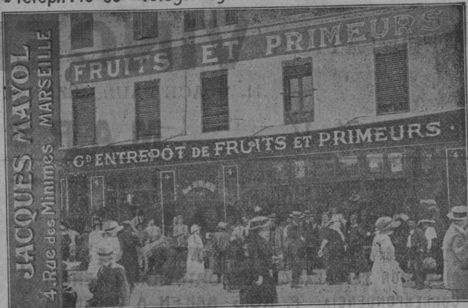
Bien préciser le N° 4

Téléph: 16-35 Télég: Mayol minimes 4 Marseille