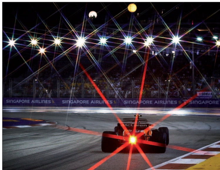
Alonso intentará darse una pequeña alegría en Singapur.

El gran rendimiento de Hamilton le ha permitido neutralizar la teórica superioridad técnica en las últimas carreras de Ferrari, que no ha sabido rentabilizar su ventaja. Ya se han encendido las primeras alarmas en la 'Scuderia', que lleva desde 2007 sin saborear un título, una sequía muy extensa que amenaza con seguir.