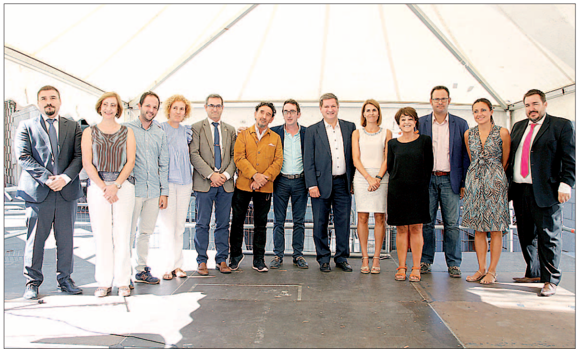
Las autoridades posaron en la tradicional foto de familia en el momento de inauguración de la sexta edición de la feria.

Desde su apertura, la carpa de Tierra de Sabor se llena de gente para probar y comprar los productos expuestos, todos ellos naturales de Castilla y León, comenzando con el jamón como protagonista y hasta cerveza artesanal,