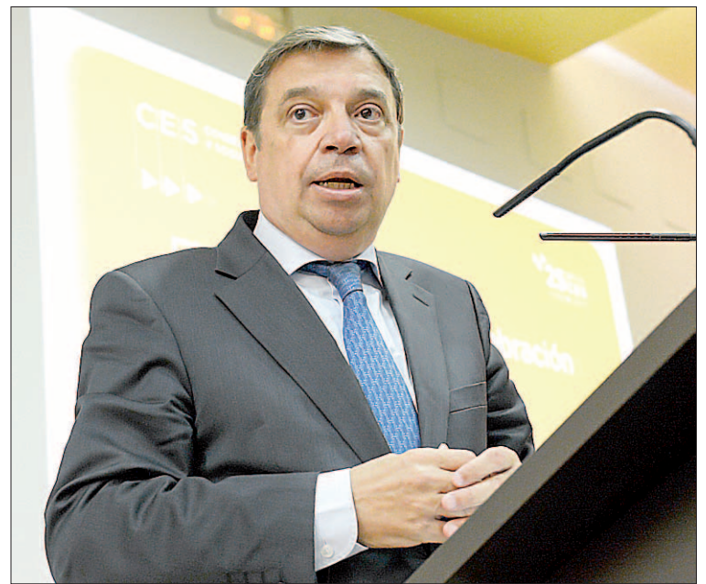
El ministro de Agricultura, Pesca y Alimentación, Luis Planas.

También indicó que la lucha contra el despoblamiento del medio rural en España se ha incorporado a la agenda política del Gobierno, que considera este problema como una cuestión de Estado. Según aclaró, es necesario abordar este desafío de manera global, integral y transversal con el conjunto de políticas sectoriales e instrumentos disponibles. Prueba de ello son las medidas que ha presentado la comisionada del Gobierno para el reto demográfico, como la futura estrategia para el reto demográfico.