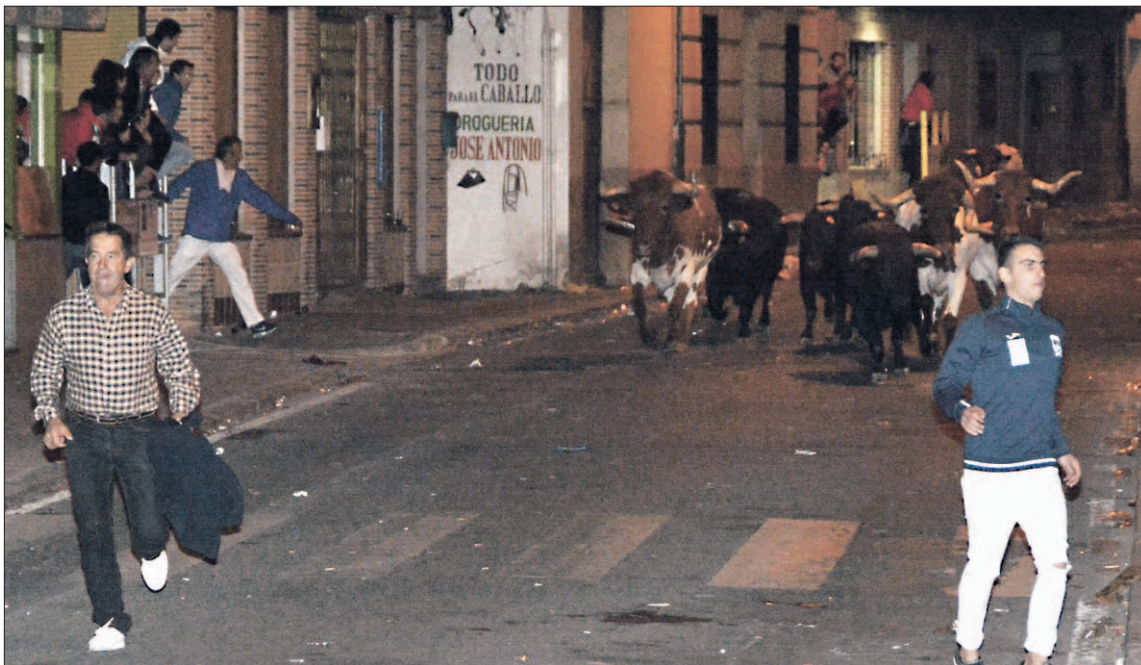
Celebración número 49 del encierro nocturno, en la pasada edición de las fiestas patronales de La Nava.