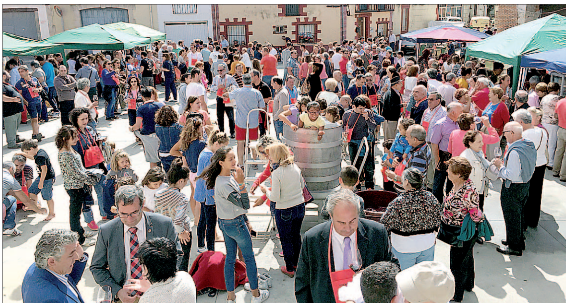
Se espera que un año más se cumplan las previsiones y se alcancen los 2.000 asistentes a la fiesta. / EL ADELANTADO

La feria contará con numerosos atractivos como la posibilidad de visitar las seis bodegas que in-