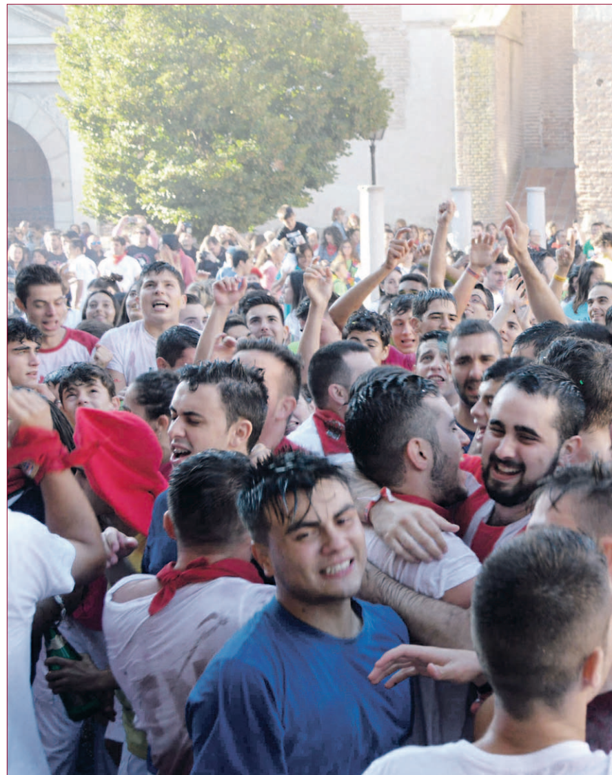
Alegría y emoción desmedidas de los vecinos de Nava de la Asunción tras el chupinazo que inaugura las fiestas.