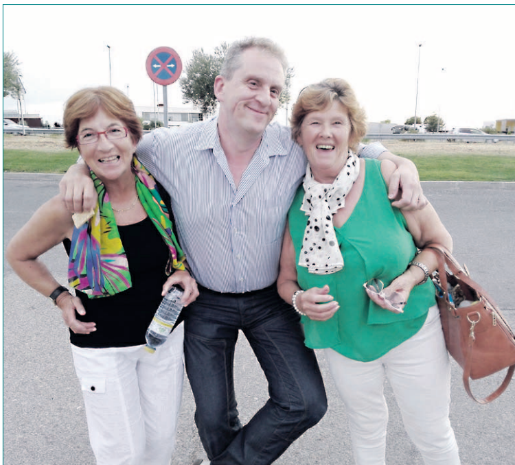
¡ENHORABUENA! A este grupo de amigos de Cantimpalos, que después de la jornada festiva de la Fiestas Patronales, disfrutaron de unas merecidas vacaciones, y como lugar de descanso eligieron las bellas playas de Benidorm y por las noches el bullicioso Paseo Marítimo y visita obligada al Mirador./ LOURDES MATARRANZ GÓMEZ

Los interesados en publicar en esta sección sus fotografías y textos pueden enviarlos, con 3 días de anticipación como mínimo, por correo, junto con el teléfono y los datos completos a c/ Morillo, 7. 40.002. Segovia, o al correo electrónico: redaccion@eladelantado.com . Las copias fotográficas no se devolverán.