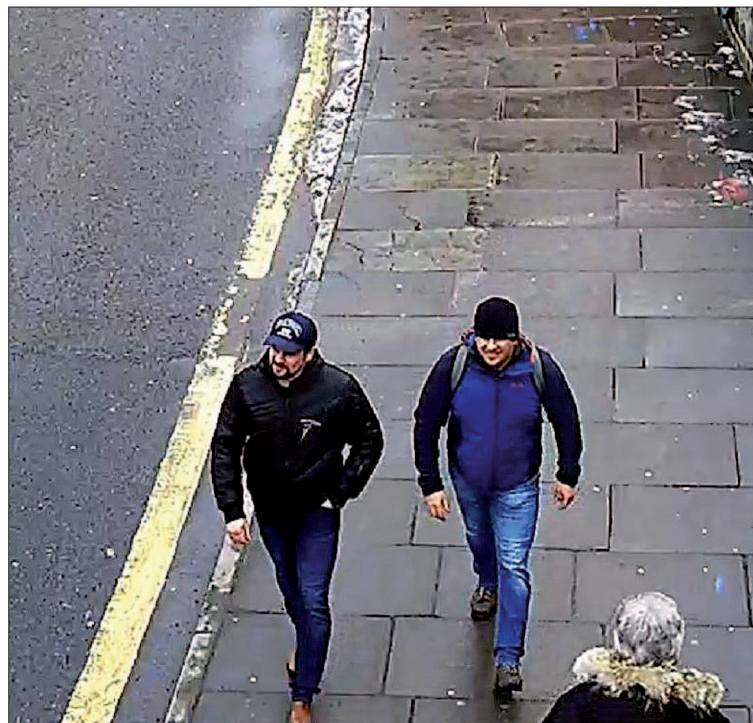
Las cámaras de Salisbury graban a los dos sospechosos en una estación.

Así, explicaron que no estaban allí por negocios, sino por turismo. La primera vez que fueron a Salisbury fue el 3 de marzo, pero dado que “la ciudad estaba llena de nieve”, volvieron a Londres. Al día siguiente el tiempo mejoró y viajaron de nuevo a Salisbury, pero la lluvia supuestamente les llevó a regresar de forma apresurada a la capital británica tras visitar la catedral.