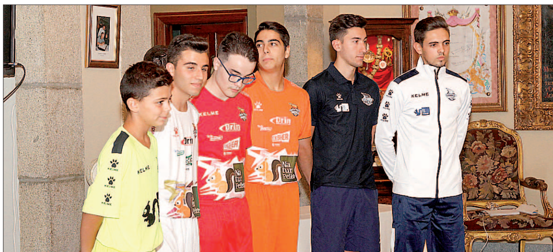
Jugadores de la cantera del Naturpellet Segovia posan con el nuevo vestuario para esta temporada.

Uno a uno fueron tomando protagonismo y saliendo a escena ante la atenta mirada del público. De esta manera, la presentación fue dando cabida a los porteros Alberto