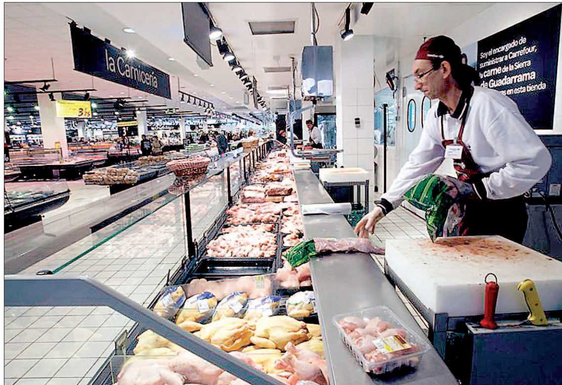
El indicador español está lejos del resto de países de la Unión Europea, como Alemania, donde alcanza el 48,3%.

Aunque la herramienta de seguimiento de precios de Eurostat de cómo se transmiten de los productores a los consumidores maneja cálculos basados en da-