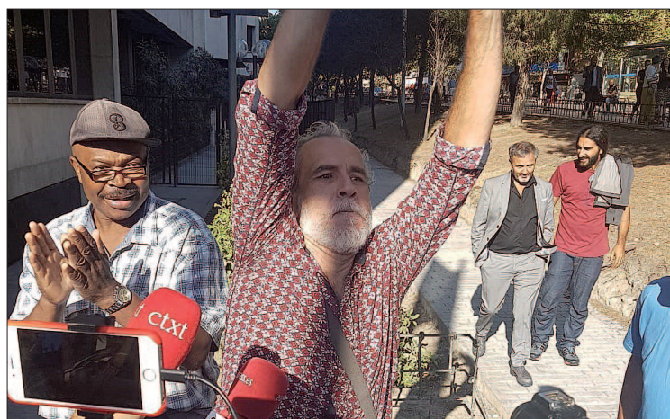
El actor, Willy Toledo, ayer a la salida de los juzgados.

“No he acudido a las citaciones judiciales no porque tenga ganas de pasarme ocho meses con todo esto a mi espalda sino, primeramente porque me parece que no he cometido ningún delito y porque me parece absolutamente tercermundista que en es-