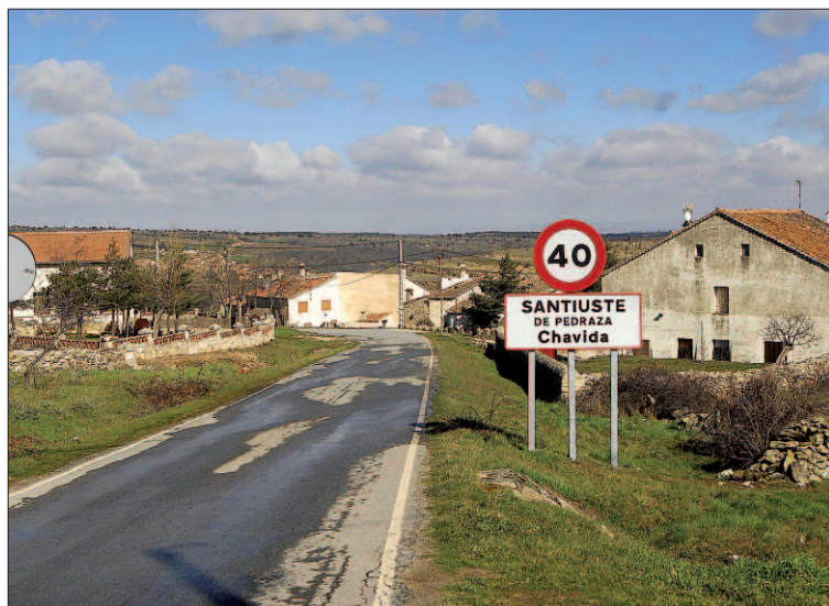
El barrio de Chavida, en Santiuste de Pedraza será escenario de los Paseos de Luna Llena.

Más información e inscripciones en fundacioncajaruraldesegovia.es