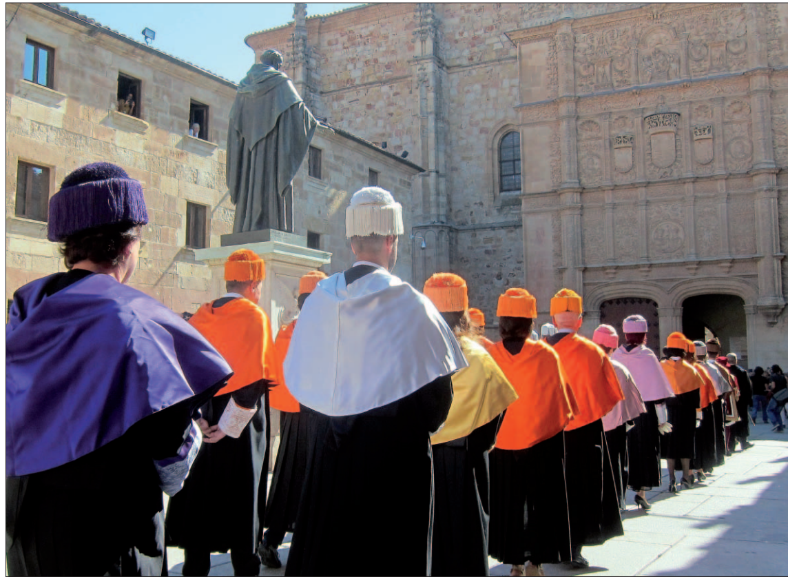
Apertura del curso 800 de la Universidad de Salamanca (USAL).

Sobre la aplicación, ha recordado que 2019 es año electoral, además de las dudas sobre la elaboración de un nuevo presupuesto, una dificultad que “sin duda” será solventada para que sea real