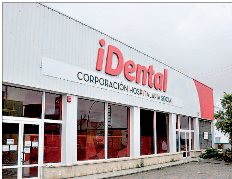
Fachada de la sede de iDental en Segovia.