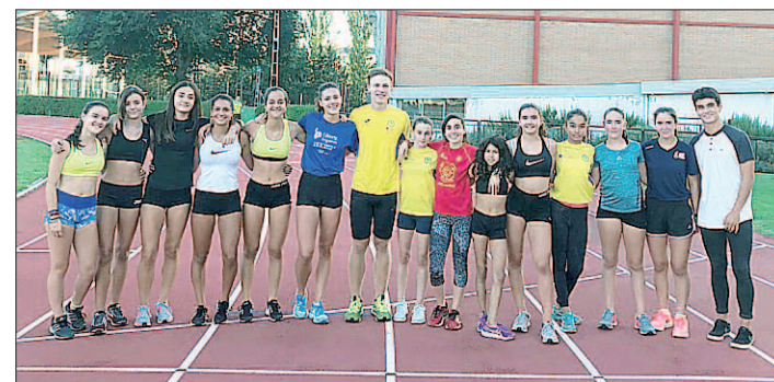
Algunos atletas del Sporting Segovia en las pistas Antonio Prieto.

La actividad atlética dirigida al grupo de adultos o veteranos se orienta principalmente hacia la mejora de la condición física, pero también incluye la preparación de carreras populares y pedestres u otras pruebas atléticas de veteranos, para los que deseen participar en este tipo de competiciones u otros eventos deportivos relacionados con el running y el atletismo en general. Para contactar con el club atletismosporting-segovia@gmail.com o 609 985 887, 646 271 124 y 638 701 203.