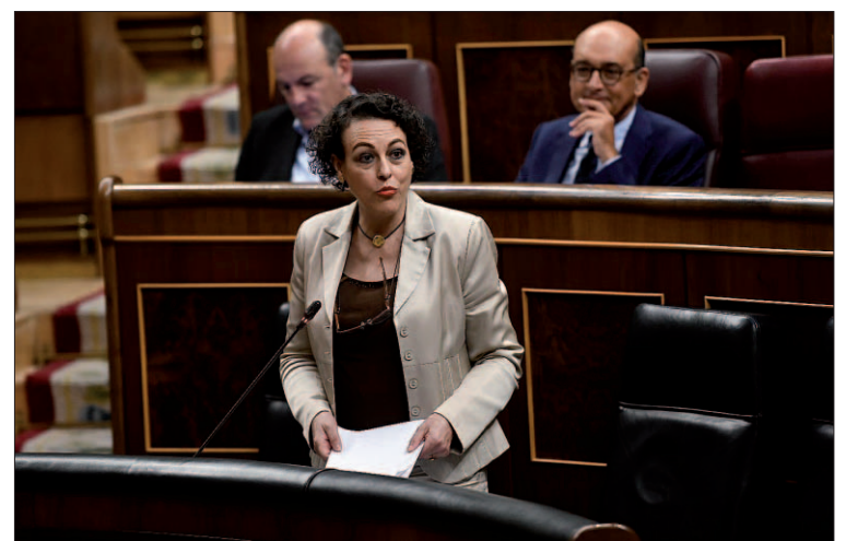
La ministra de Trabajo, Migraciones y Seguridad Social, Magdalena Valerio.

En mitad de este rifirrafe entre bancadas, Valerio trasladó a la diputada que el PP "ha digerido fatal salir del Gobierno" y le recordó que "su partido salió del Gobierno porque ha sido una máquina de generar corrupción". "Le recomiendo que a la hora de exigir res-