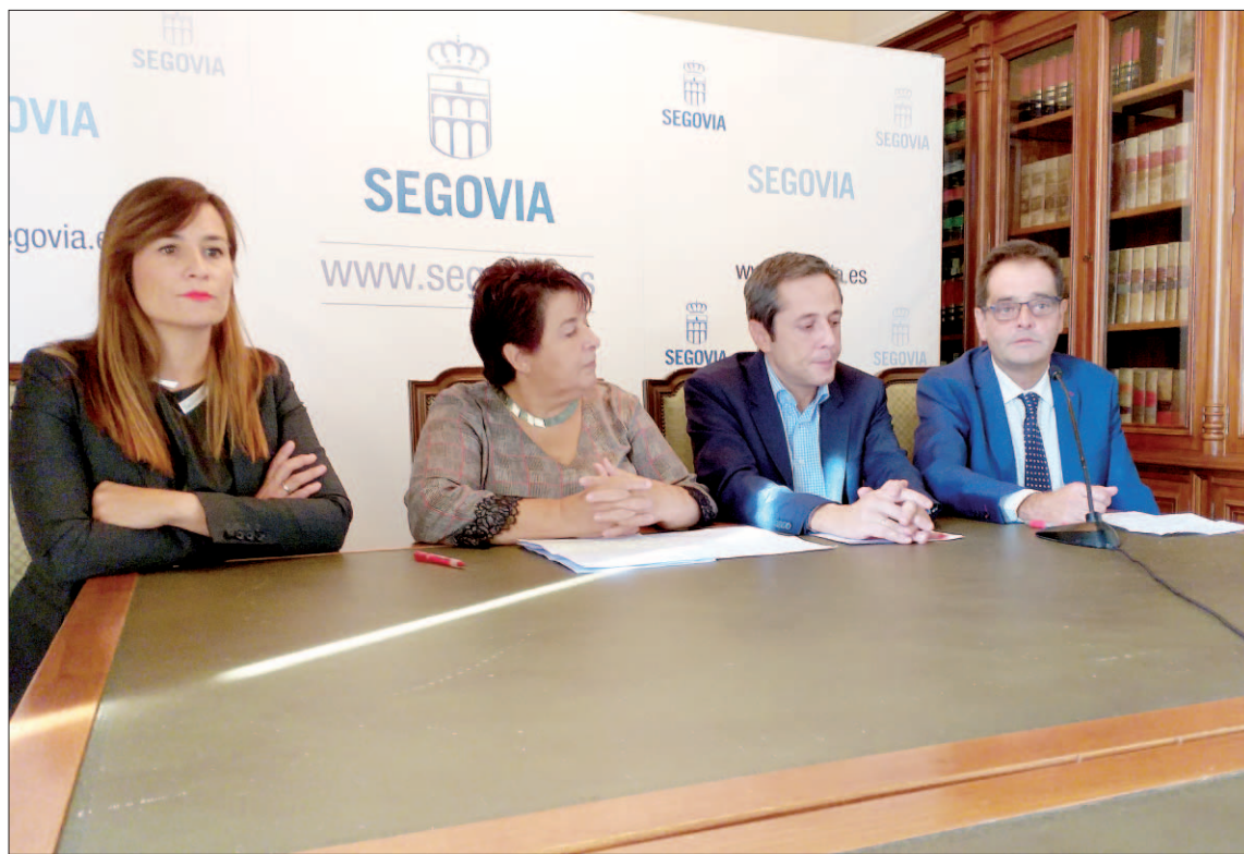
Los responsables municipales y de la Fundación Tecnalia, en la conferencia de prensa.

es la materialización de la apuesta del Gobierno municipal por una ciudad que avance hacia un modelo de desarrollo "sostenible, inteligente" y capaz de ofrecer oportunidades laborales", y contará con la participación de la ciudadanía a través de los consejos sectoriales de Desarrollo y Participación Ciudadana, donde el documento de trabajo será presentado y debatido.