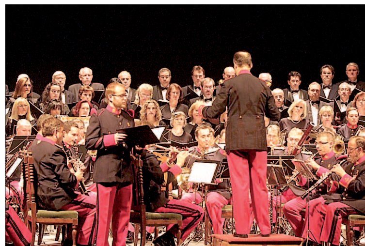
La Unidad de Música del Regimiento Inmemorial del Rey nffl o los conciertos de