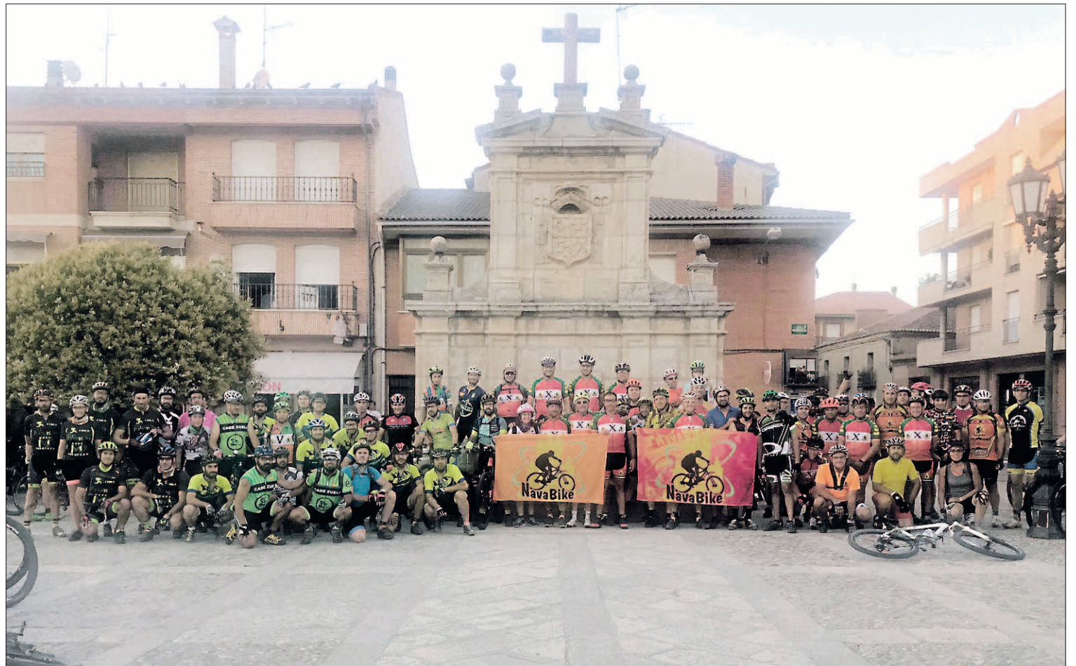
Los miembros del Club Deportivo Navabike posan para la foto grupal en la Plaza del Caño del Obispo, en el municipio de Nava de la Asunción.

—¿Puede adelantarnos algún detalle de lo que vamos a tratar el pregón?