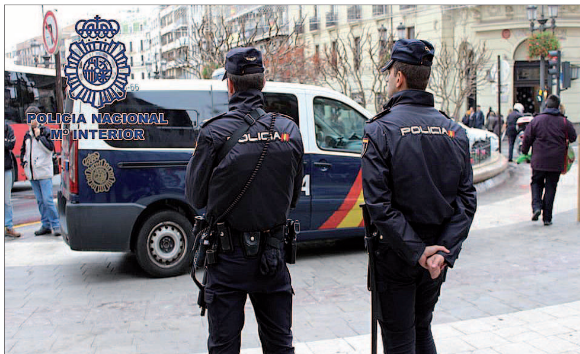
La Policía Nacional de Santiago de Compostela detuvo a la madre del bebé que se iba a dar en adopción.

Fue así como, según el comunicado de la Policía, una pareja habría contactado con ella para adoptar el bebé y “la convencieron para que se fuese a vivir con ellos hasta el momento del parto”.