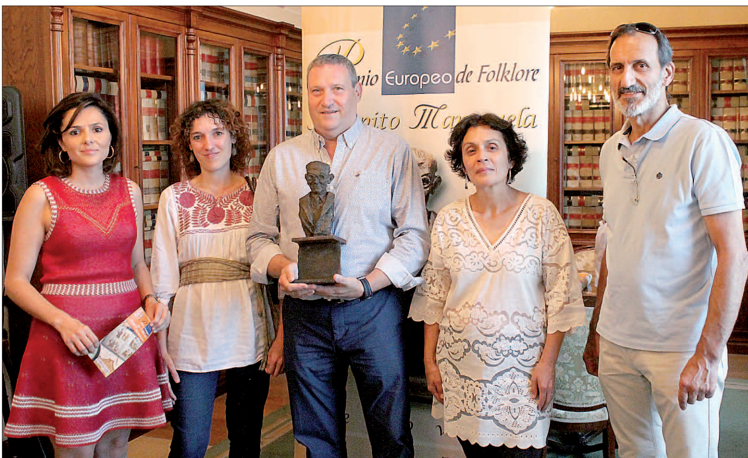
Los representantes institucionales y de la Ronda Segoviana posan con la estatuilla de Agapito Marazuela que representa el premio. / M.G.