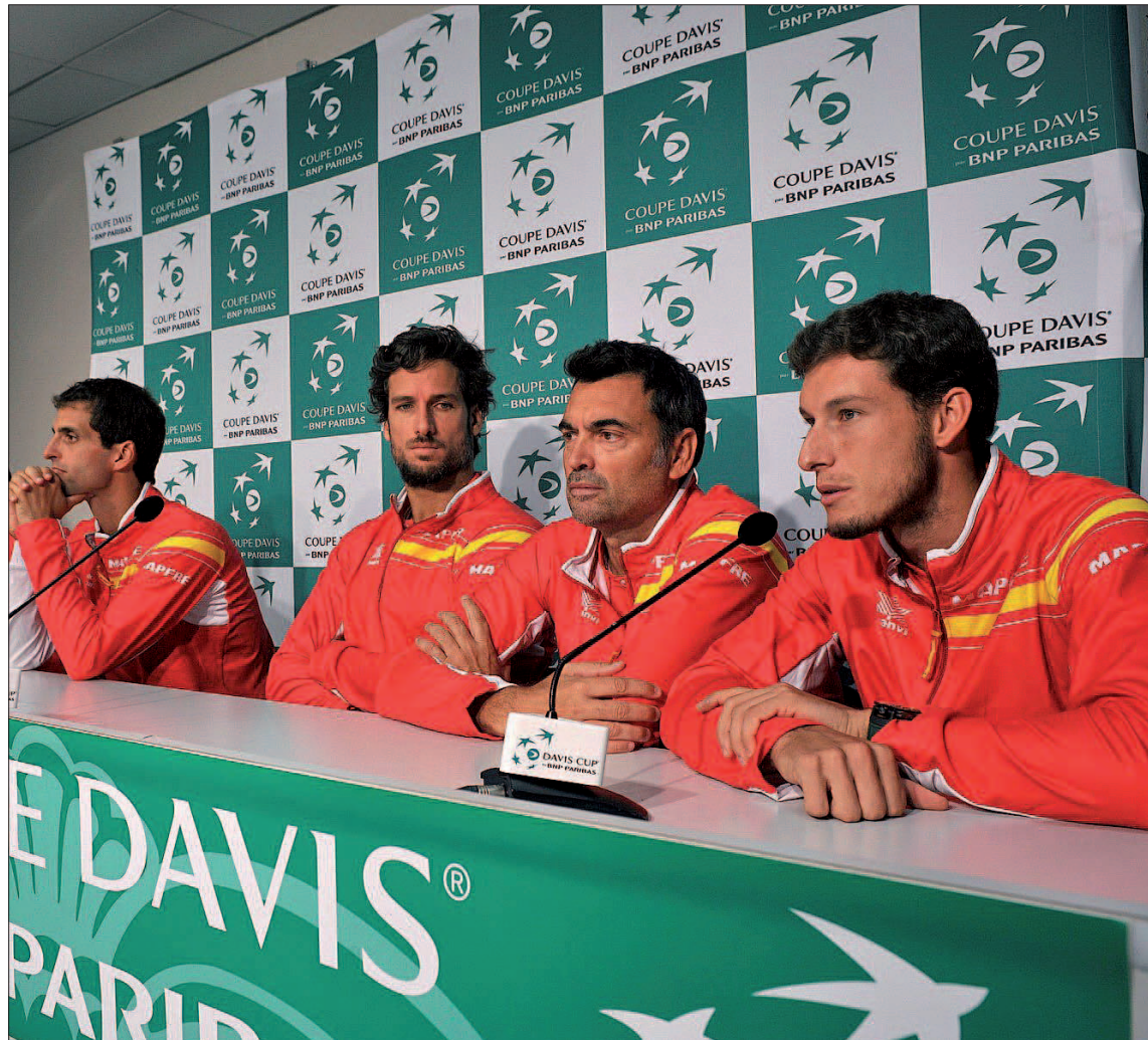
El equipo español de la Copa Davis ofrece una rueda de prensa en Francia ante los medios de comunicación.

Sin embargo, su rodilla volvió a cruzarse en sus deseos, justo a una semana antes de la eliminatoria ante los de Yannick Noah. El número uno del mundo se retiró en las semifinales del US Open y posteriormente confirmó los peores presagios al decir no también a su