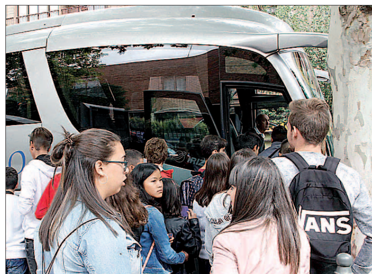
Autobús escolar recogiendo a alumnos del IES Andrés Laguna.

primer día lectivo o desde el día siguiente al de la formalización del contrato si éste fuera posterior, y finalizan el 31 de agosto de 2019 y 31 de agosto de 2020, respectivamente.