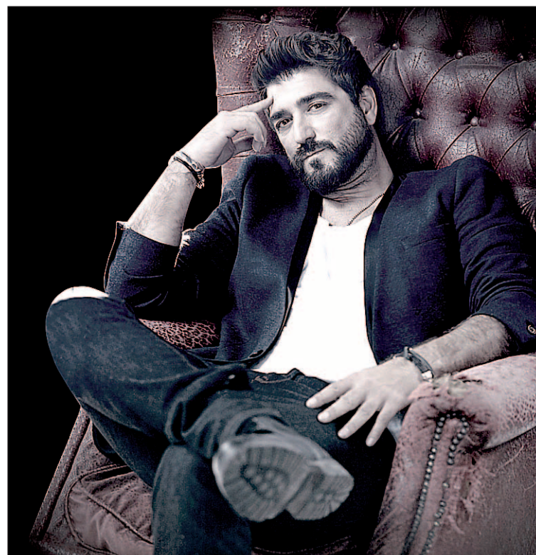
Antonio Orozco se cita con sus seguidores en el Juan Bravo el 11 de octubre.