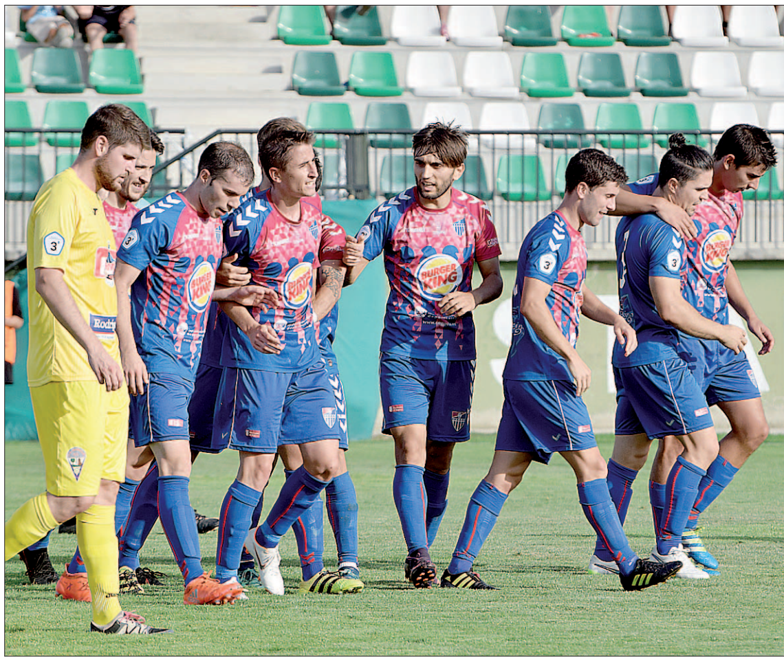
Los jugadores de la Segoviana celebran un gol en el partido frente a La Bañeza disputado en La Albuera.