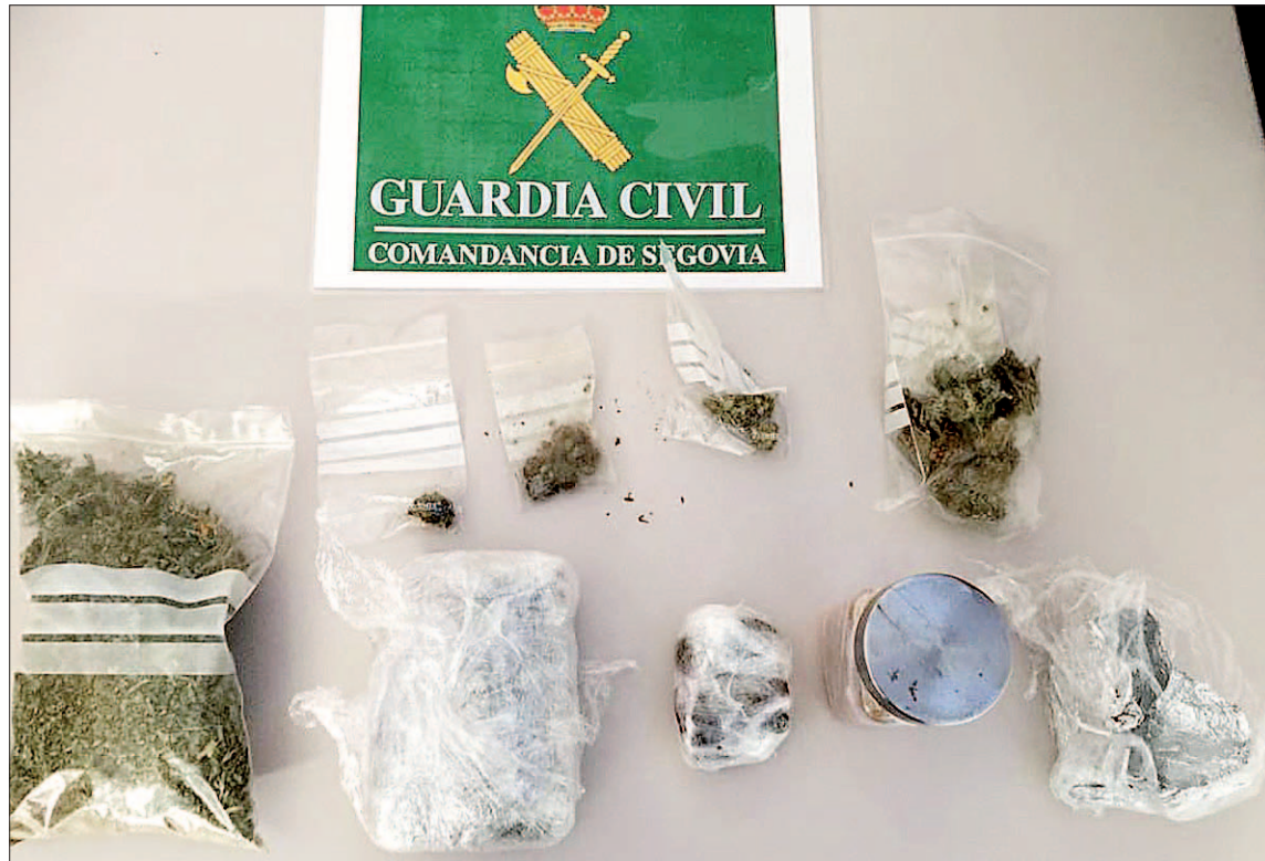
La droga descubierta en un control en Fresno de la Fuente iba guardada en bolsas de plástico y botes de cristal.

Fueron intervenidos un total de 158 gramos de marihuana y 87 de hachís, siendo significativo que parte de la marihuana aprehendi-