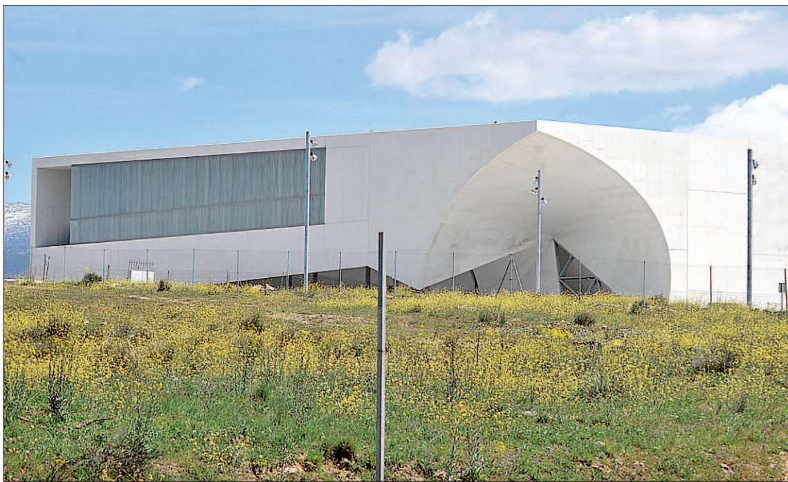
El edificio del CAT, aún pendiente de su conclusión, albergará el proyecto de innovación tecnológica.