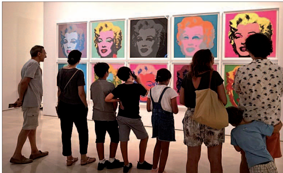
Visitantes a la exposición de Andy Warhol en el Museo Picasso de Málaga.

En la calle Alcazabilla se llevará a cabo ‘Papel pintado’, una gigante obra colectiva de dos metros de ancho por siete metros de largo que los participantes del evento podrán ir completando estampando algunos de los representativos diseños pop que Andy Warhol creó.