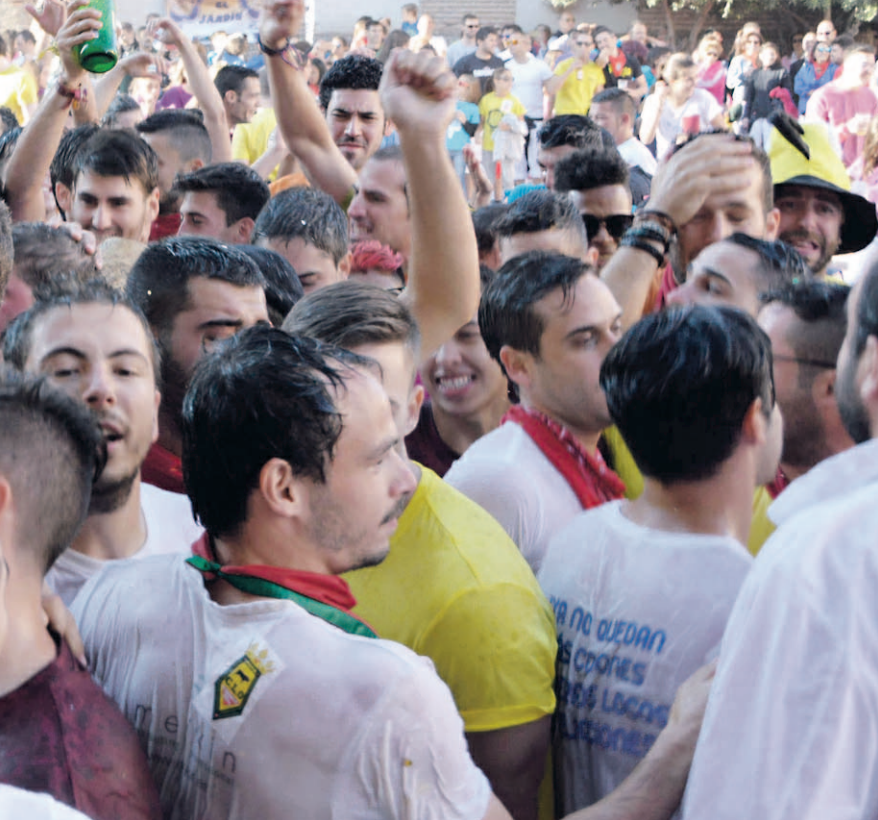
Figura oficialmente las fiestas de la localidad.

cierto de bailables que va a ofrecer la Banda de Música de Nava tras la misa de la mañana.