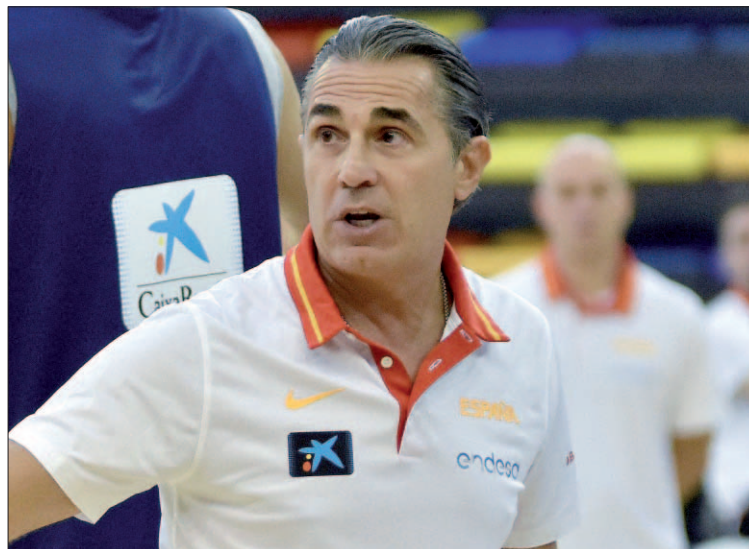
El seleccionador nacional, Sergio Scariolo, durante un entrenamiento.

Tras emplear a 21 jugadores y con más debutantes este viernes en la capital ucraniana, Scariolo reconoció que “en las ‘ventanas’ todo cambia según los jugadores que tengas en plantilla”. “Nosotros afrontamos esta competición des-