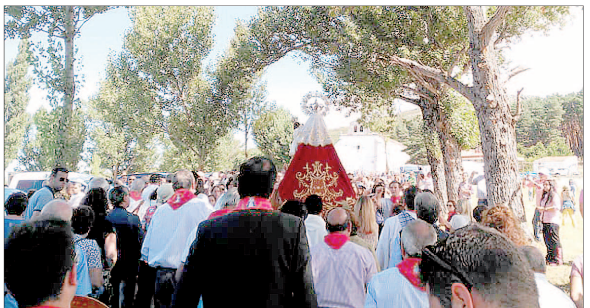
La Virgen del Manto salió en procesión por las calles de Riaza durante el primer fin de semana de fiestas.