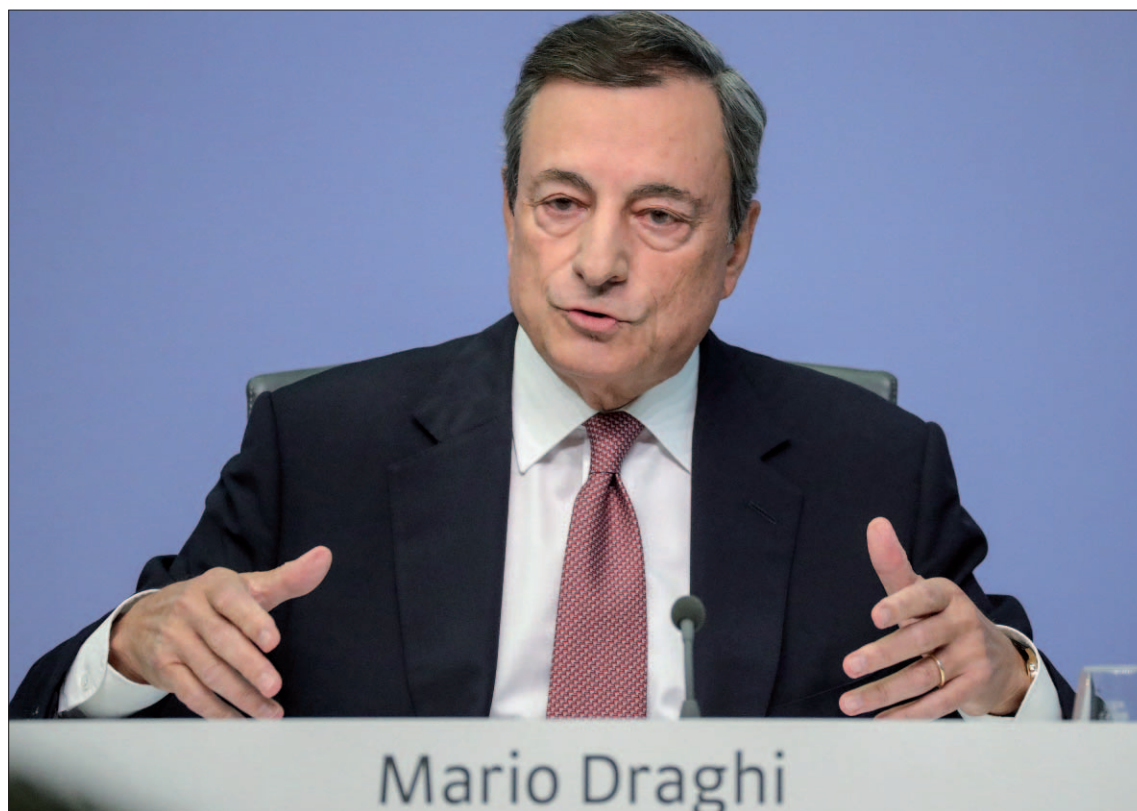
El presidente del Banco Central Europeo (BCE), Mario Draghi.

Con respecto de la inflación, la institución financiera europea explicó que cada vez existe “menos incertidumbre”, por lo que la inflación subyacente “subirá” hacia final de año y mantendrá los incrementos graduales hasta el medio plazo “apoyados” por la política monetaria.