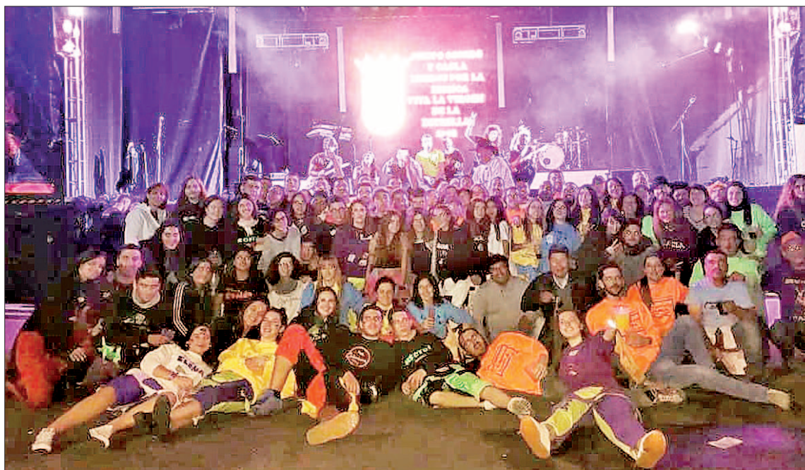
Los casi 200 habitantes de este municipio segoviano han disfrutado de las fiestas en honor de su patrona.