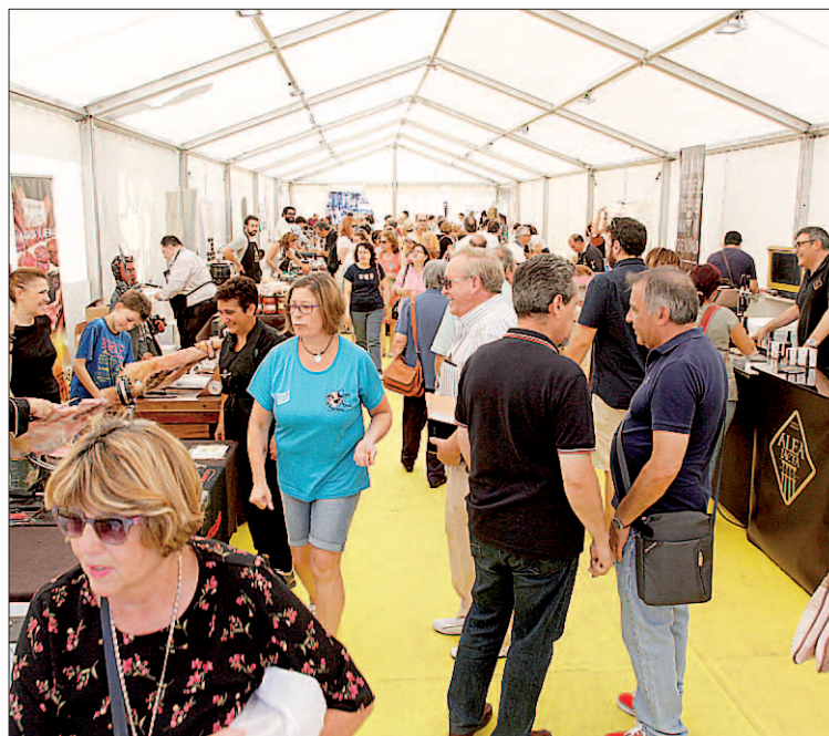
La carpa de Tierra de Sabor muestra los productos de la región.