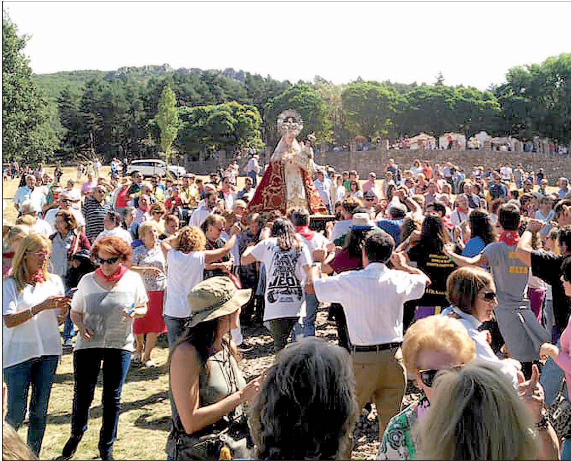
Los riazanos honraron a la Virgen de Hontanares con una romería, como de costumbre.