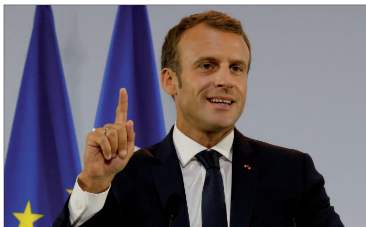
El presidente de Francia Emmanuel Macron atiende a los medios.

El plan de Macron pasa, entre otras cuestiones, por ampliar el acceso a las guarderías y las ayudas económicas a los padres, así como por ofrecer desayunos en las escuelas de educación primaria que estén situadas en zonas consideradas prioritarias. La educación obligatoria se ampliará hasta los 18 años, con el objetivo de combatir unas tasas de abandono que dejan a 60.000 jóvenes