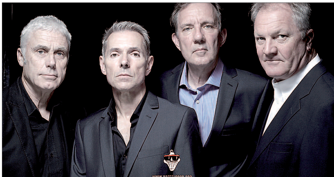
La banda Dr. Feelgood mantiene vivo el espíritu del Rhythm & Blues británico.

con un plan específico de gestión y de uso del Centro de Innovación y Desarrollo (CIDE), además de recoger en el mismo empresas de sectores estratégicos para Segovia, potenciando el crecimiento y la generación de empleo en la ciudad.