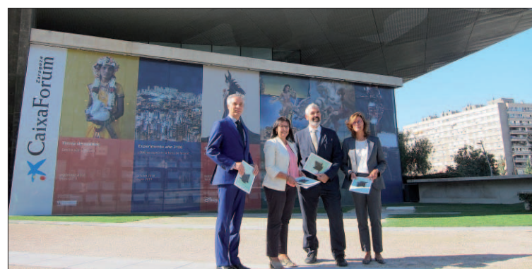
Presentación de la nueva oferta cultura de CaixaForum Zaragoza.

La segunda muestra será ‘Experimento año 2100. ¿Qué nos espera en la Tierra del futuro?’, del