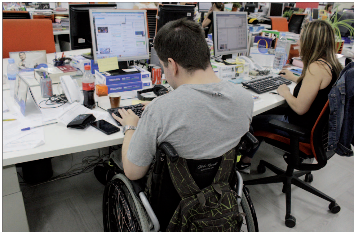
La Junta acordó modificar la regulación del acceso de las personas con discapacidad al empleo público.

La primera modificación que contiene el Decreto supone introducir en el Reglamento el artículo que regula las reglas esenciales que rigen el concurso abierto y permanente. En la Administración de Castilla y León funciona desde hace años una modalidad de concurso, denominado abierto y permanente, para el personal laboral. Este procedimiento para convocar y re-