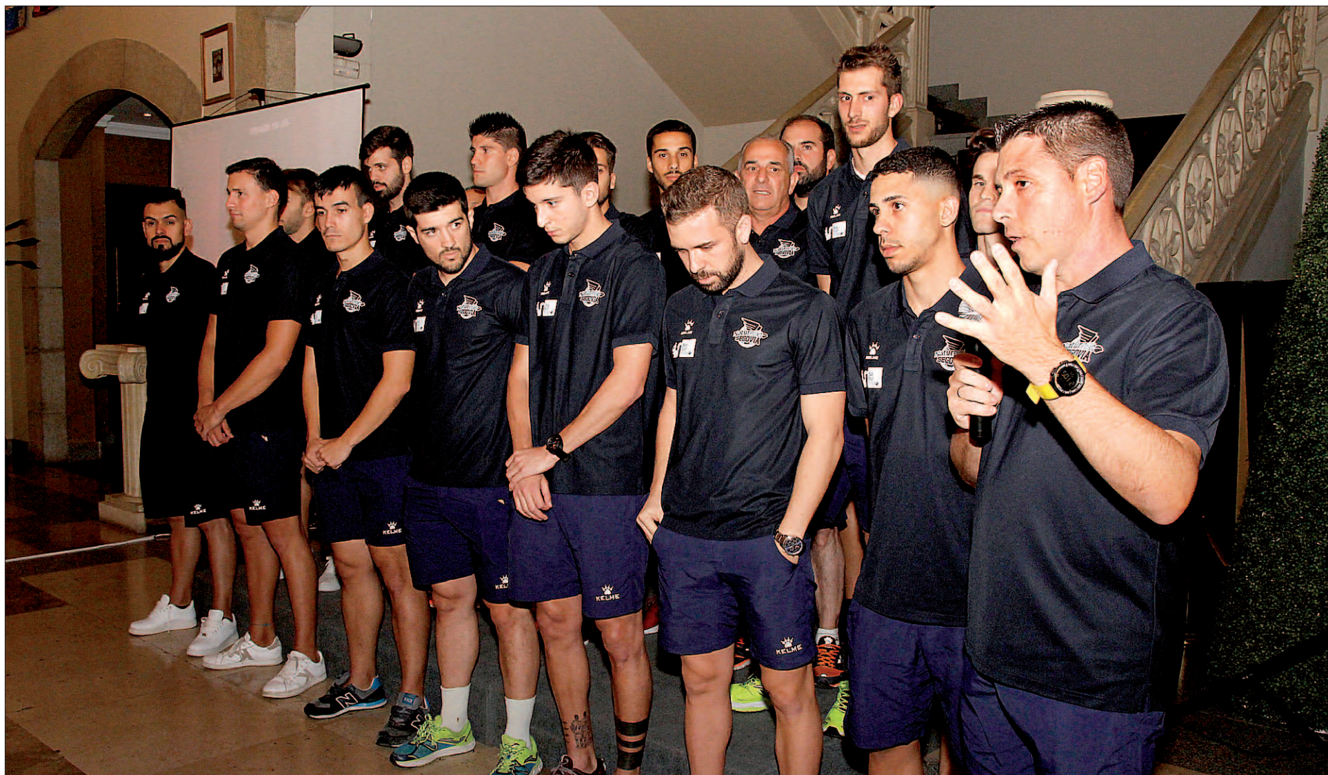
El cuerpo técnico y los jugadores del Naturpellet Segovia, durante el acto de presentación previo al inicio de la competición liguera de la Primera División de fútbol sala.