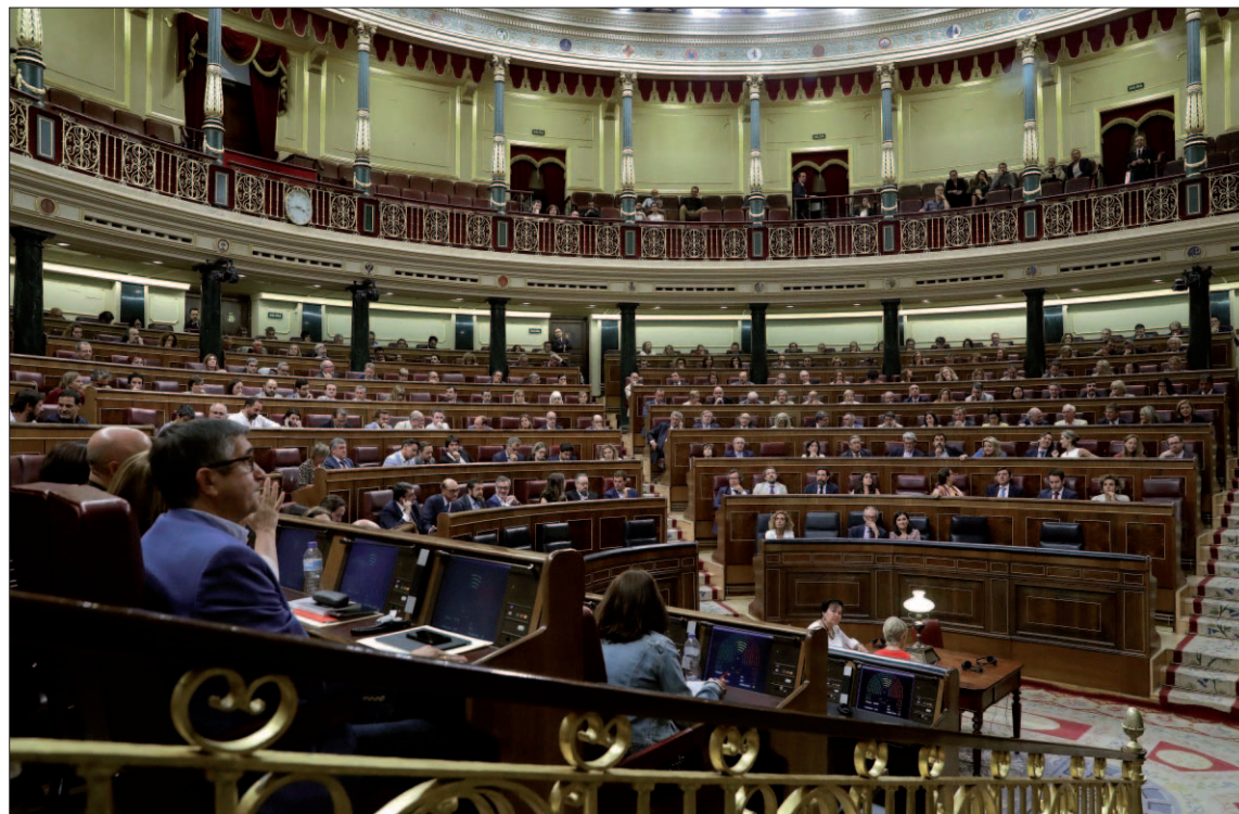
Vista del Pleno del Congreso de los Diputados celebrado en la jornada de ayer.

MAYORÍA ABSOLUTA Al final el decreto-ley fue convalidado por la mayoría absoluta de la Cámara —176 votos a favor—, frente a 165 abstenciones, más los dos ‘noes’