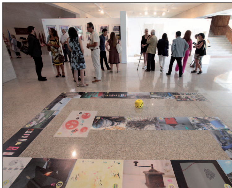
Exposición colectiva en la sede del Parlamento autonómico.