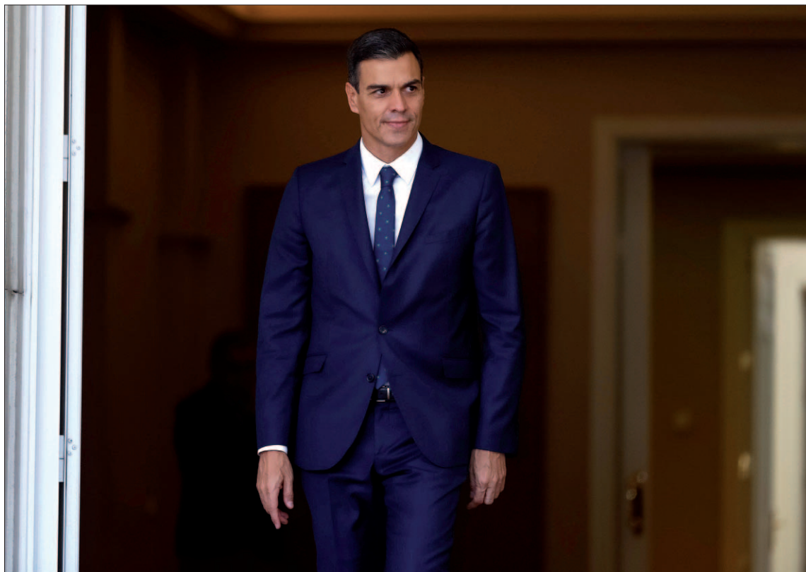
El presidente del Gobierno, Pedro Sánchez, en la Moncloa.

Al servicio de esta campaña de desprestigio, dice Sánchez, “primero se desliza” que no hizo la tesis. “Luego que, si se ha hecho, por qué no se publica” en Internet —hasta ahora se podía leer en la biblioteca de la Universidad Camilo José Cela— y “posteriormente se afirma sin pruebas y sin pudor que es un