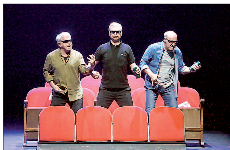
La gira 'Hits', con la que Tricycle se despide de los escenarios, para en Segovia.