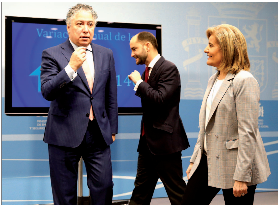
La ministra de Empleo, Fátima Báñez (d), junto a los secretarios de Estado de Empleo y Seguridad Social.

La ministra indicó que la cifra de paro récord en España, situada en el 8%, se podría "alcanzar y vencer" en los próximos años y llegar a una ocupación por encima del 70%. "Es muy probable que si España sigue creciendo al mismo ritmo, por encima del