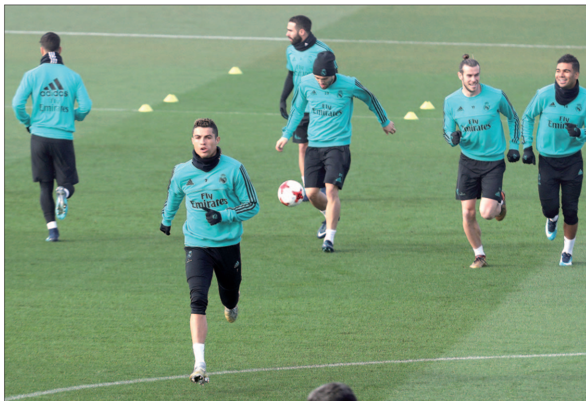
Los jugadores del Real Madrid realizan varios ejercicios en el entrenamiento previo al partido ante el Numancia.

Zinedine Zidane aprovechará para dar minutos a los menos habituales, volviendo a ser de la partida el guardameta Kiko Casilla o el centrocampista Marcos Lloren-