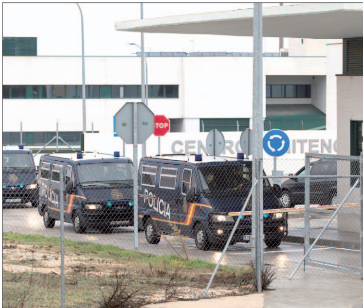
Centro de Internamiento de Extranjeros (CIE) de Archidona.

El hermano del inmigrante fallecido pidió este pasado martes que se lleve a cabo una investigación "al detalle" sobre lo ocurrido y que "no se expulse a los internos, ya que pueden ser testigos". Así, explicó que "hablaba a diario" con