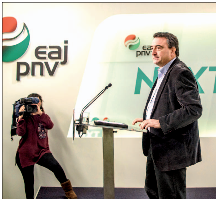
El portavoz del PNV en el Congreso de los Diputados, Aitor Esteban.

A su juicio, el Gobierno de Mariano Rajoy tiene que entender “que ahí hay un problema político al que debe hacer frente, que en la sociedad catalana hay un amplio sector que para nada está de acuerdo con la situación y con la postura de Madrid”.