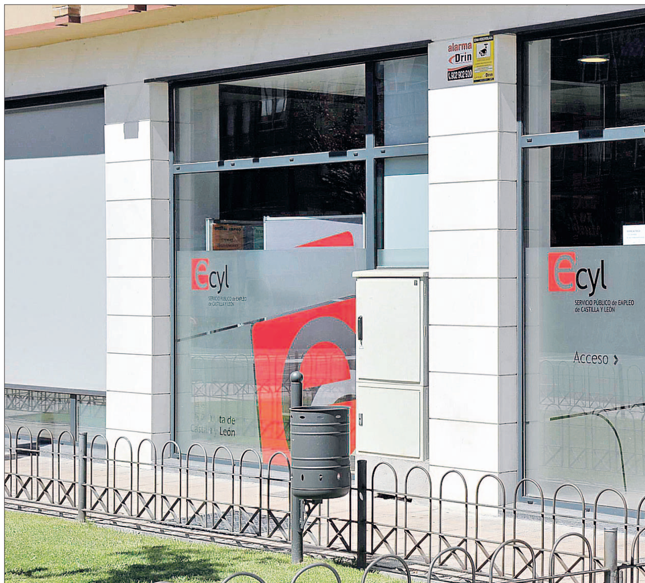
Las oficinas del ECYL en la Via Roma gestionaron las altas y bajas en el mercado laboral en la provincia a lo largo del pasado año.

En la actualidad, el número de parados en Castilla y León (un total de 15.056 son extranje-