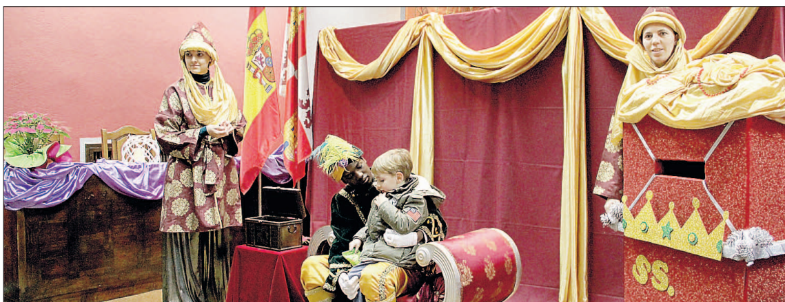
Cartero Real en su visita de 2016 a la villa de Cuéllar.

El Cartero Real se instalará en el Consistorio desde las 17.30 horas. Se celebrará un sorteo de vales regalo a las 20.00 horas, como viene siendo la tradición en este día. La actividad es posible gra-