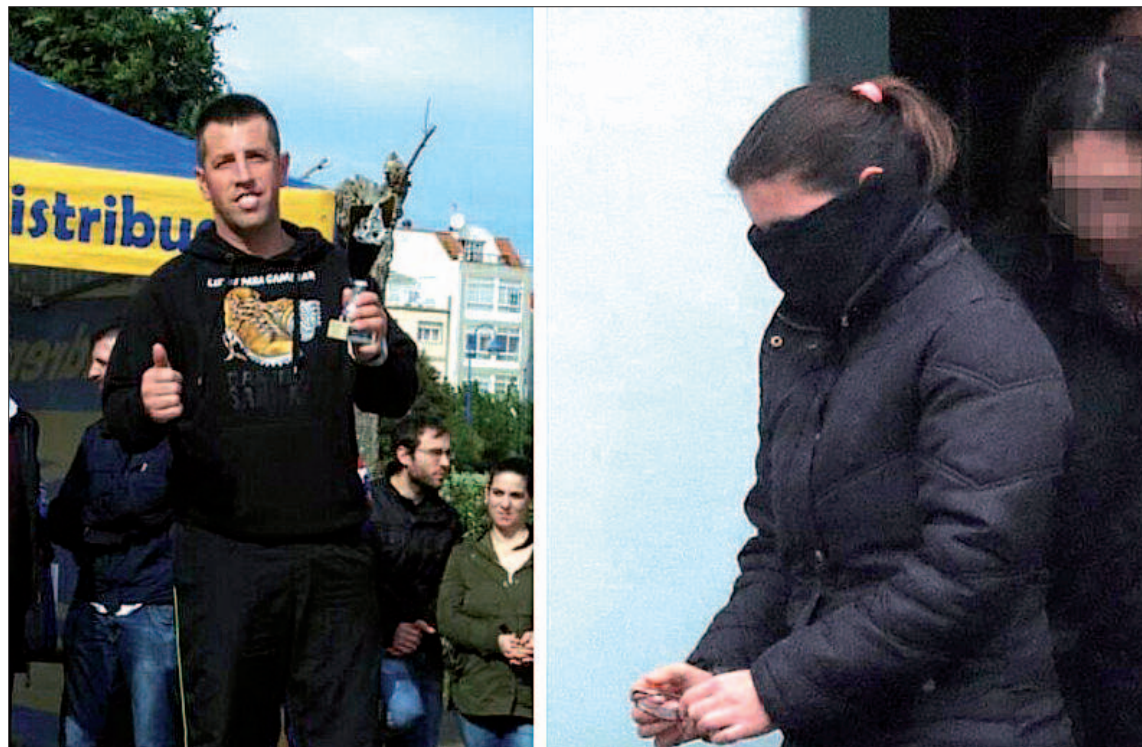
Imagen de archivo de 'el chicle' (izquierda) y su mujer (derecha) en el momento de su detención.

El Juzgado de Instrucción Número 1 de Ribeira acordó, en un auto firmado el martes, la reapertura de las actuaciones seguidas por la desaparición de Diana Quer porque, a raíz de las últimas investigaciones policiales, "se desprenden de la existencia de nuevos elementos fácticos que corroboran los in-