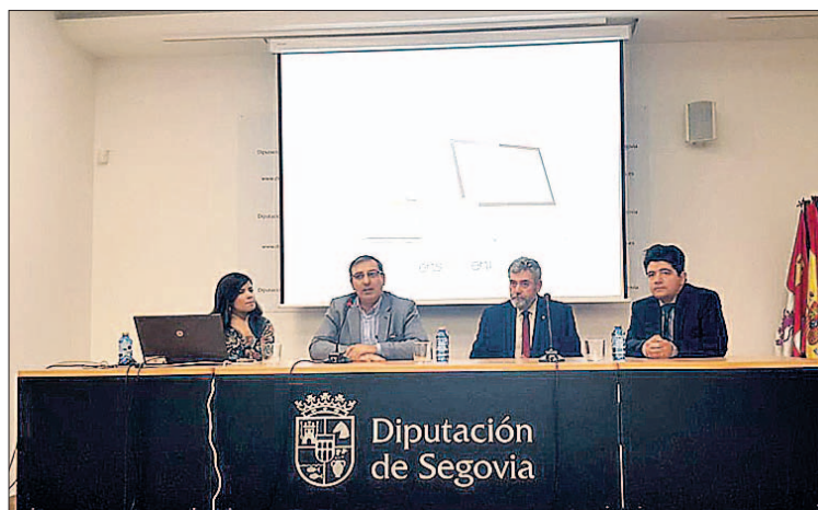
Expertos en sistemas de administración electrónica.

Con el fin de adherirse a esta campaña, las entidades locales de la provincia interesadas firmaron una autorización con el objeto de que la Diputación solicitara en su nombre el alta administrativa al Ministerio. En la misma autoriza-