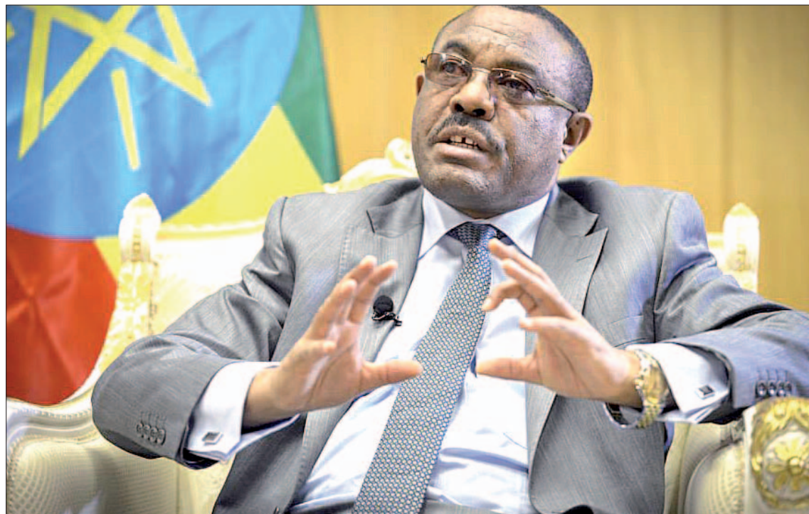
El primer ministro de Etiopía, Hailemariam Desalegn, en una imagen de archivo.

Por el momento no está claro qué es lo que ha motivado la de-