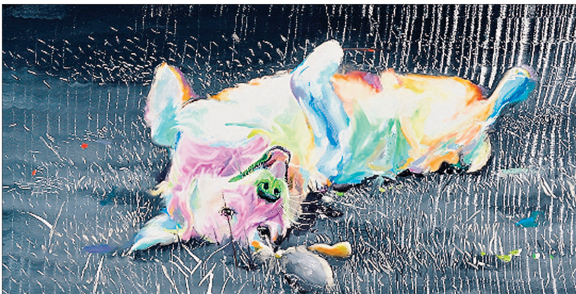
'La alegría de vivir', óleo en aluminio que se exhibirá en el hotel madrileño hasta el 12 de marzo.