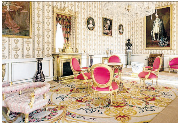
El Palacio Real de La Granja (arriba) y el de Riofrío, están en tercer lugar.