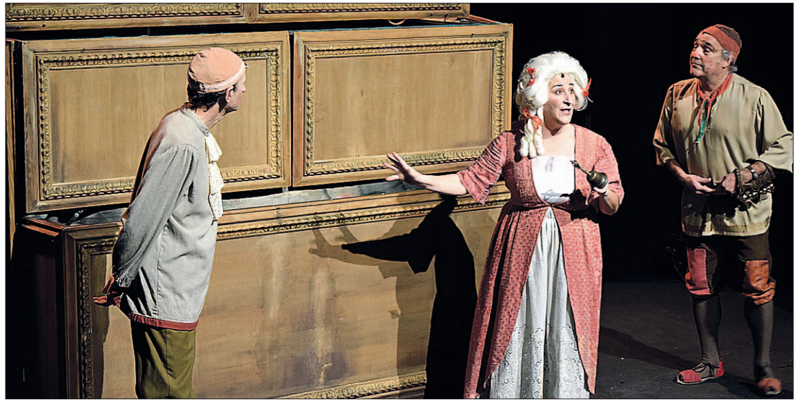
Titiriteros de Binéfar durante la representación de su Retablo de Navidad la tarde del pasado martes.

PROGRAMA NAVIDEÑO Dentro del programa de Navidad que coordina la Concejalía de Cultura, la música ha sido y seguirá siendo hasta el lunes día 8 la principal protagonista, con permiso de la Cabalgata de Reyes que se celebrará como es habitual la tarde noche de mañana día 5. Al día siguiente, 6 de enero, festividad de la Epifanía del Señor, la Banda de la Unión Musical Segoviana ofrecerá el tradicional Concierto de Reyes en la Iglesia de San Frutos a partir de las ocho de la tarde. Ya el domingo 7 y el lunes 8, la Sociedad Filarmónica de Segovia, en colaboración con el Ayuntamiento y la Diputación, presentará su Concierto de Navidad a las 20,30 horas con la Orquesta Sinfónica de la Universidad de Anatoía en el Teatro Juan Bravo.