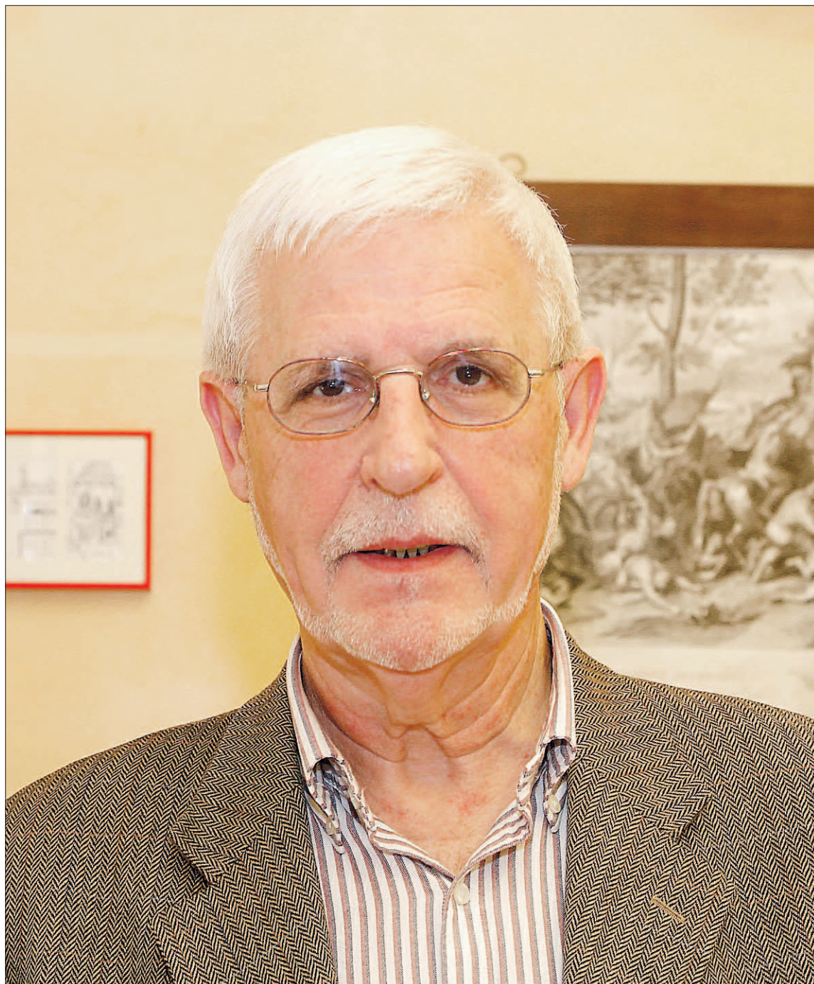
El actual defensor de la Ciudadanía tomó posesión de su cargo en 2015.

Luego también hay determinadas demandas más instrumentales, como quejas, porque la gente disiente de lo que la Administración ha hecho con ellos y puede ser desde una multa de tráfico a un tributo que hay que pagar o una decisión urbanística o puede ser la ocupación de la vía pública, de las mil cosas que gestiona un Ayuntamiento. Entonces, informar, asesorar, atender las quejas, todo eso supone unos distintos modos de ac-