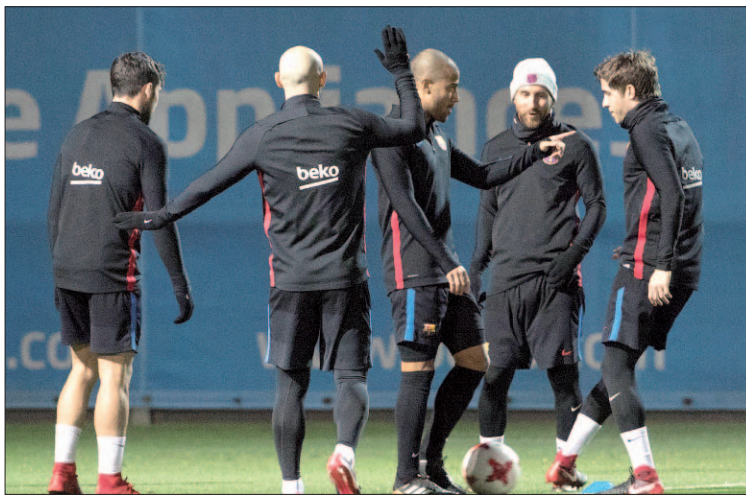
Los jugadores del Barcelona se entrenan antes del partido.

Pese a que el último enfrentamiento entre ambos en la Copa, con 4 eliminatorias pasadas por el Barça y 2 por el Celta de las 6 en las que se han enfrentado, dista ya