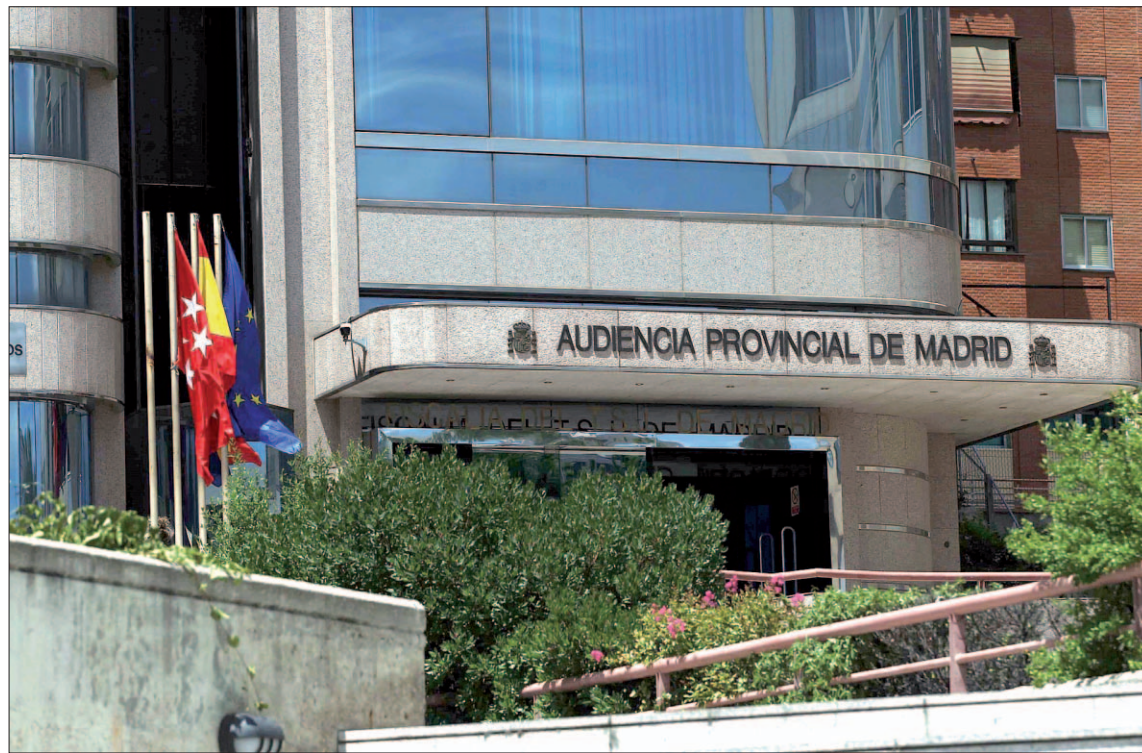
El 'Caso Bloque' de corrupción policial en Coslada, se juzgará en la Audiencia Provincial de Madrid.