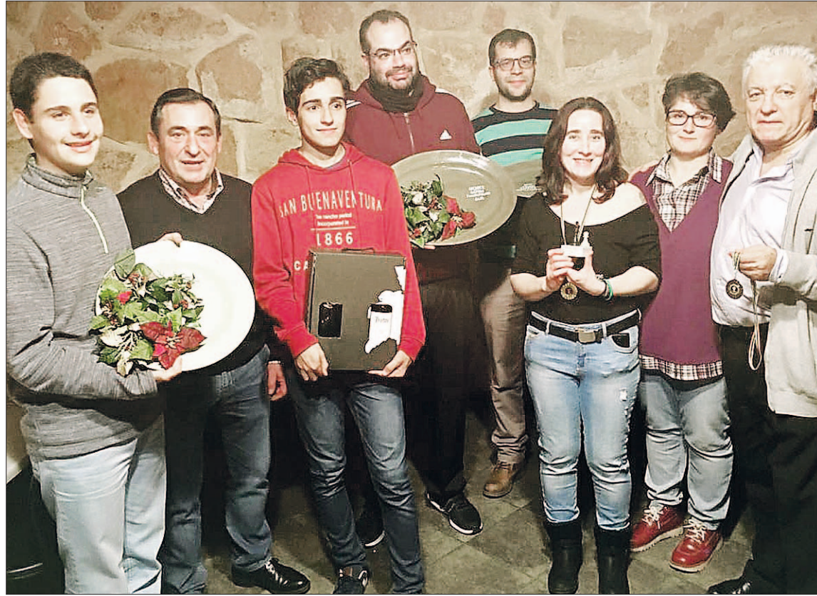
Foto de familia de los ganadores de las distintas categorías.