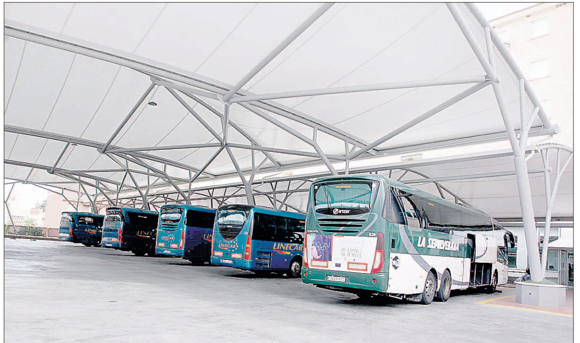
Una nueva tasa grava a las empresas de transporte que operan en la Estación de Autobuses de Segovia.