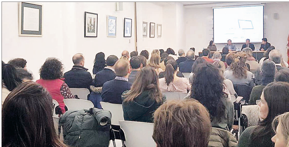
Asistentes al curso organizado por el Área de Asesoramiento a Municipios.

A estas entidades que se sumaron en esta primera fase, la Diputación ya les ha gestionado el alta en el primero de los servicios: el Sistema de Información Administrativa (SIA). El sistema permite a los ayuntamientos sincronizar su catálogo de trámites y servicios con el Punto de Acceso General de la administración del Estado que