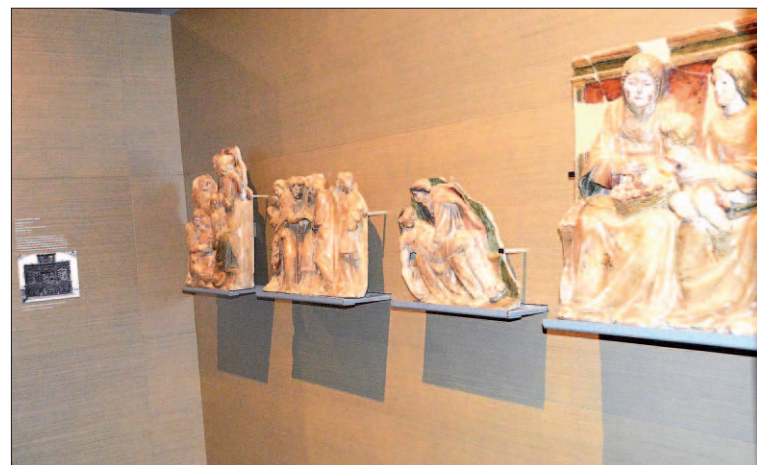
Algunas de las piezas de los bienes de Sijena.

Estos recursos llegan después del que presentó la Generalitat catalana el pasado 7 de diciembre ante la providencia del magistrado del Juzgado número 1 de Huesca que fijó el lunes día 11 como