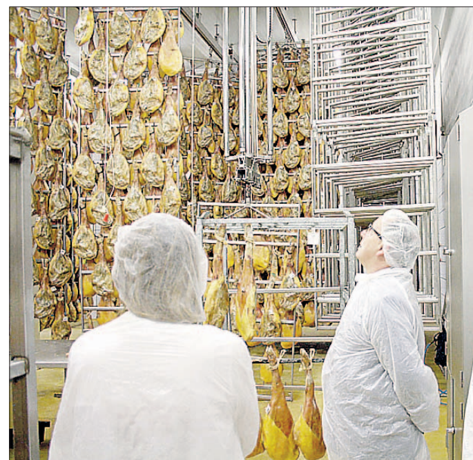
Una visita institucional a Monte Nevado. / EL ADELANTADO

Con la inversión, Monte Nevado contribuye a evitar la despoblación rural, mejorar la igualdad de género, avanzar con la innovación y mejorar el entorno.