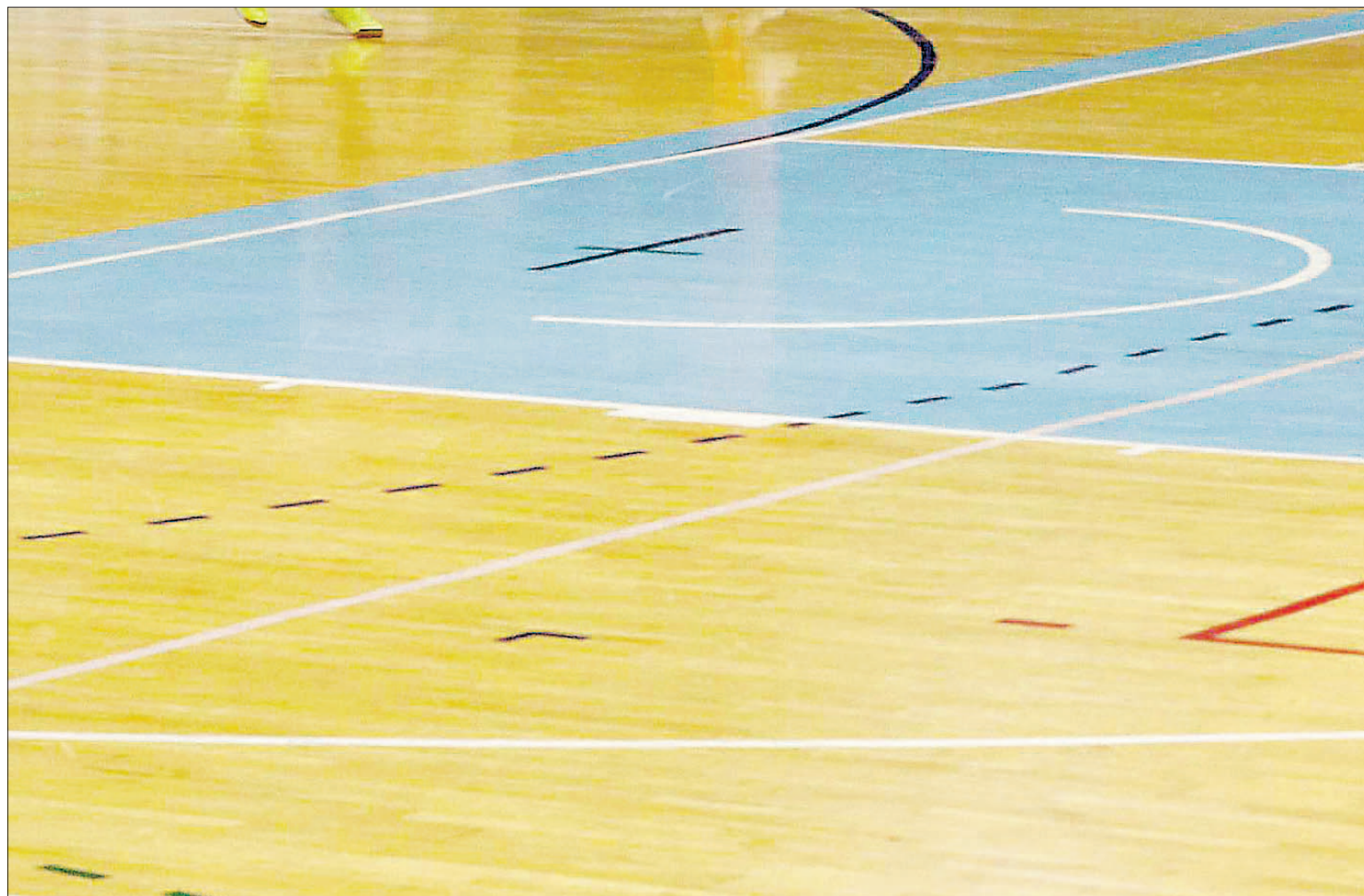
Imagen parcial del parquet del Pedro Delgado, que suma 26 años de vida útil con una media de uso de doce horas diarias.

UN COSTE DIFÍCILMENTE ASUMIBLE De esta manera, en repetidas ocasiones la concejal de Deportes ha señalado la incapacidad del Ayuntamiento de Segovia de hacer frente a ese coste, y la necesidad de volver a pedir la colaboración de otras instituciones, normalmente mirando a la Junta de