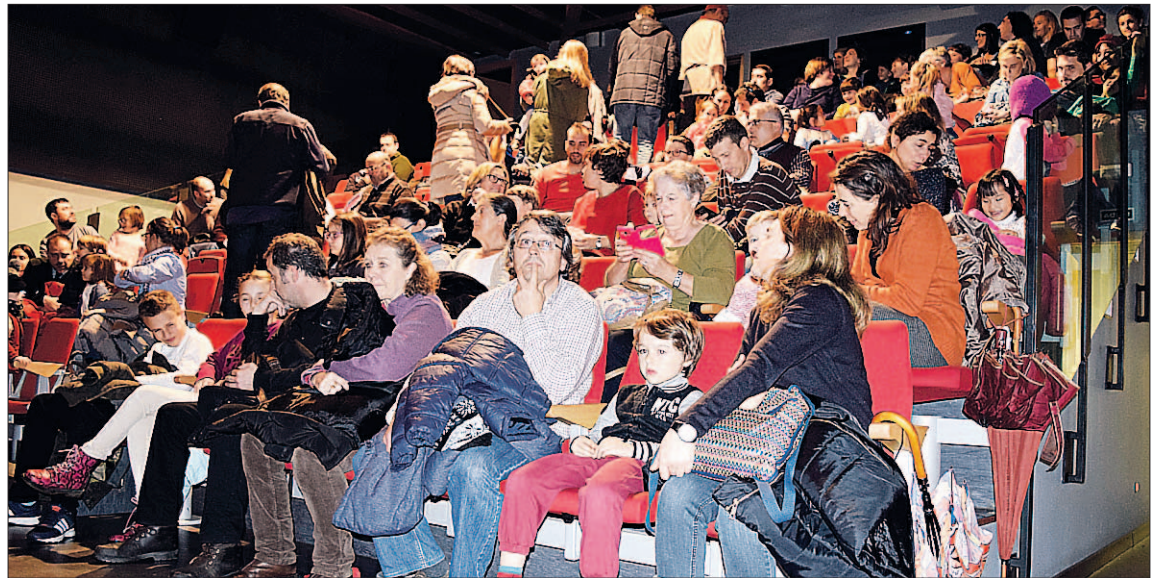
El público segoviano ha respondido al ciclo Vamos al Teatro estas navidades.