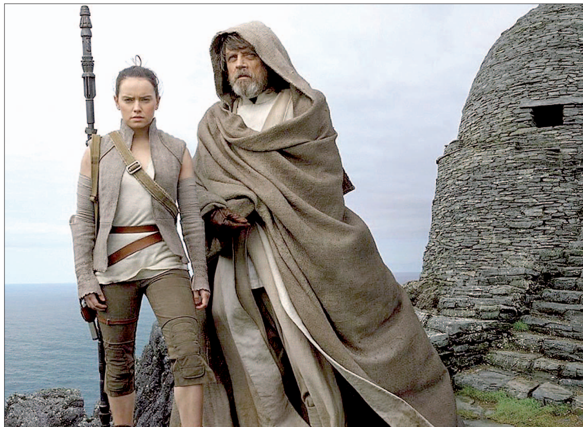
La última entrega de la saga galáctica superó los mil millones de dólares en la taquilla mundial.

La franquicia más taquillera de la historia es el Universo Cinema-