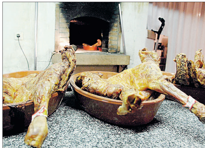
Varios cuartos de lechal salidos del horno de asar.

La Interprofesional pretende instaurar esta acción con el fin de realizarla todos los años por estas fechas.