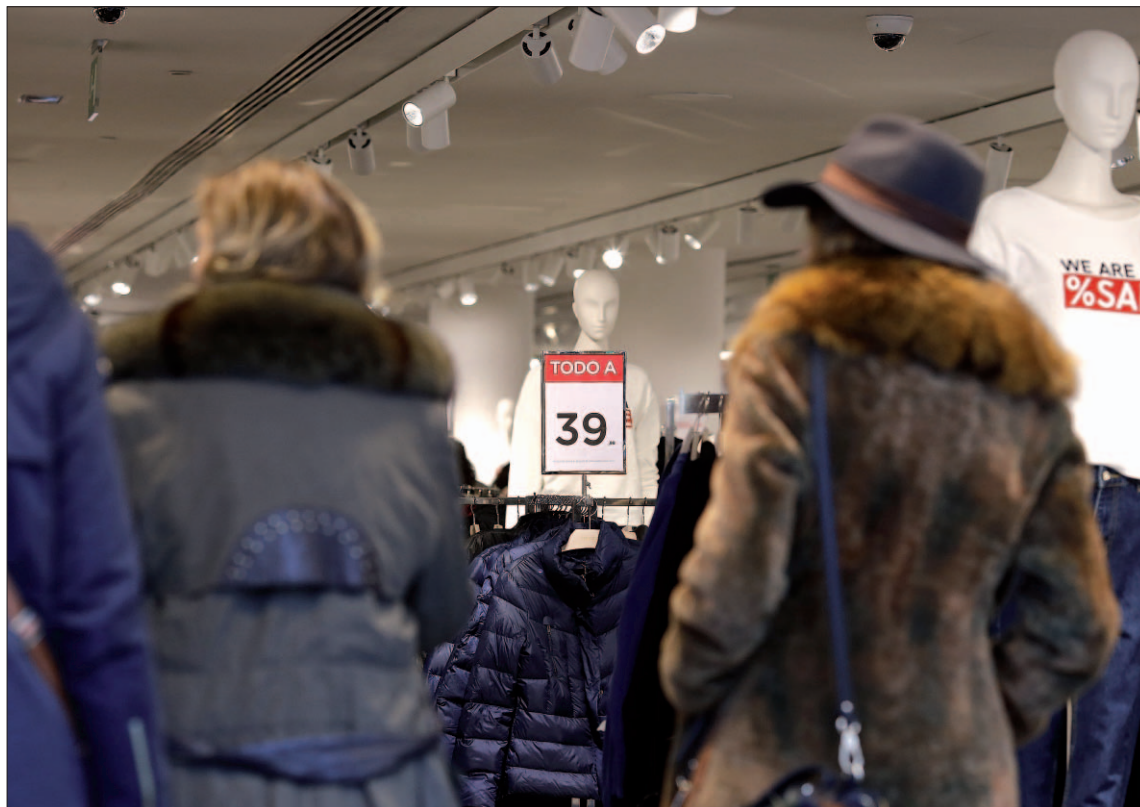
El índice de valoración de la situación actual por parte de los consumidores alcanzó en diciembre los 92,9 puntos.

Por su parte, el índice de expectativas de los consumidores se situó en diciembre en 112 puntos, un aumento de 2,3 puntos respecto al mes precedente, con una evolución "muy dispar" de sus tres compo-