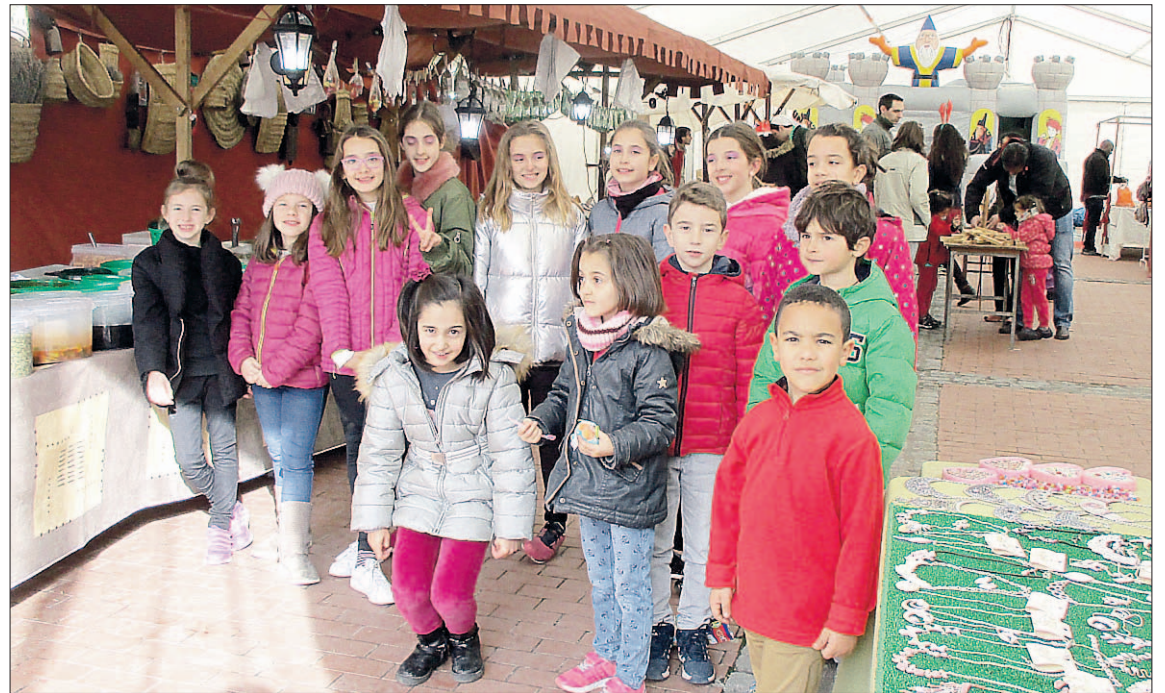
Un grupo de niños, en el mercadillo navideño de Cantimpalos.