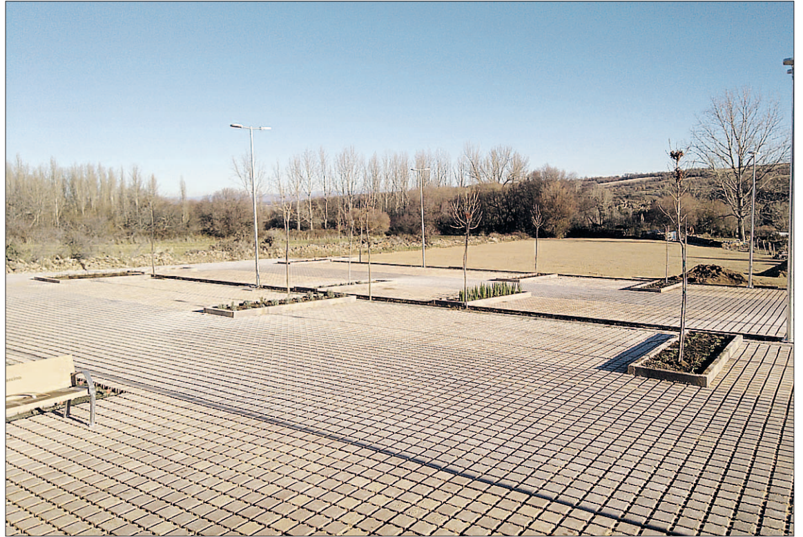
Vista de las obras realizadas en el aparcamiento de la calle Alfonso VII.

En total se han acondicionado 1.721 metros cuadrados de superficie destinada para aparcamiento. En esta primera fase, se han acometido obras de cajeadado, extendido y compactación de zahorra, excavación para la instalación de red de saneamiento, abastecimiento, alumbrado público, energía eléctrica y red de telefonía. La pavimentación del aparcamiento se ha realizado en adoquín ecológico de hormigón. El llagueado entre los adoquines se ha acabado con manto y césped que junto con la jardinería, compuesta por especies arbóreas y aromáticas autóctonas, permite tener una percepción vi-