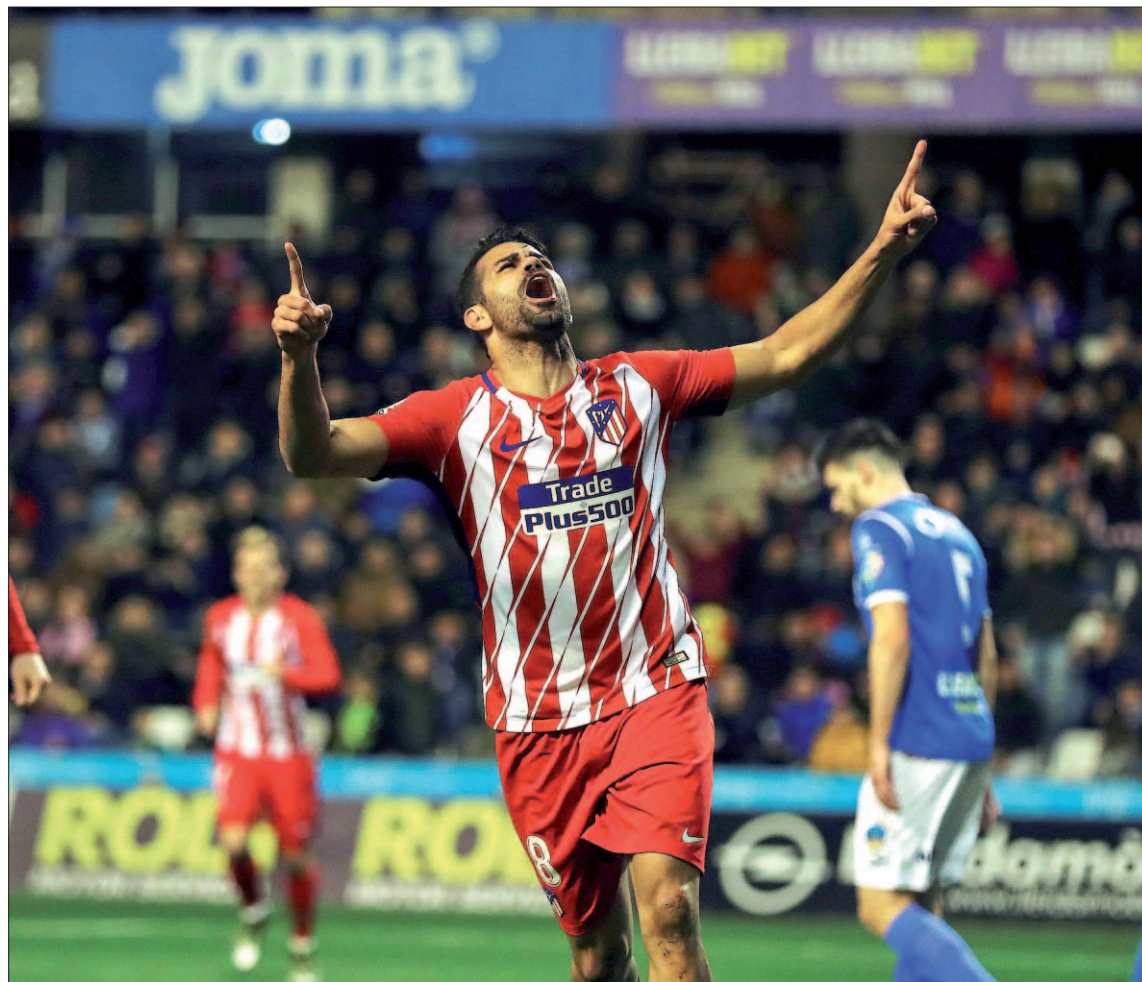
El delantero del Atlético de Madrid Diego Costa celebra el gol conseguido ante el Lleida en la Copa del Rey.