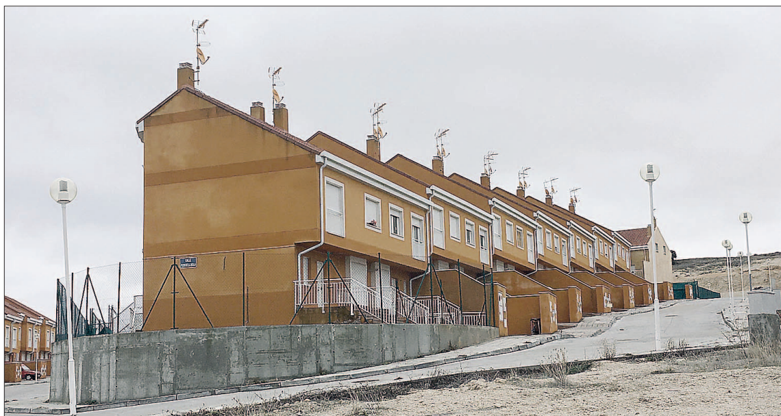
Chalets pertenecientes a la urbanización de la Fuente de la Bola.

Desde el PSOE de Cuéllar consideran que esta situación se ha vuelto "inasumible" y parece que va a más en lugar de reconducirse. "Ya nos quedamos perplejos con el casi atropello a un agente de la Policía Local y miembros de la comunidad educativa a la salida del colegio La Villa, y ahora nuestros vecinos tienen que vivir con el nerviosismo de continuas y graves reyertas", manifiestan. En consecuencia, desde el PSOE solicitan al alcalde que convoque con la máxima urgencia la Junta de Seguridad Ciudadana en la cual están representados los distintos cuerpos y fuerzas de seguridad, así como la subdelegada del Gobierno de Segovia y representantes de los grupos políticos locales. Los socialistas apuntan que hay motivos fun-