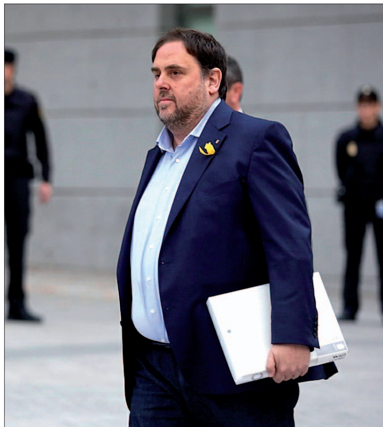
Oriol Junqueras está privado de libertad desde el pasado 2 de noviembre.

Junqueras está encarcelado desde el 2 de noviembre en el centro penitenciario de Estremera, en la Comunidad de Madrid, y el pri-