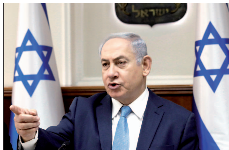
El primer ministro israelí Benjamin Netanyahu en una imagen de archivo.

de Presos Palestinos, Qadoura Fares, consideró la votación de este miércoles “una expresión del estado de ceguera y confusión en las políticas del régimen fascista”, en alusión a Israel. Así, criticó en declaraciones a Reuters que “los par-