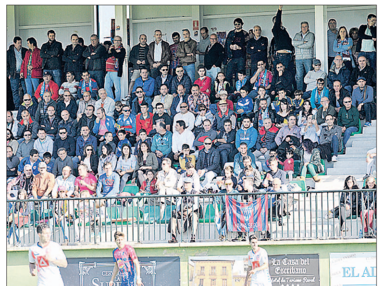
Vista parcial de la grada de La Albuera, repleta de aficionados.

El equipo azulgrana ha generado mucha expectación en los aficionados, marcando una media superior al millar de espectadores en la competición regular en Segunda B, sin olvidar los más de 4.000 espectadores que disfrutaron del partido del ascenso de la Segoviana ante el Malagueño.