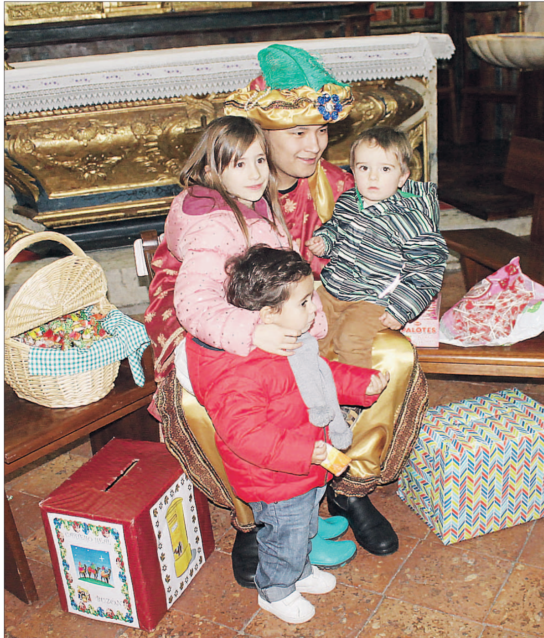
El Cartero Real posa junto a tres de los niños que ayer depositaron sus cartas en el buzón que trajo a tal fin.

Para que la tarde fuera completa, la Cofradía del Cristo del Mercado ofreció a la entrada de la ermita un delicioso chocolate con bizcochos a cambio de un donativo voluntario que irá destinado al proyecto de las Misioneras Carmelitas que está llevan-