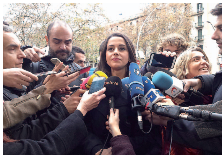
La líder de Ciudadanos en Cataluña quiere impedir un bloque independentista.

Preguntada por el candidato de C's a presidir la Cámara, Arrimadas afirmó que el partido no tomó una decisión pero que el hasta ahora vicepresidente segundo de