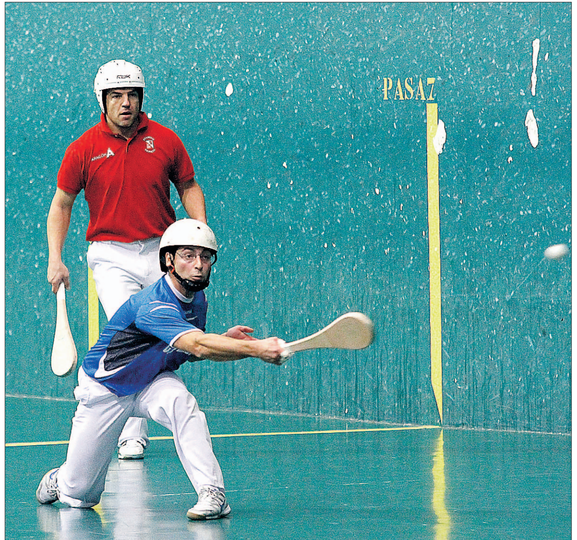
Un jugador segoviano golpea la pelota en un encuentro disputado en el frontón de Vallelado.

Sin embargo, no va a ser tan sencillo como se supone en un principio que el cuadro de Segovia consiga la primera plaza de su gru-