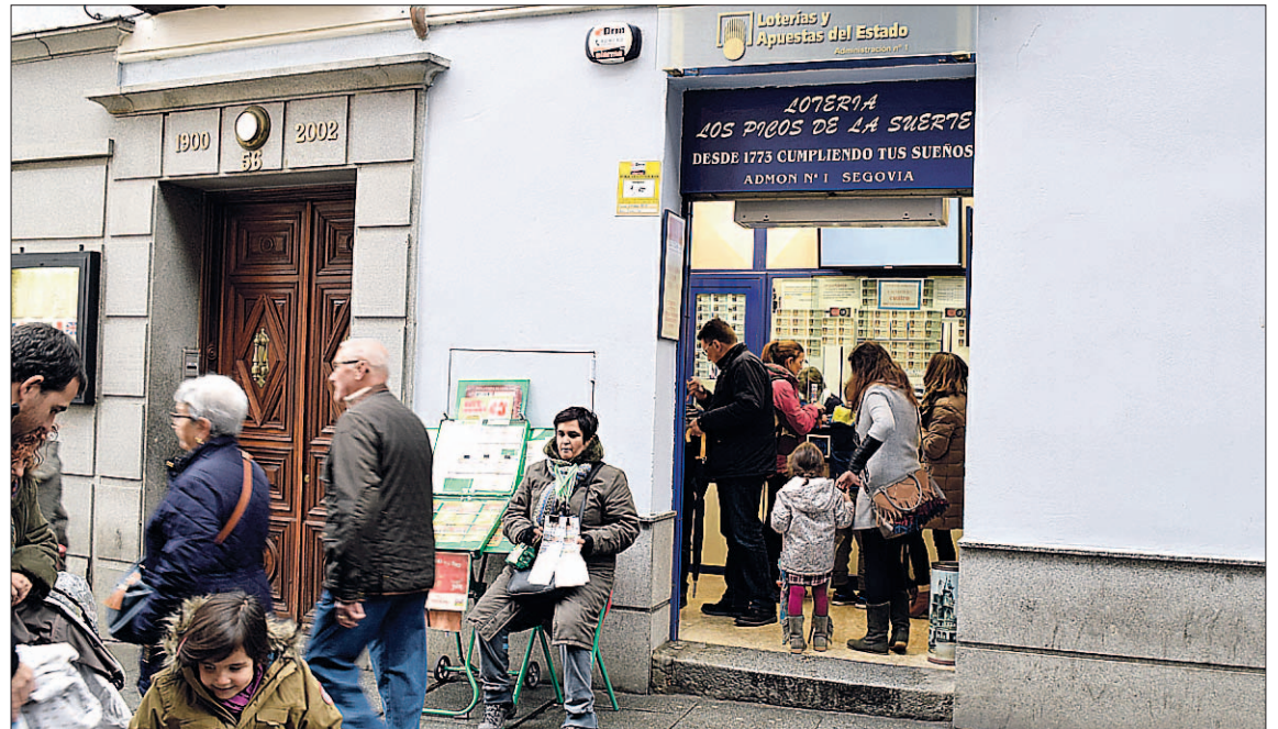
Los segovianos apuran estos días para comprar los décimos para 'El Niño'.

Sin duda, el sorteo de 'El Niño' es el segundo más importante del año, ya que la consignación y posterior venta de décimos es considerablemente menor si se compara con la del sorteo de 'El Gordo' de Navidad. La ilusión y la esperanza de que la suerte caiga en Segovia no para, ya que a pesar de que 'El Gordo' pasó prácticamente de largo y no se acordó mucho de los segovianos, muchos ciudadanos aprovechan estos últimos días para invertir lo poco que han ganado en el sorteo de Navidad en algún décimo de 'El Niño'. En estos días se ven muchas colas en las administraciones segovianas de