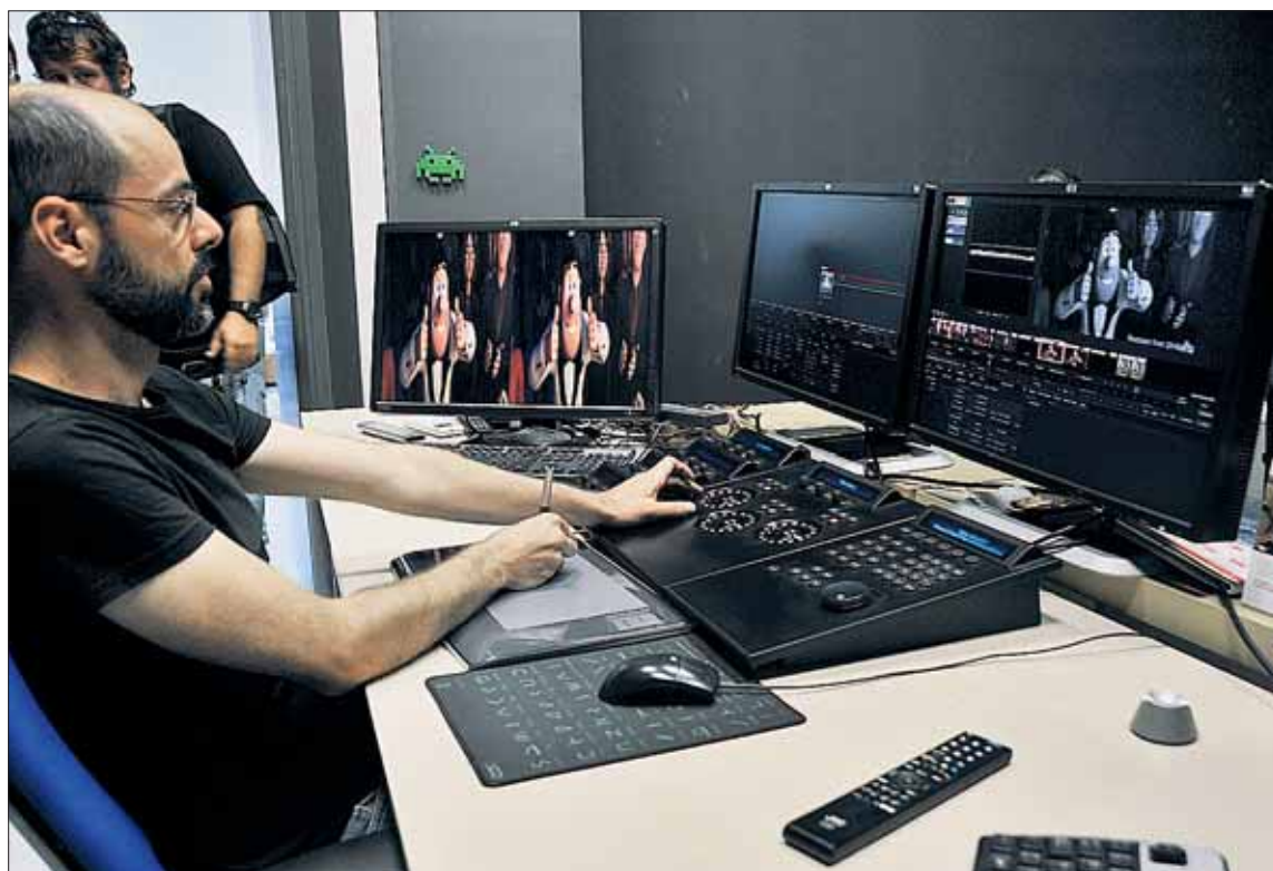
La empresa Next Lab durante el proceso de estereoscopia de la segunda entrega de la película Tadeo Jones.

En los cines Luz de Castilla fueron testigos de las andanzas de Tadeo Jones en la Alhambra, entre otros lugares, buscando pistas que