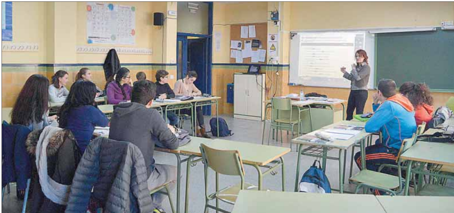
Clases en la sede central de la Escuela Oficial de Idiomas (EOI) de Segovia, que en el nuevo curso acercará su oferta a los vecinos de Cantalejo.