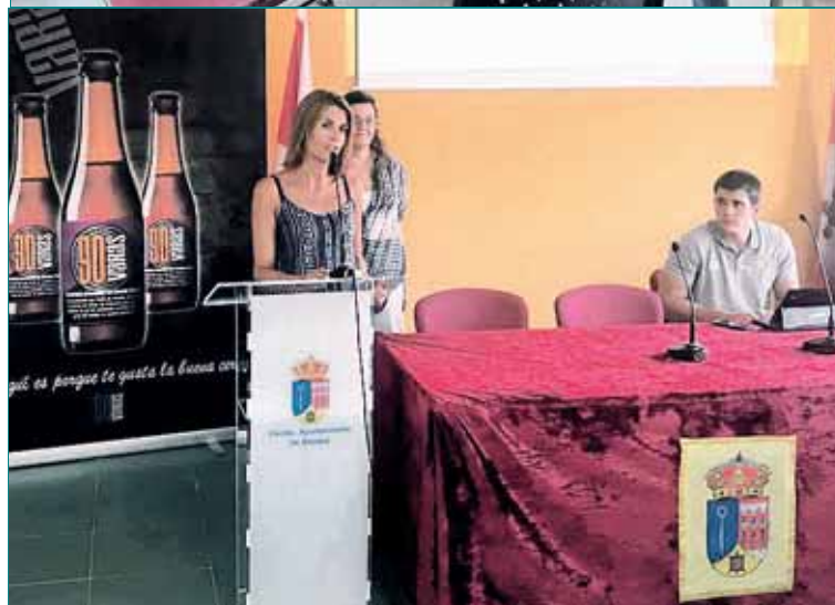
ABADES ha acogido este fin de semana una cata de cerveza 90 varas. Organizado por el Ayuntamiento de la localidad y la Diputación a través de Promoción Económica, la actividad tuvo lugar en el Centro Javier Santamaria.