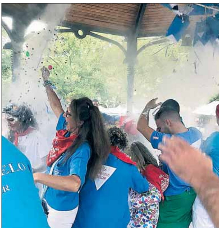
Los pequeños cuellaranos no perdonaron y también pudieron disfrutar los mayores, que no dudaron en embadurnarse de harina./C.N.