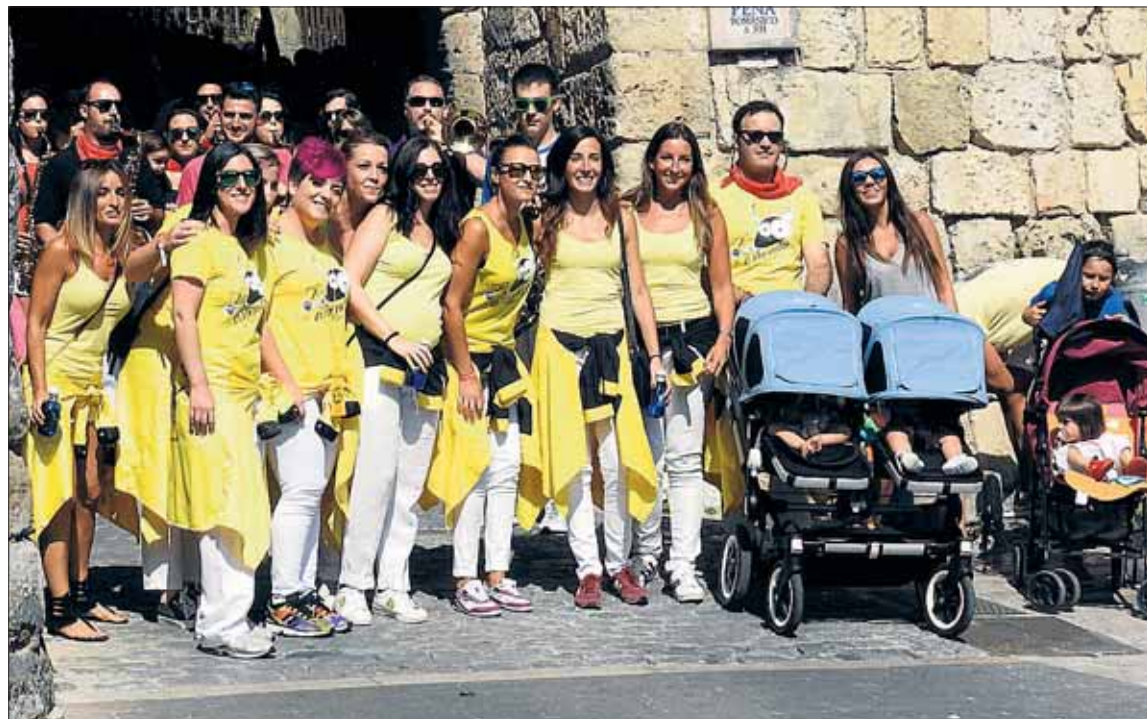
Componentes de una peña posando en el arco del Ecce Homo, en el desfile inaugural de peñas.