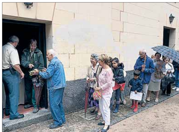
Los feligreses pasaron, tras la eucaristía, uno a uno a recibir su pera.