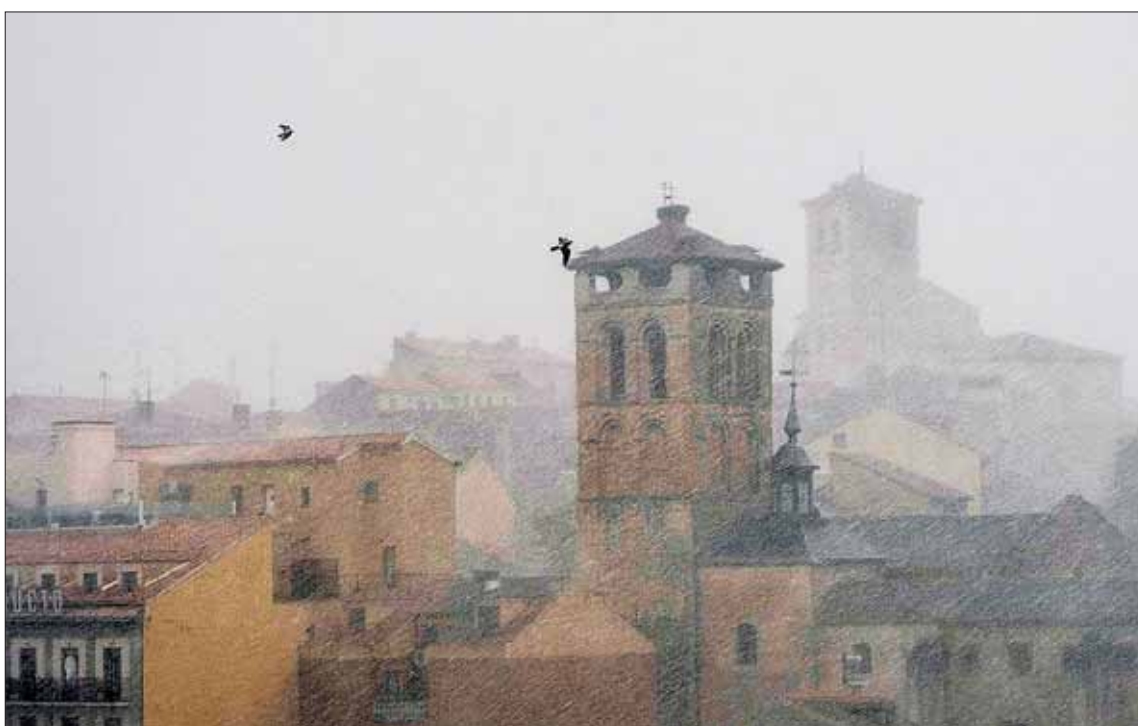
En julio y en agosto se han registrado precipitaciones en forma de lluvia o granizo seis días, hasta el momento.

Dentro del periodo estival destaca la sequía de junio ya que solo se recogieron 15,8 litros, cuando la media se sitúa en 43l, según datos del Observatorio Meteorológico-