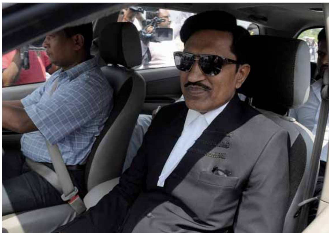
El popular gurú indio Gurmeet Ram Rahim Singh a la salida del juzgado.

Nada más conocerse el detalle del fallo, seguidores del popular gurú han quemado un coche en la localidad de Kotli, cerca de Sirsa. "Estamos investigando pero parece ser obra de los miembros de De-