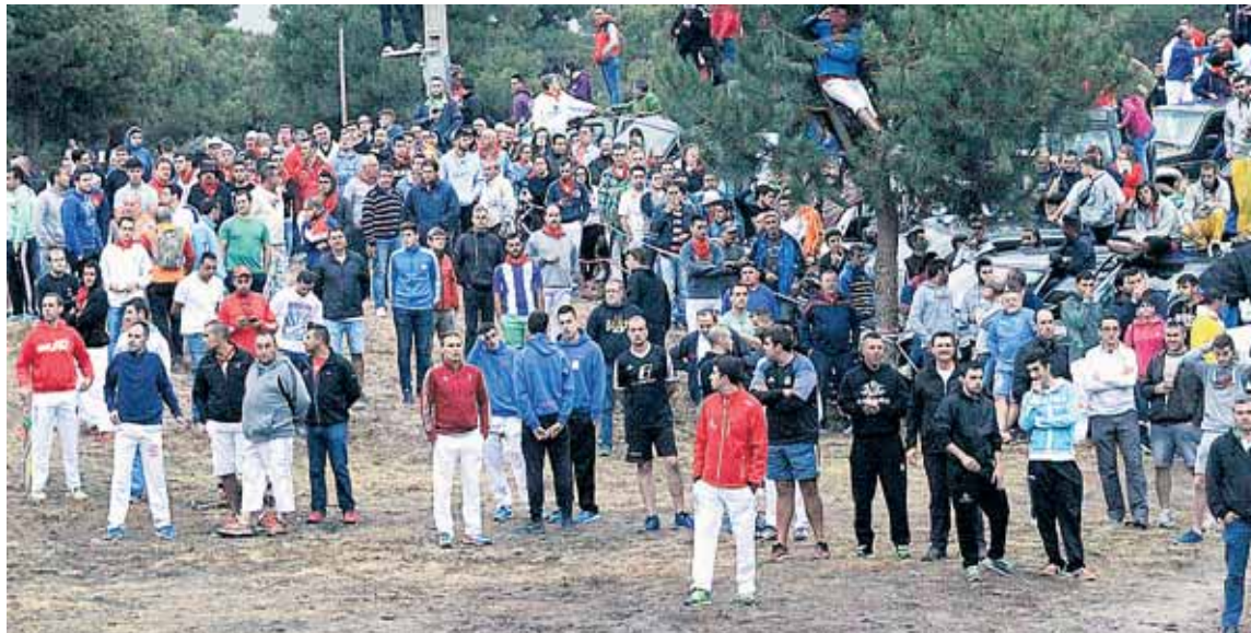
Son muchas las personas que siguen el recorrido por el campo de las reses del encierro.

"Ha sido una catástrofe, tres reses y dos horas después, pero hay que verlo desde el otro lado, si la organización hubiera sido mala y los caballistas no hubieran trabajado, ni una res estaría en la Plaza de Toros", concluyó.