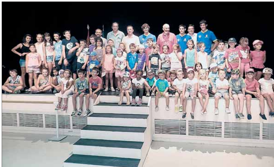
Los piragüistas de Palazuelos de Eresma son un referente para los niños y la población joven del municipio.

Según fuentes municipales, la concesión de las becas a deportistas individuales de élite tiene un doble sentido, por una parte suponen el apoyo y el reconocimiento del municipio de Palazuelos a la trayectoria deportiva de