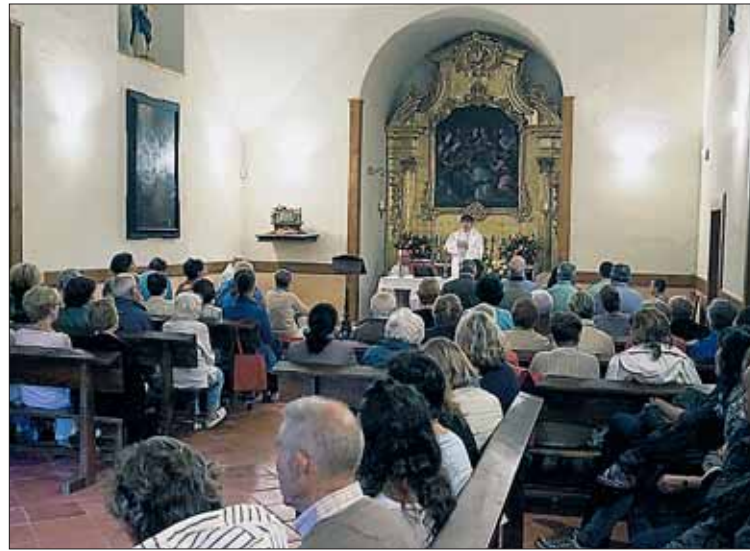
La ermita estaba repleta durante la eucaristía del párroco-abad.

Esta distribución suponía un alivio para los problemas nutricionales de aquel momento, y sobre todo de escasez de vitamina C, que ocasionaba en muchos casos escorbuto. Además, la representante real eligió el día de San Agustín, como una forma de marcar el final de la temporada veraniega.