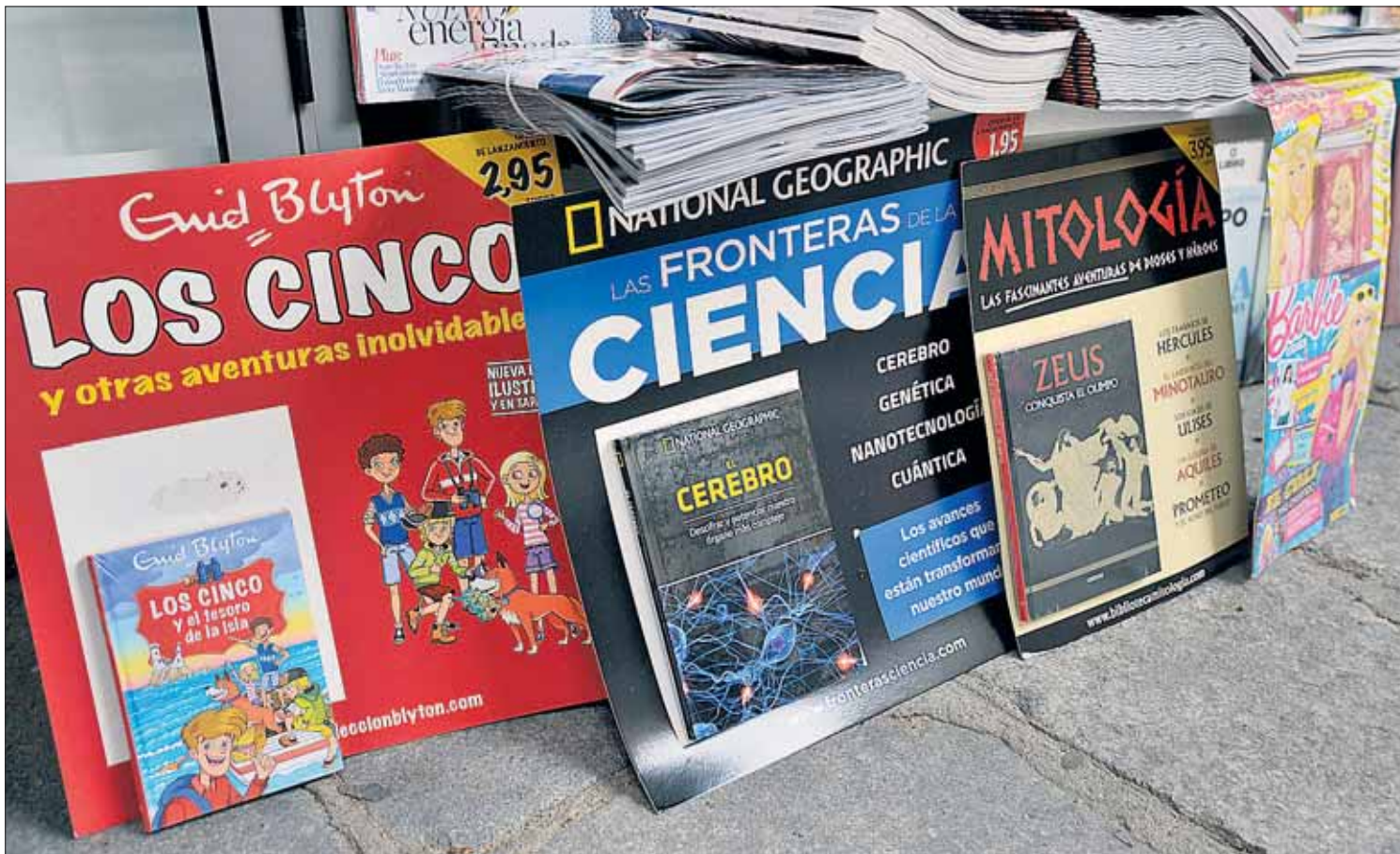
Varios tipos de coleccionables adaptados a diferentes gustos y edades expuestos en un quiosco junto a las revistas y periódicos.