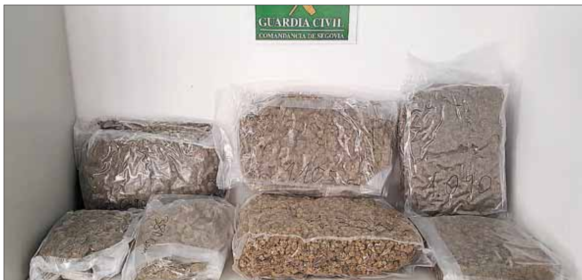
Los detenidos transportaban seis kilos de marihuana en el interior dos bolsas de deporte. /

La Guardia Civil halló dos bolsas con marihuana que los detenidos pretendían ocultar tras ser sorprendidos en un control