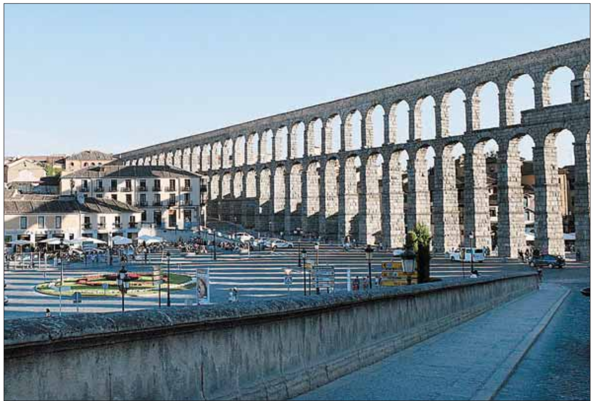
Vista del Acueducto desde la calle San Juan.

Recuerda el grupo magenta que el Acueducto, tal y como aludió en alguna ocasión la concejala de patrimonio, es una "zona noble" de la ciudad, así como uno de los principales escaparates. Según Aranguren "no podemos banalizar ese lugar con eventos menores que de desgastan el valor del Acueducto" y prosigue señalando que "no comprendemos que este Ayuntamiento acepte corromper ese lugar con acontecimientos comerciales que