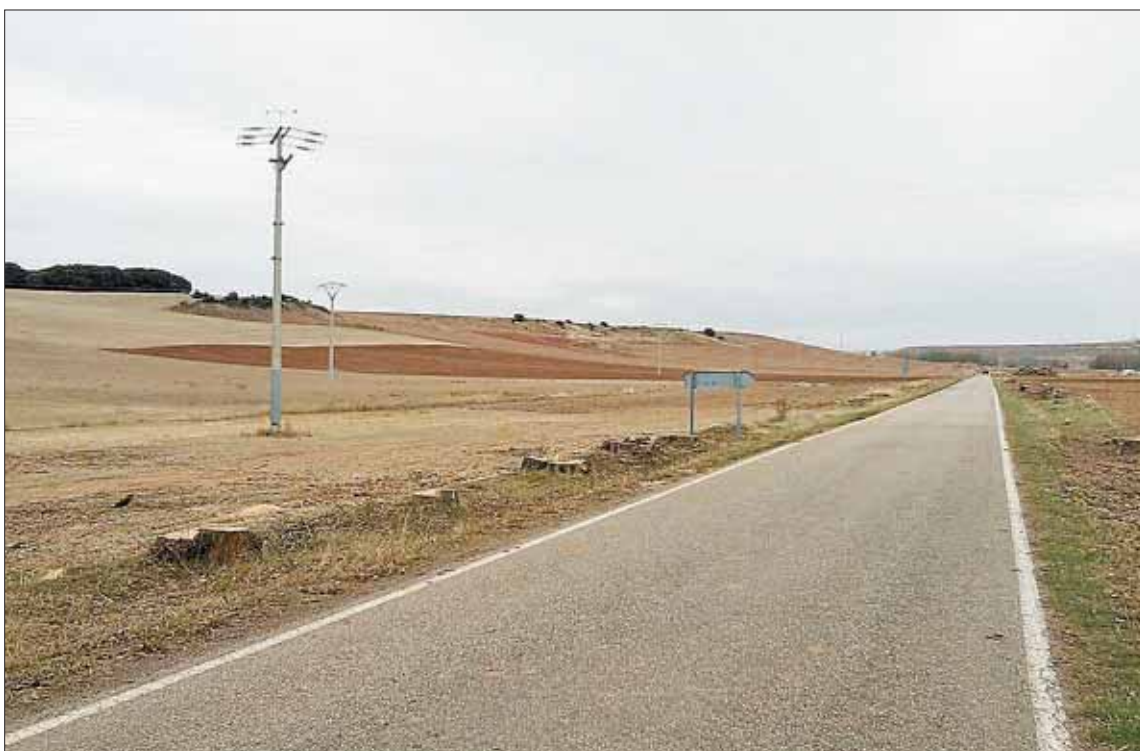
Tras la tala de 200 árboles la localidad ha presentado a la Diputación un proyecto de reforestación.

En total se ha previsto plantar aproximadamente quinientos árboles en el municipio, estos serán de diferentes especies, que cubrirían una superficie total de una