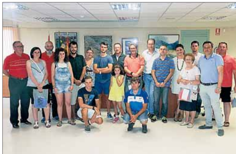
Imagen de la entrega de subvenciones de una convocatoria anterior.