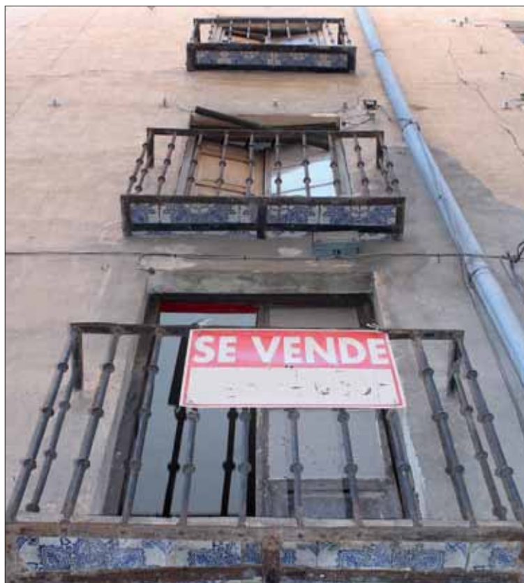
Las operaciones sobre viviendas usadas sumaron 99.343 transacciones.

Los británicos son los que más compras realizan, el 14,9% del total de operaciones de extranje-