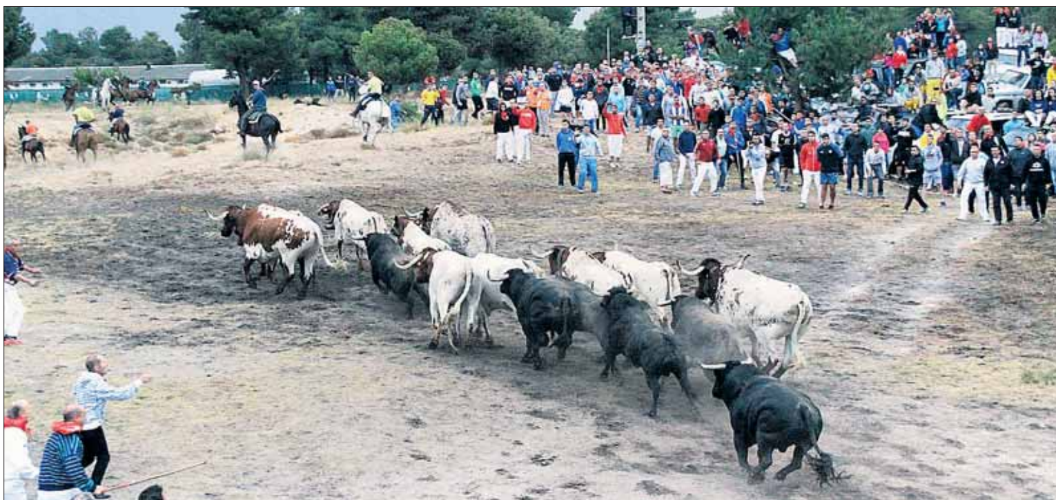
Una rápida salida de los corrales del río Cega no hizo presagiar que el encierro resultara, finalmente, tan complicado.

Se hicieron varias paradas con las reses que quedaban, pe-