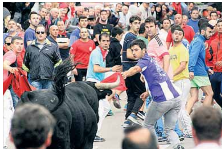
En el campo, el descontrol de las reses fue la tónica dominante.

ro estas acusaban ya un cansancio enorme, pues en sus escapadas en el campo no bajaron el ritmo. También dificultó la tarea a los caballistas la intensa lluvia que cayó en ciertos momentos;