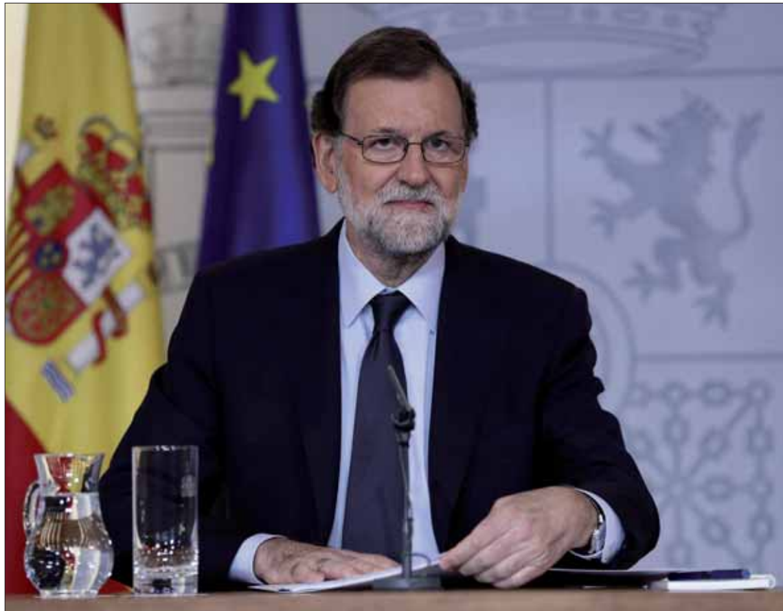
El presidente del Gobierno comparecerá mañana a petición del Congreso de los Diputados.

La semana parlamentaria será intensa porque el Ejecutivo del PP aceptó otras cuatro comparecencias de ministros en comisión antes del 1 de septiembre. Uno de ellos será el titular de Fomento, Íñigo De la Serna, que se ofreció a explicar el papel de AENA en el conflicto del personal de seguri-