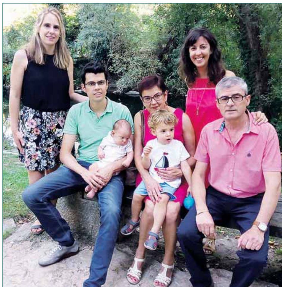
TU MUJER, tus hijos, tus nietos, tu madre, tu nuera, tus hermanos, hermanas, cuñados, sobrinos y toda tu familia y amigos te deseamos muy especialmente felicidades en tu 6o cumpleaños. Brindamos por otros 6o años tan fantásticos como éstos a tu lado!