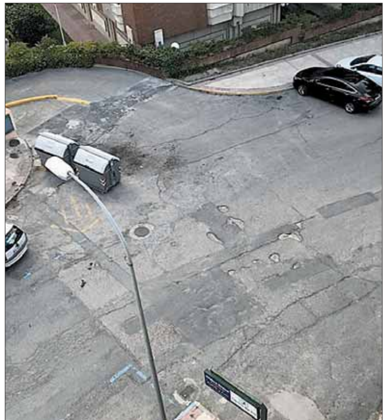
En la imagen el estado de la calle de los Almendros.

Para el PP el mal estado de las calles y aceras de la ciudad es "una constante dentro de las quejas vecinales" y esto "indica claramente que falta mantenimiento e inversión en las mismas". Por eso consideran "necesaria una gestión eficaz que permita dar soluciones a largo plazo así como reservar mayores partidas en los presupuestos para arreglar nuestras calles".