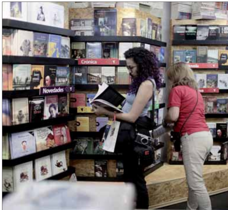
Las ayudas este año serán sensiblemente superiores a años anteriores.

Los proyectos tendrán que tener alguno de los objetivos recogidos en el Plan de Fomento de la Lectura 2017-2020: la celebración de encuentros para profesionales, la elaboración de estudios e investigaciones sobre el sector, las iniciativas que impliquen un funcionamiento más eficaz del funcionamiento de la cadena del libro y de las publicaciones culturales en sus distintas fases, las actuaciones que mejoren la comunicación entre las asociaciones de los distintos agentes editoriales (autores, traductores, ilustradores, edi-