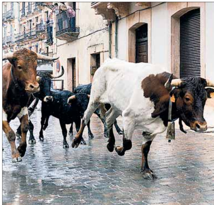
Mansos conduciendo a los becerros en el encierro de ayer.