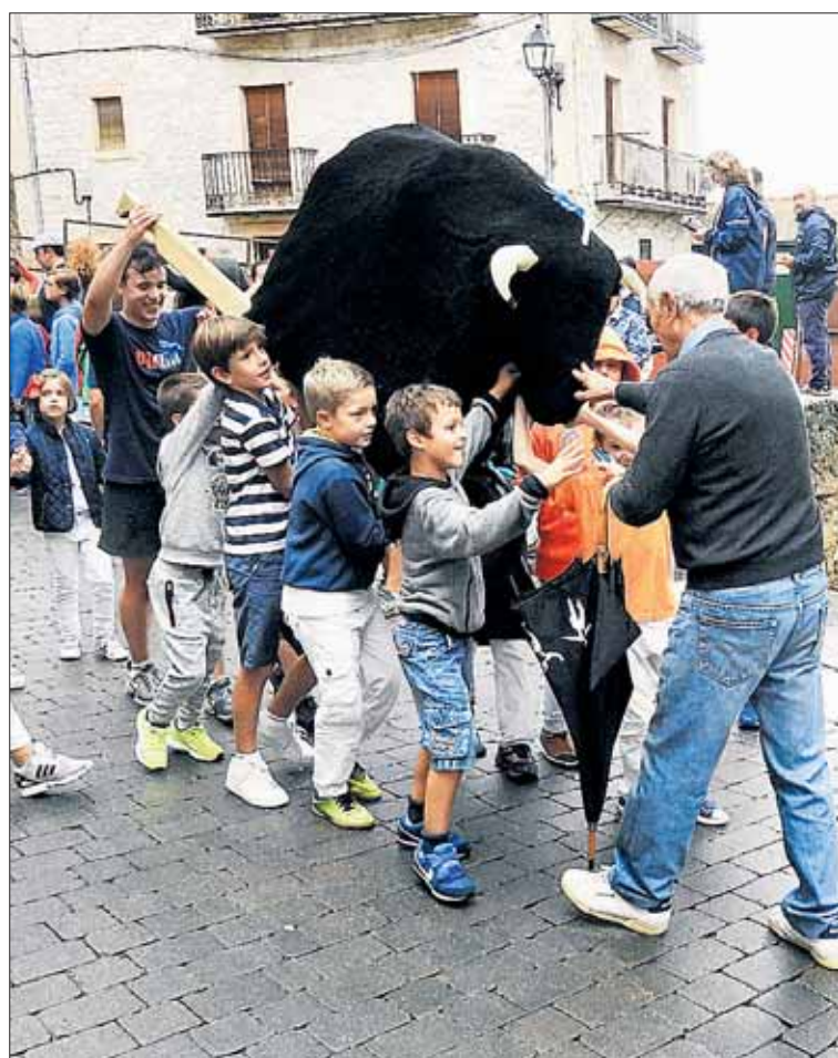
Un grupo de niños lleva uno de los toros de los 'encierros infantiles' a su corral, donde permanecerán hasta el año que viene. / GUILLERMO HERRERO