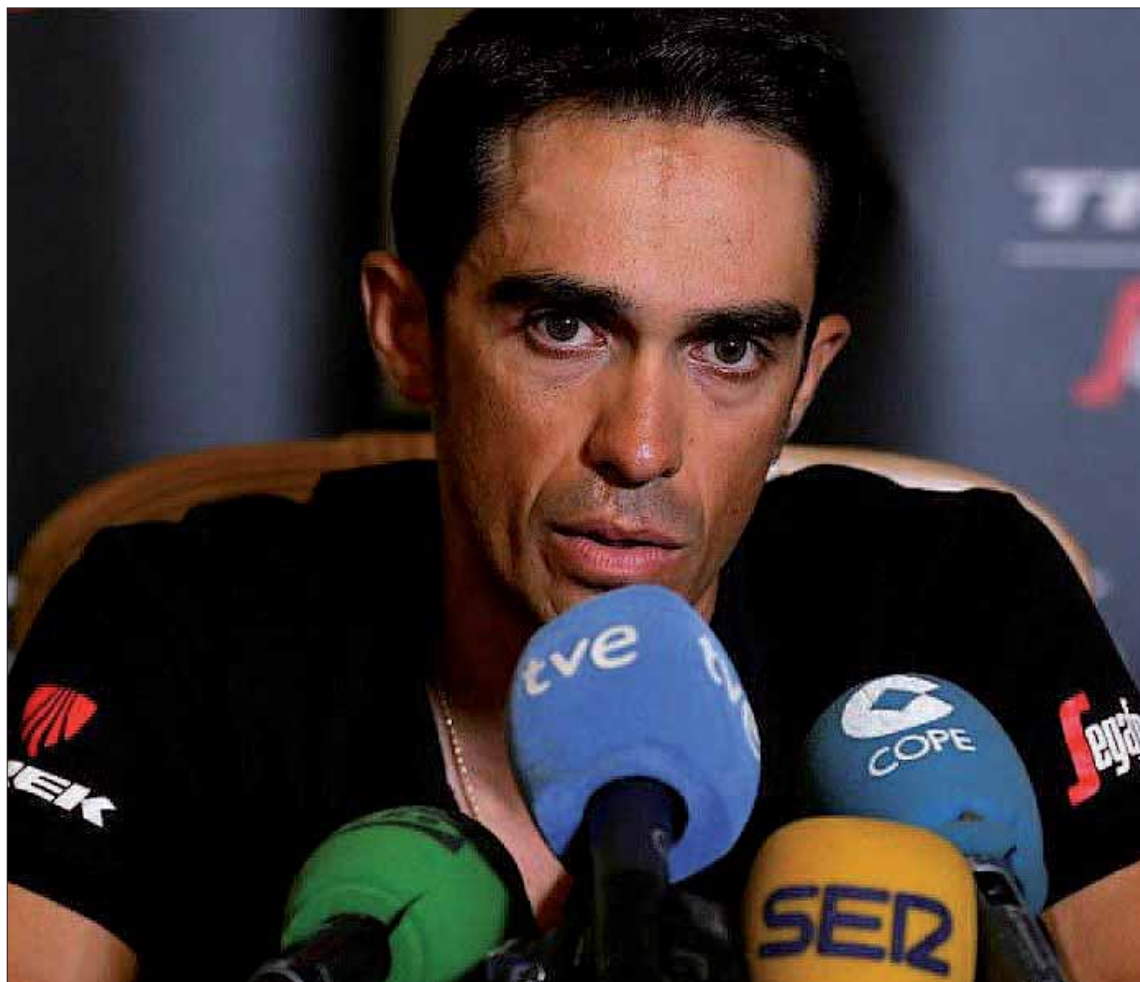
Contador se declaró contento con la carrera que está haciendo, y aunque es realista, no descarta nada deportivamente.

DÍA A DÍA En cualquier caso, el madrileño, decimotercero en la clasificación, recordó que antes de plantearse un posible podio tiene que "superar a todos los que están delante en la general". "Creo que la crono me puede ir bien y es intentar estar lo más cerca posible. El ciclismo es un deporte duro en el que influyen muchos factores y si tienes un mal día es difícil. Hasta que se llegue a Madrid nunca se sabe, voy día a día y veremos dónde acabo", analizó.