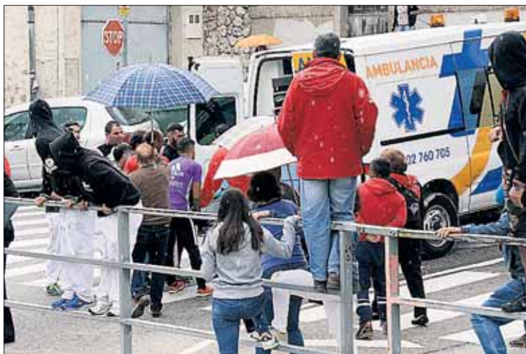
Un joven recibió un puntazo en el gemelo, herida leve.