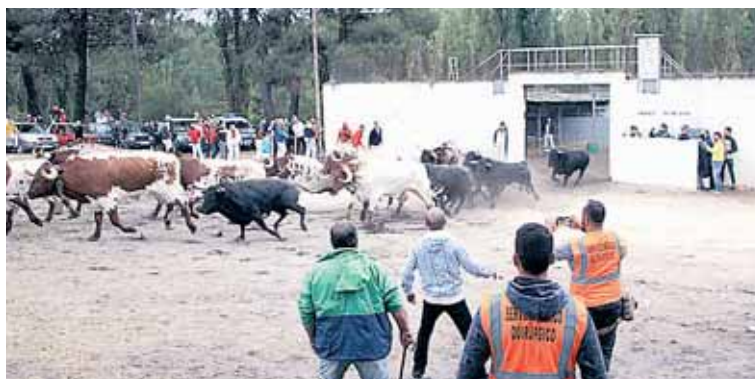
La expectación en la salida de los corrales es máxima.