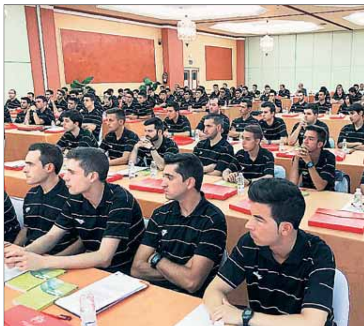
Una de las charlas técnicas sobre las novedades de la nueva temporada.

Por otro lado, la Federación ha abierto el plazo de inscripción para los diferentes curso de monitor -básico y avanzado- tanto de fútbol como de fútbol sala.