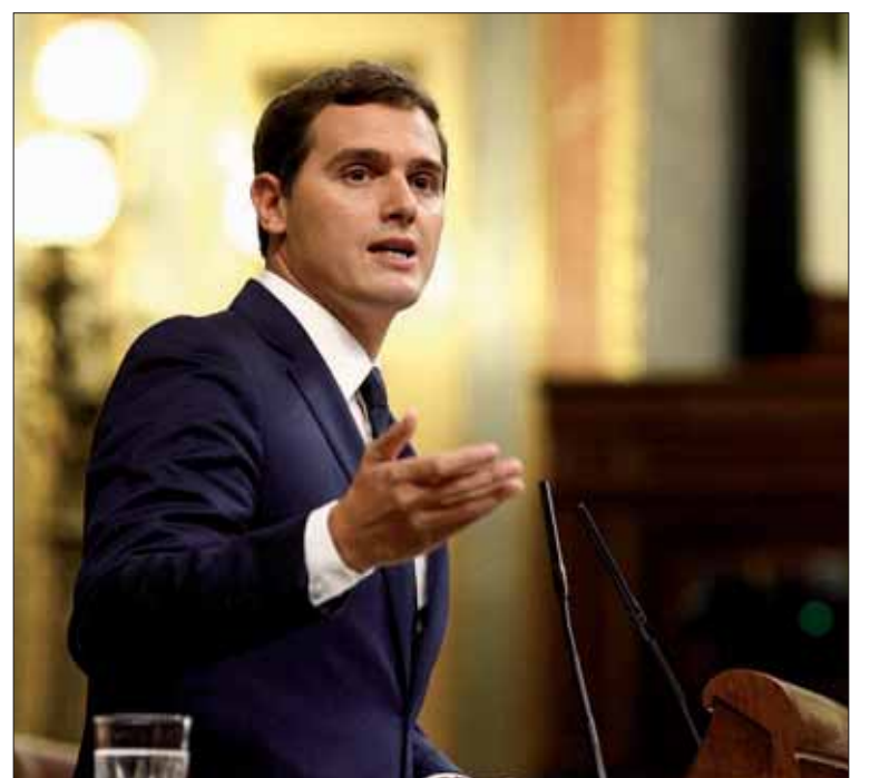
Albert Rivera durante la sesión de investidura de Mariano Rajoy.