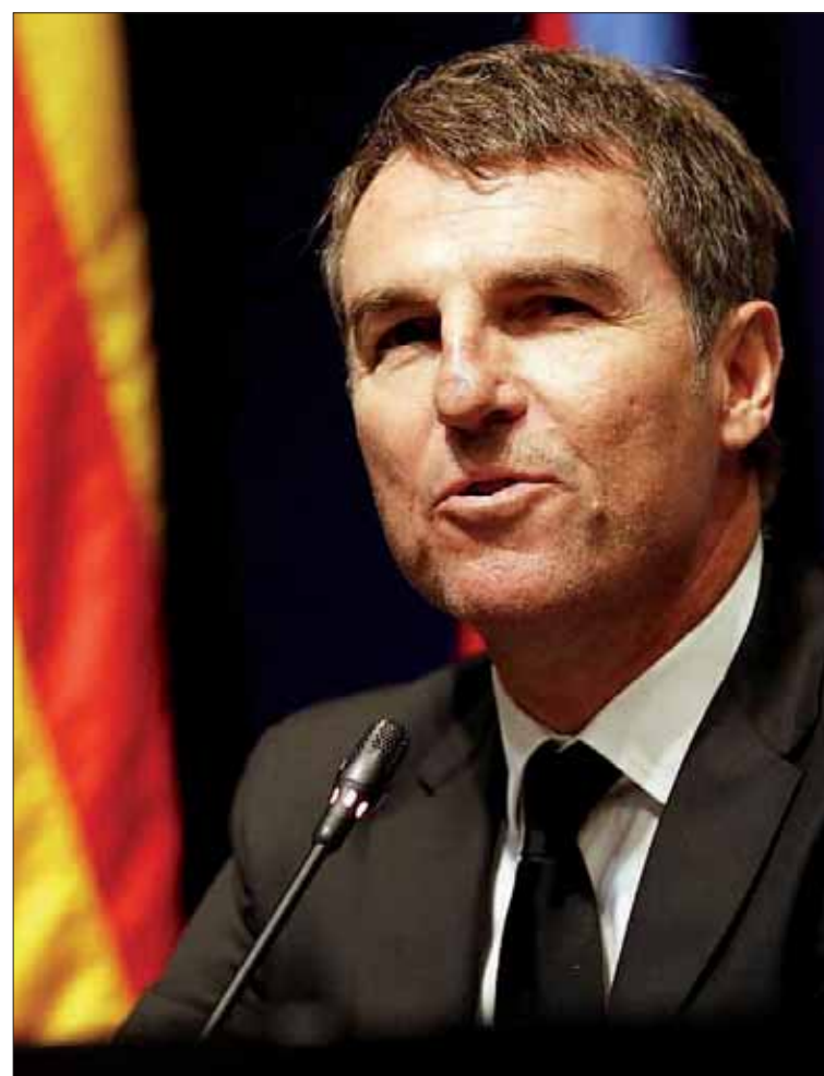
"La intención es que llegue un jugador más o si es posible dos".