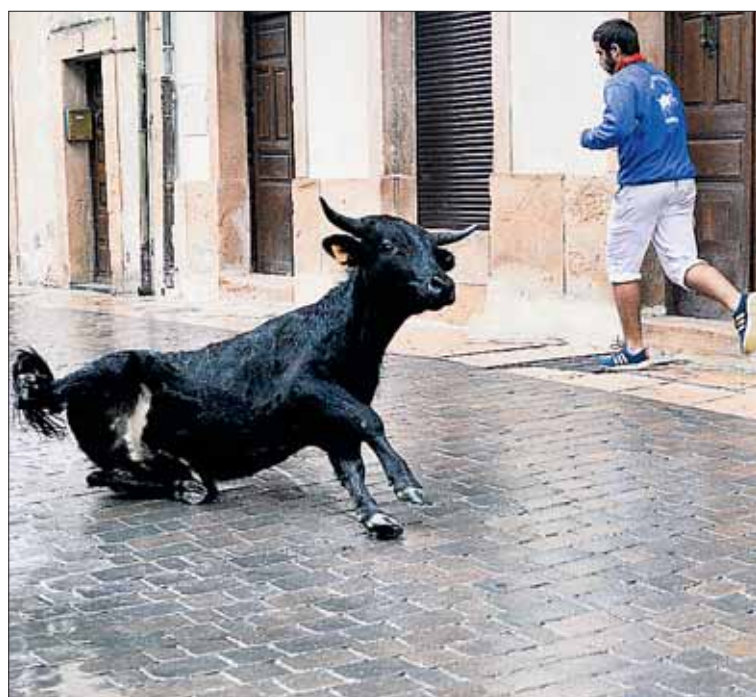
Momento en el que uno de los becerros resbala por la lluvia.