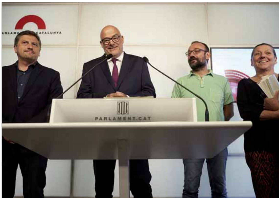
Los representantes de Jxsí y la CUP durante la rueda de prensa.

Poco después registraron la ley en el Parlament con el título ‘Ley de transitoriedad jurídica y fundacional de la república’, que cree que define la norma: “Una parte de transitoriedad, porque cubre el periodo entre el referéndum, la victoria del ‘sí’ y la celebración de unas elecciones constituyentes; y una fundacional, porque a partir de cuando gane el ‘sí’ se genera una situación jurídica nueva, que