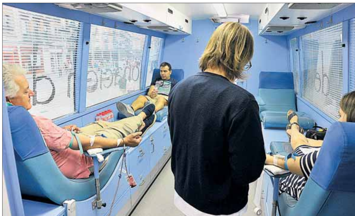
Actividad en la unidad móvil del Centro de Hemoterapia y Hemodonación de Castilla y León.

Además de acudir ante las unidades móviles que se desplazan por la provincia captando la soli-