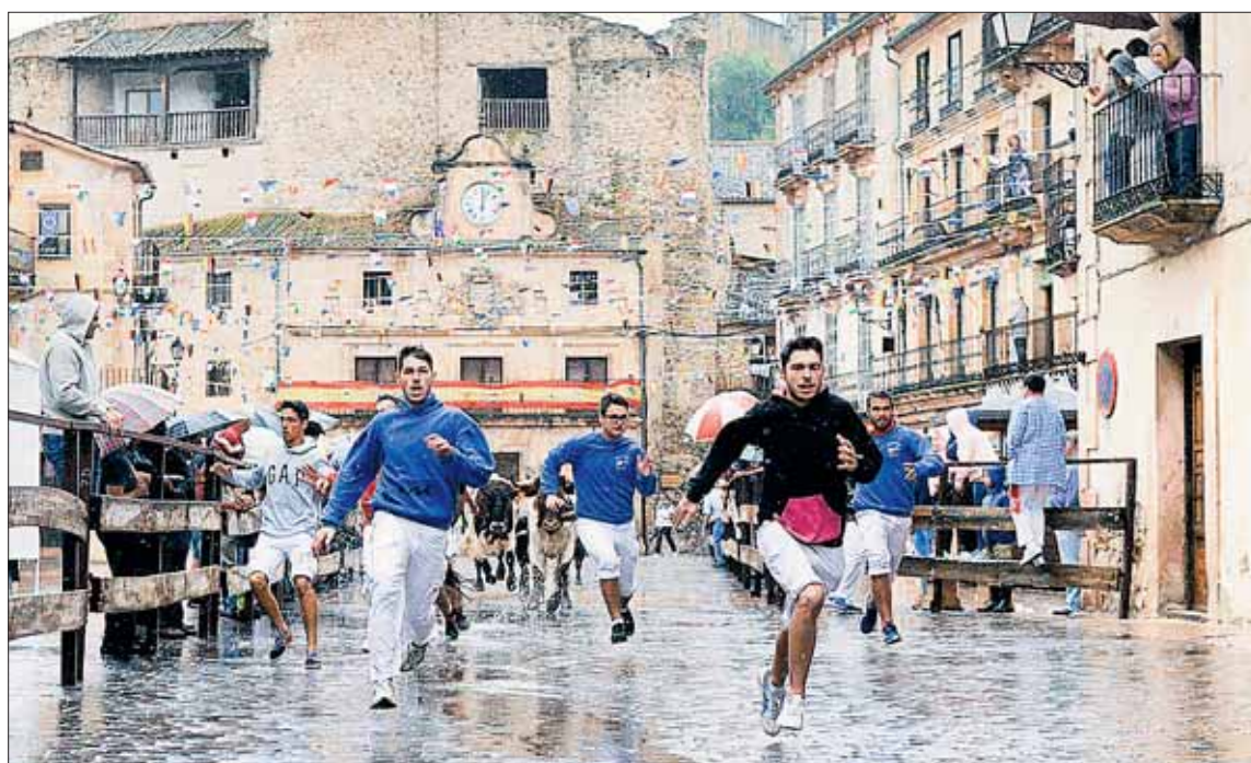
En la imagen unos mozos corren delante de los animales durante un tramo del recorrido.