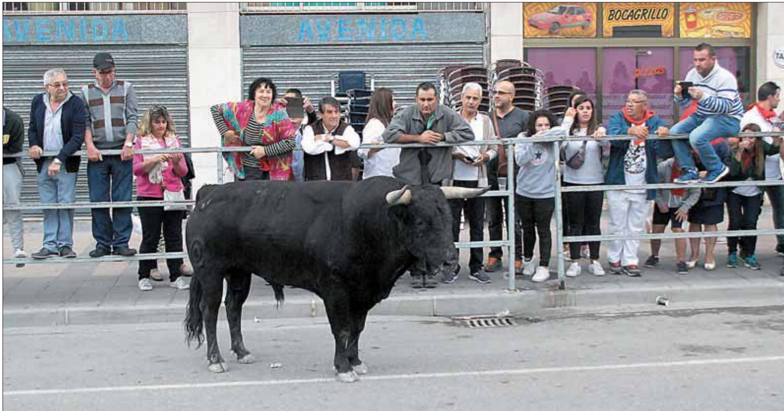
Uno de los astados, quieto en el recorrido urbano, ocasionó incertidumbre durante su presencia en las calles.

propone la formación magenta considera que son su aportación dentro del proceso participativo de consulta pública previa relativa a la ordenanza para la protección del entorno del Acueducto.