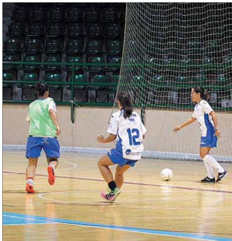
Primera toma de contacto de las integrantes del Unami con balón.