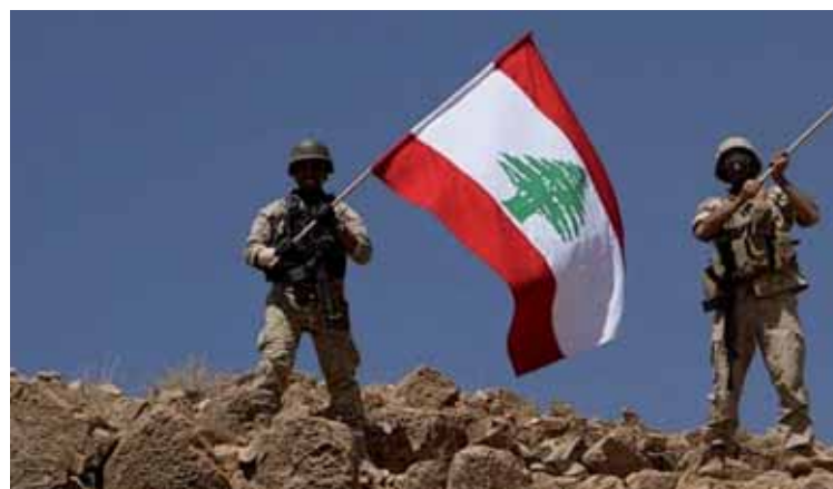
Soldados del ejército libanés en la frontera con Siria.

En un breve comunicado publicado por la agencia estatal siria de noticias, SANA, Damasco resaltó que "tras los éxitos logrados por las Fuerzas Armadas, con la cooperación de la resistencia nacional libanesa (en referencia a