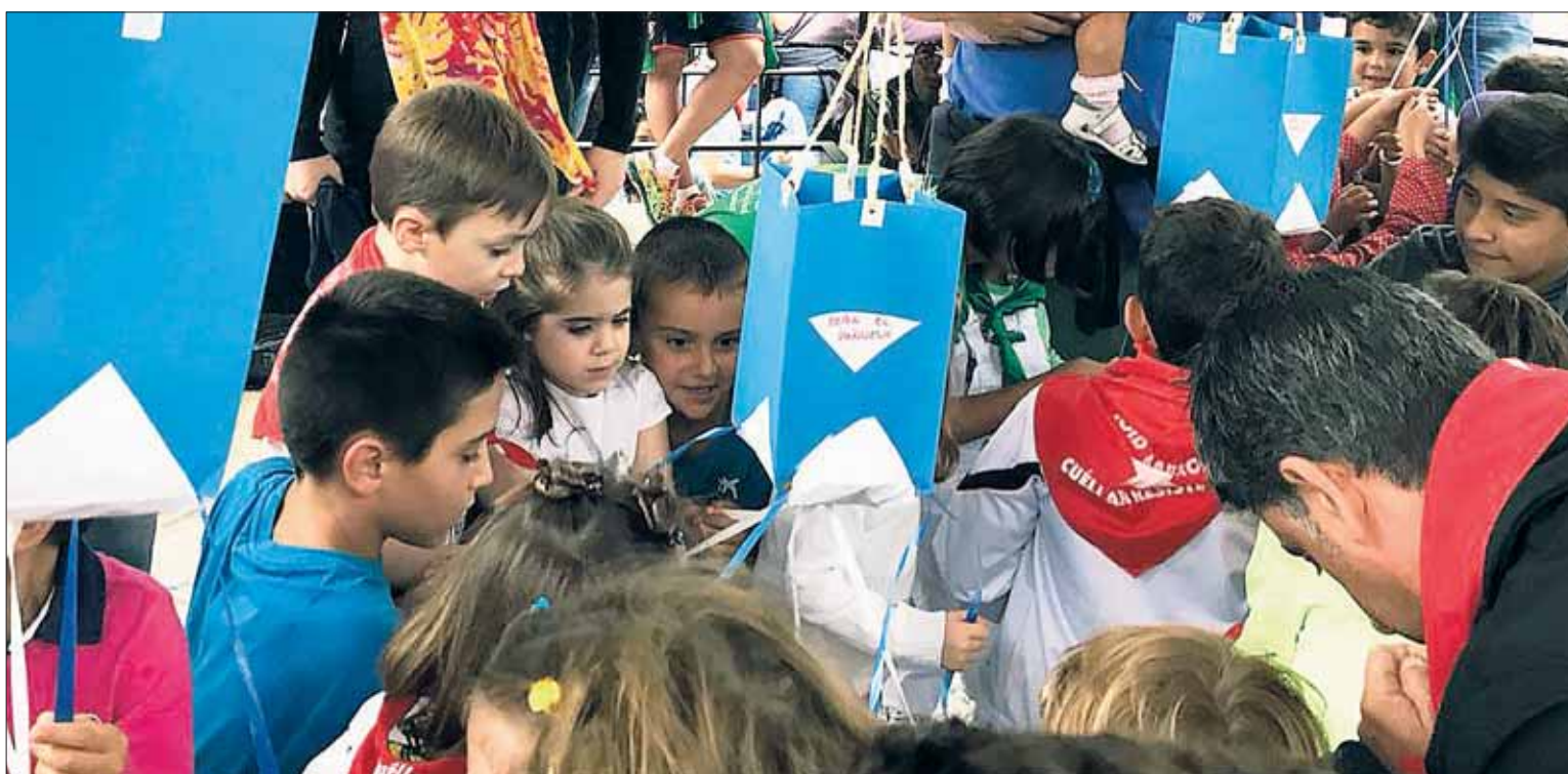
Las tradicionales piñatas, al resguardo del templete de los paseos, permitieron que se celebrara esta actividad infantil.

Sí dio tregua el tiempo para el encierro de promoción, que consiguió no dejar con las ganas a los más jóvenes corredores. En este primer encierro de promoción celebrado ayer, las promesas en esto del correr encierros se dejaron ver, desde San Francisco hasta la Plaza de Toros, haciendo este recorrido varias veces para disfrute de los chavales y del público. Fue a continuación cuando las actividades se fueron cayendo del programa, al igual que lo hizo el concierto de la noche del domingo. El grupo vallisoletano no 'Dos Orillas' no pu-