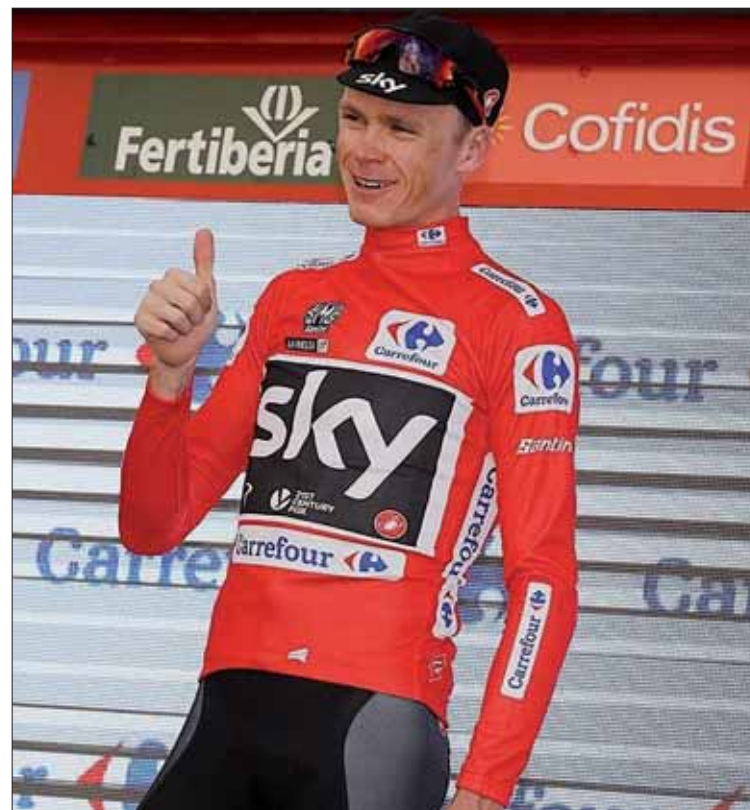
Froome alabó la buena predisposición del público español.

Además, Froome explicó cómo se plantea el próximo Mundial que se disputará del 16 al 24 septiembre en Noruega "Depende cómo salga de forma de la Vuelta podría intentar disputar la contrarreloj por equipos del Mundial de Bergen, ya que la ruta no me interesa", avanzó.