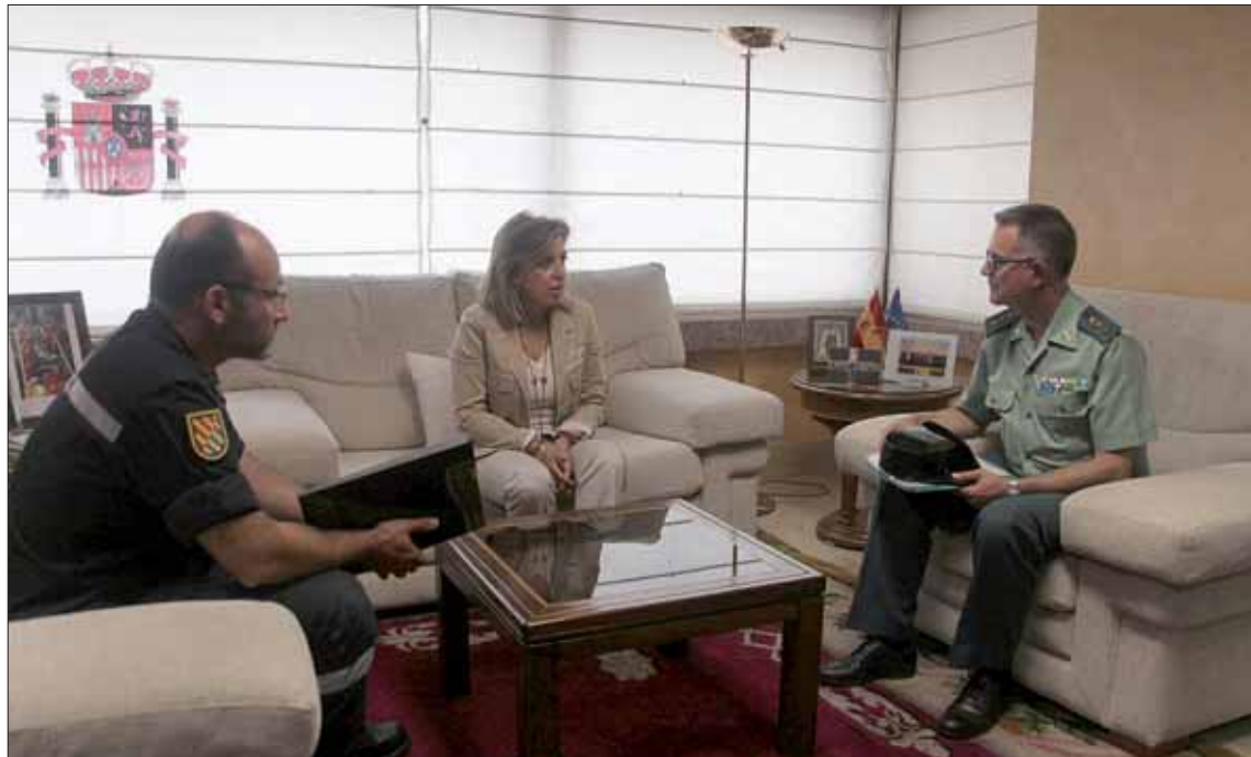
La delegada del Gobierno con el coronel Clemente García Barrios y el teniente coronel Álvaro Díaz Fernández

Este agradecimiento de la delegada del Gobierno se refiere a la dedicación que estos Cuerpos y Fuerzas de Seguridad del Estado (Guardia Civil, Policía Nacional y del Ejército (Unidad Militar de