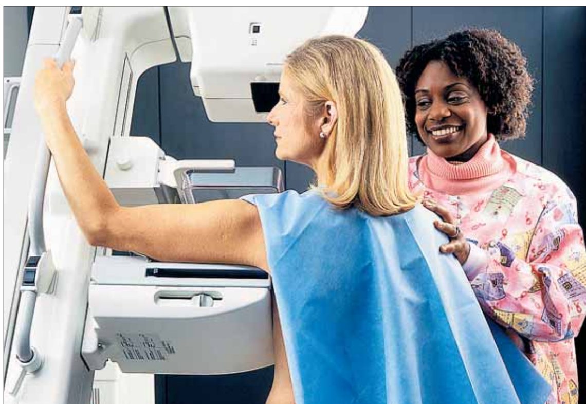
Los mamógrafos permiten realizar estudios de las mamas, así como determinar lesiones y hacer diagnósticos avanzados.

Hay que recordar que los dos mamógrafos por tomosíntesis serán financiados por la Fundación Amancio Ortega, y uno se destinará a pruebas diagnósticas