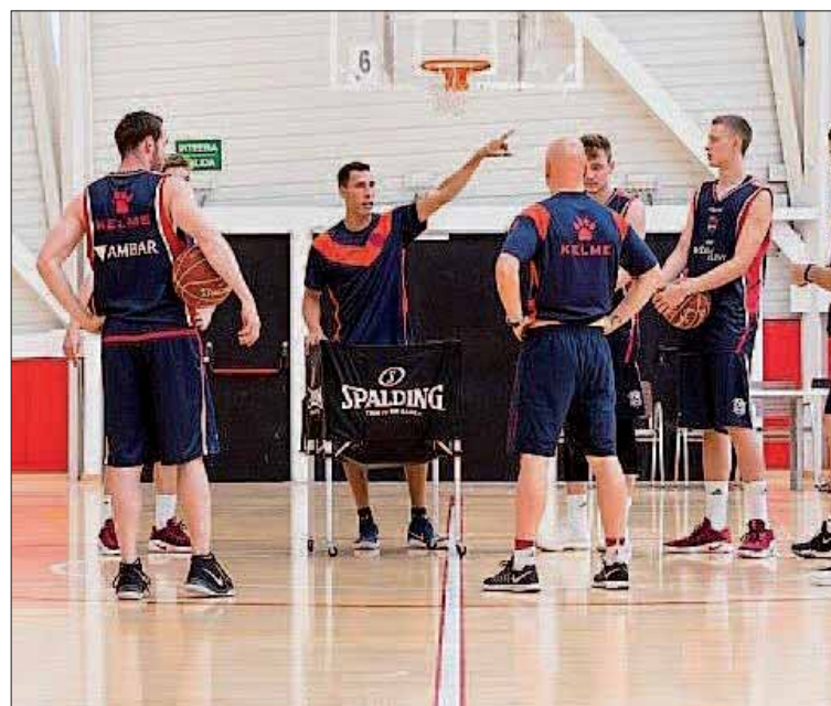
Un momento de los entrenamientos del Saski Baskonia.

El argentino también habló acerca del nuevo método de entrenamiento que está siguiendo en esta pretemporada, el estilo 'americano', aunque reconoció que ya "no es tan americano porque lo utilizan muchos equipos europeos", y que se caracteriza en unir la sesión de físico y de balón