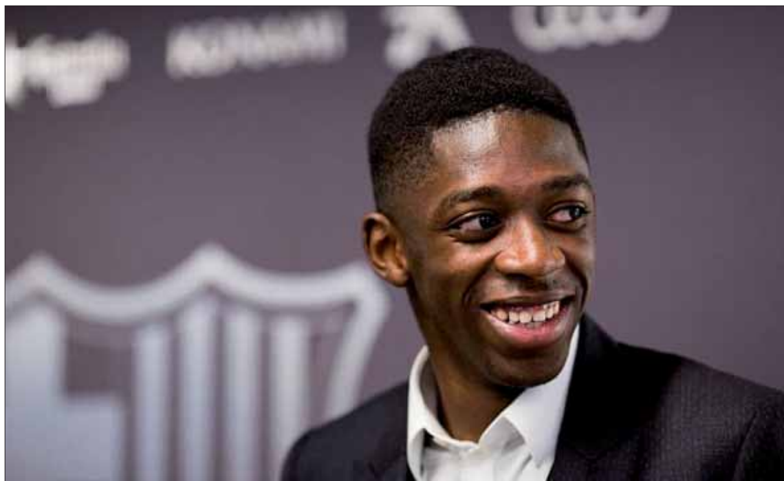
El nuevo jugador del Barcelona declaró que para él será "un honor y un placer" poder jugar con Messi.

También aseguró que para él es "un honor y un placer" poder jugar con Messi. "Quiero aprender, ver qué hace, es un jugador