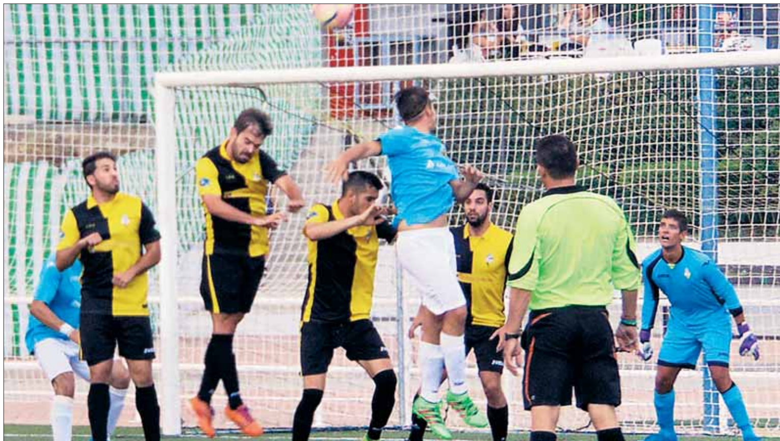
La UD El Espinar San Rafael ataca en un córner sobre el área del CD Galapagar durante el partido amistoso disputado en el campo madrileño.

Poco después otra internada por banda derecha, acabó en sa-