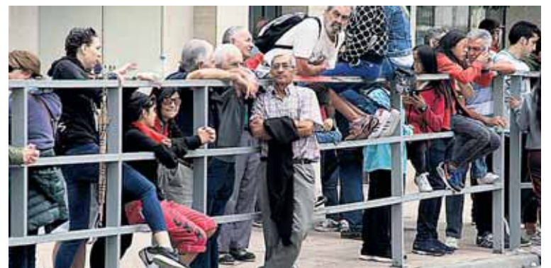
La espera en las calles se hizo larga, aunque los cuellaranos aguantaron.