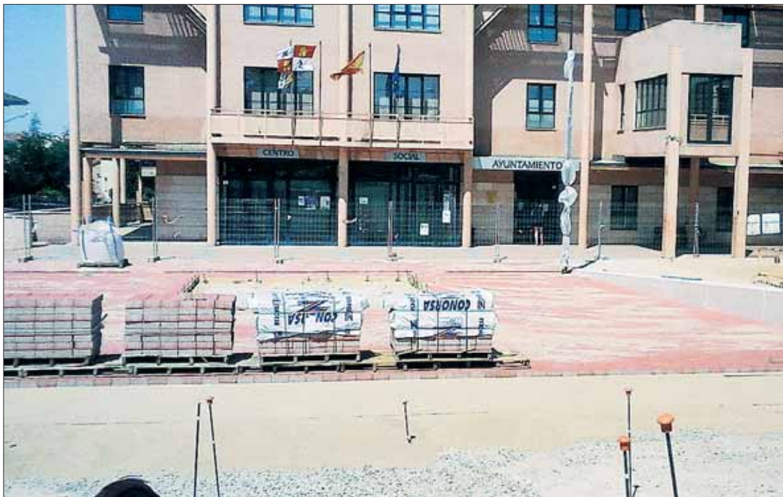
Estado actual de las obras de la Plaza Mayor cuya finalización se retrasará más de un mes.

La empresa Segesa, adjudicataria de las obras de construcción de la nueva Plaza Mayor de Palazuelos de Eresma, inició el 19 de