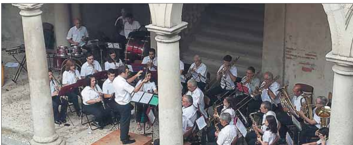
Actuación de la Banda Municipal de Nava de la Asunción el domingo en Martín Muñoz.

La actuación se encontraba dentro del programa 'Aperitivos a banda' de la Diputación Provincial de Segovia con la colaboración del Ayuntamiento de Martín Muñoz de las Posadas. El ciclo lleva por toda la provincia una selección de las mejores bandas de música locales, que ofrecen lo mejor de su repertorio en conciertos al aire libre.