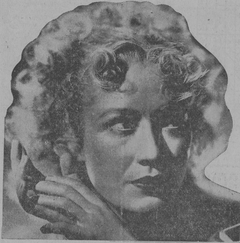
Los bellos rostros del cine: Miriam Hopkins

Barrymore continúa viviendo en una especie de buhardilla escondida arriba de uno de los escenarios, en donde pasa horas placenteras