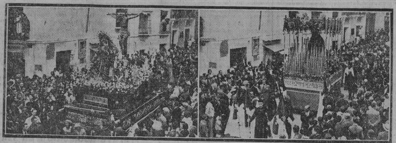
La Virgen del Subterráneo y la Hermandad de la Hiniesta á su paso por L. Correduría.