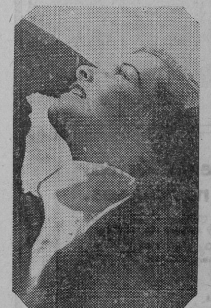
Para los que siguen con interés la evolución artística del cine, la figura de Katharine Hepburn, uno de los más firmes valores actuales, es bastante familiar.

Igualmente, el gobernador aclara que las bases de trabajo en la Agricultura son las aprobadas en este Gobierno civil y publicadas en el «B. O.» número 285, año 1932, salvo en la parte referente a la recolección de aceituna que fueron modi-